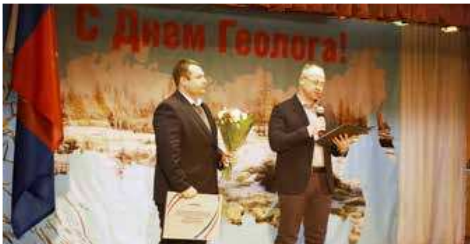
В честь праздника нефтегазодобытчики вручили представителям администрации села денежные сертификаты