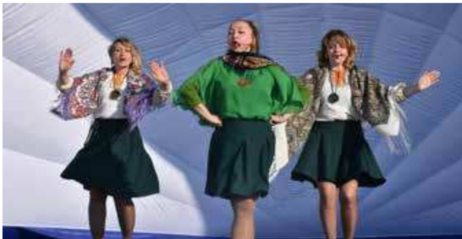
На площади перед сельским Домом культуры для газсалинцев выступали приезжие артисты