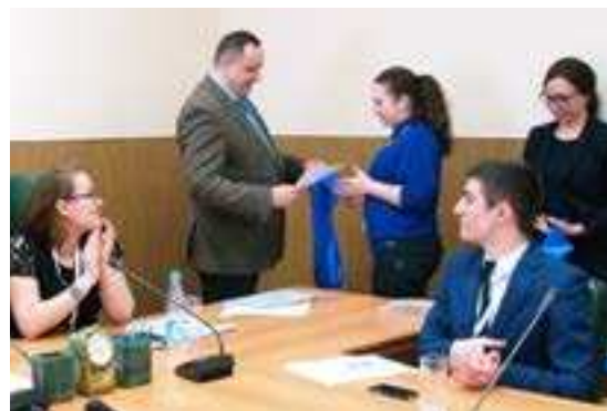
Все участники Дня молодёжного самоуправления получили сертификаты