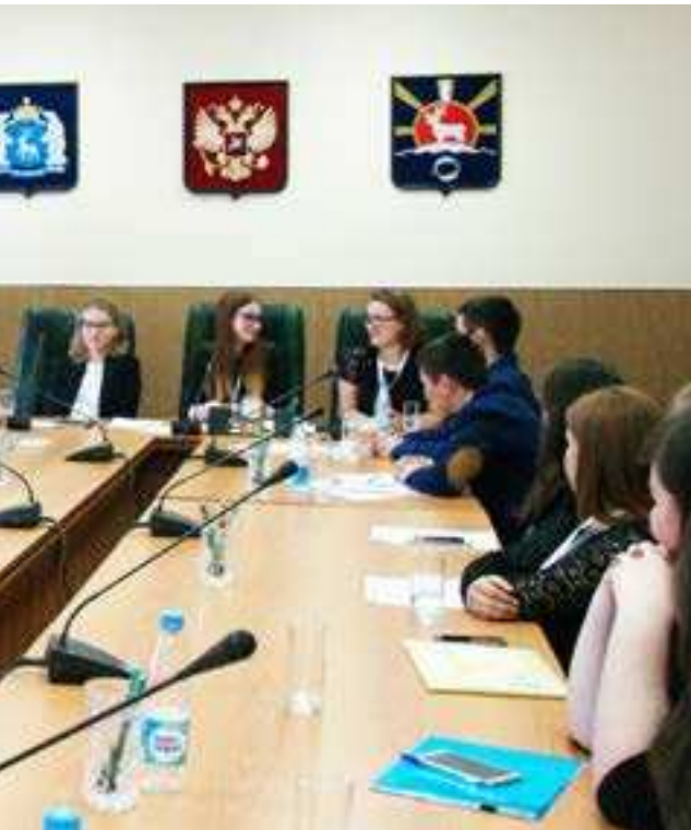
Итоговое совещание участников Дня молодёжного самоуправления

ОСТАВЬТЕ КОММЕНТАРИЙ К ЭТОЙ ТЕМЕ НА НАШЕМ САЙТЕ WWW.SOVETSKOE.ZAPOLYARIE.RF