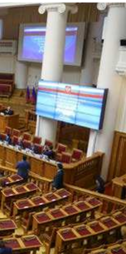
Заседание Совета законо- дателей РФ в Тав- рическом дворце Санкт-Пе- тербурга

ОСТАВЬТЕ КОММЕНТАРИЙ К ЭТОЙ ТЕМЕ НА НАШЕМ САЙТЕ WWW.SOVETSKOYE ZAPOLYARIE.RF