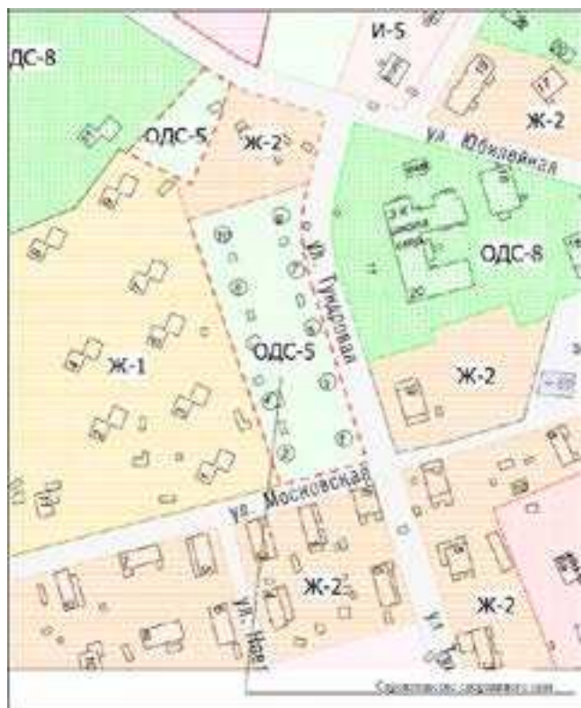
Схема изменения карты градостроительного зонирования муниципального образования село Антипаюта Участок «Строительство дизельной электростанции»