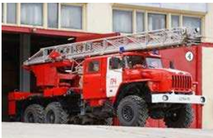
Динамика пожаров на территории Тазовского района за последние 5 лет

« - Возглавляемый мною коллектив самый лучший - подтверждение тому - очередная победа в конкурсе «Славим человека труда».