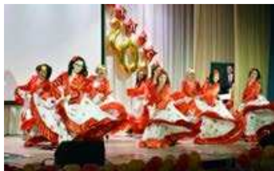
Эффект- ный танец- поздрав- ление от мам вы- пускников