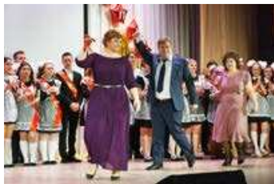
Симво- лический последний звонок от классных руководи- телей

■ БОЛЬШЕ ФОТОГРАФИЙ К ЭТОЙ ТЕМЕ НА НАШЕМ САЙТЕ WWW.SOVETSKOE ZAPOLYARIE.RF