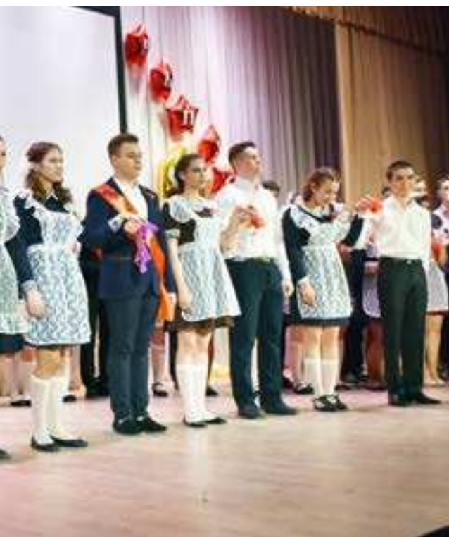
Чсть подать последний школьный звонок вы- пала сразу 10 выпуск- никам

■ БОЛЬШЕ ФОТОГРАФИЙ К ЭТОЙ ТЕМЕ НА НАШЕМ САЙТЕ WWW.SOVETSKOE ZAPOLYARIE.RF