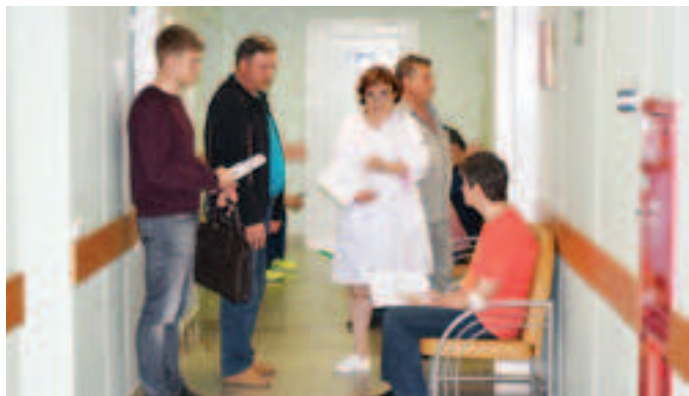
Быстрый медосмотр - и вахтовики снова поедут на промысел добывать газ

Вот так раз в год на несколько часов каждый из работников «Газпром добыча Ямбург», проживающих вахтовым методом в Новозаполярном, отвлекается от выполнения своих профессиональных обязанностей, чтобы врачи смогли удостовериться в его здоровье. А потом снова в бой - на передовую добычи полезных ископаемых. И пока они там наблюдают за датчиками, отделяют газ от конденсата, пускают голубое топливо в газопровод, за их здоровьем продолжают пристально следить в кабинетах и лабораториях высококвалифицированные врачи ООО «Газпром добыча Ямбург».