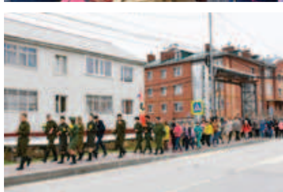
Десятки тазовчан прошли по улицам райцентра

Колонна из нескольких десятков тазовчан, в том числе отряды из пришкольных лагерей, представители казачьего общества, прошла по улицам райцентра, неся в руках символические свечи. В 12 часов возле памятника воинам-тазовчанам, погибшим в годы Великой Отечественной войны начался митинг. Пришедшие минутой