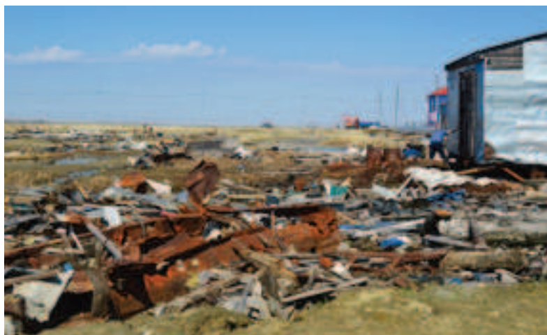
Несанкционированная свалка в микрорайоне Маргулова

ОСТАВЬТЕ КОММЕНТАРИЙ К ЭТОЙ ТЕМЕ НА НАШЕМ САЙТЕ WWW.SOBETSKOESKOZPOLYARJE.RF