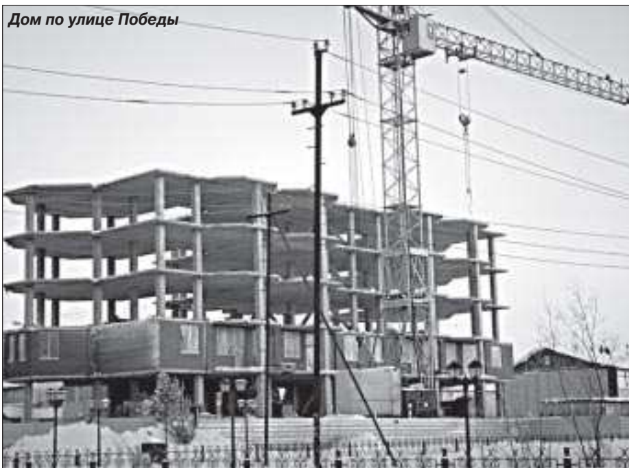
Дом по улице Победы

- Как Вы думаете, цена на жилье будет падать?