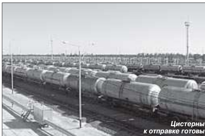
Цистерны к отправке готовы

В 80-х годах его жизнь изменилась кардинально. В 1982 году окончил Новополюцкий нефтяной техникум по специальности техник-механик оборудования нефтеперерабатывающих и химических заводов. А 1984 год ознаменован началом трудовой деятельности на Крайнем Севере, в тогда еще небольшом поселке Тарко-Сале. Начинать с помбур на буровой, так как считал, что быть в Тюмен-