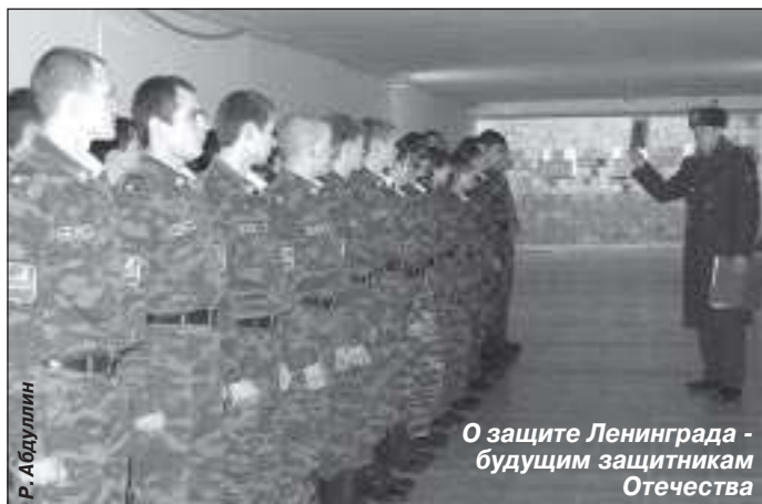
О защите Ленинграда - будущим защитникам Отечества

В преддверии празднования 65-й годовщины со дня снятия блокады Ленинграда состоялся ряд обучающих мероприятий, посвященных этой дате. В них приняли участие курсанты кадетских клас-