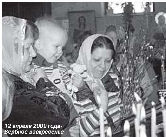
12 апреля 2009 года - Вербное воскресенье

- Пятница - день страданий. В этот день Христос претерпел крестные муки, скончалась человеческая плоть Его. Именно в пятни-