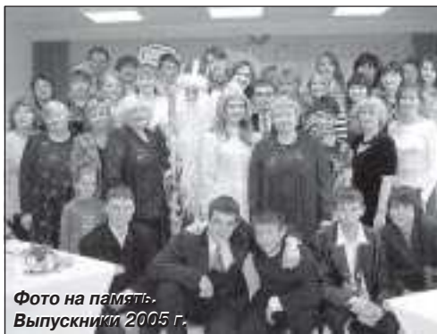
Фото на память. Выпускники 2005 г.