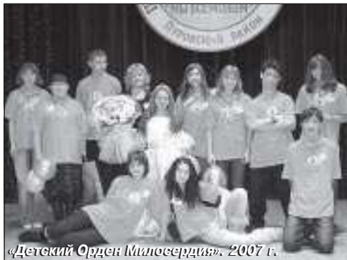
«Детский Орден Милосердия». 2007 г.

С российской общественной организацией «Детский орден милосердия» ДДТ сотрудничает с 2003 г., здесь четвертый год реализуется целевая программа «Дети-инвалиды».