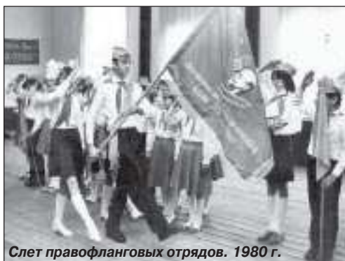
Слет правофланговых отрядов. 1980 г.