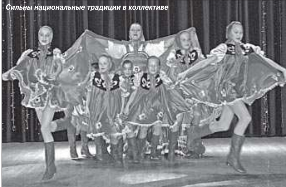
Сильны национальные традиции в коллективе