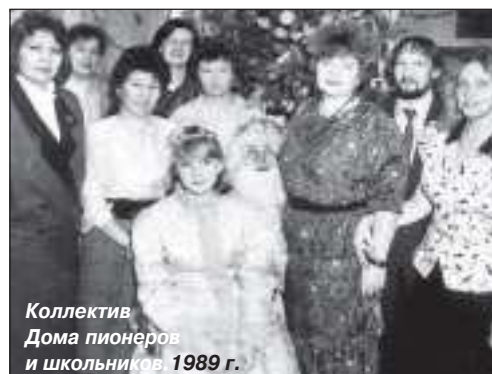
Коллектив Дома пионеров и школьников. 1989 г.

С 2000 г. налажено сотрудничество с молодежной редакцией ТРК «Луч», вследствие чего появилась детская телестудия «Мой маленький мир», где вместе со старшими коллегами юные журналисты занимаются под-