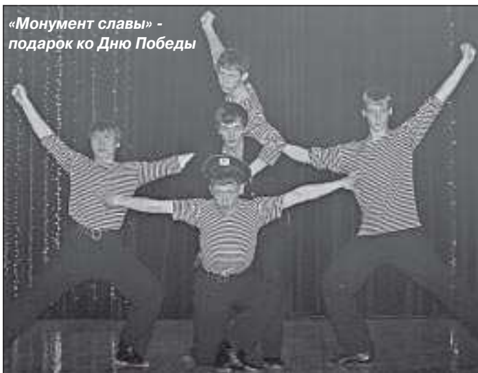
«Монумент славы» - подарок ко Дню Победы

соток». Вот уж действительно хит на все времена.