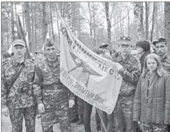
Члены отряда «Забывтый Полк» со знаменем отряда