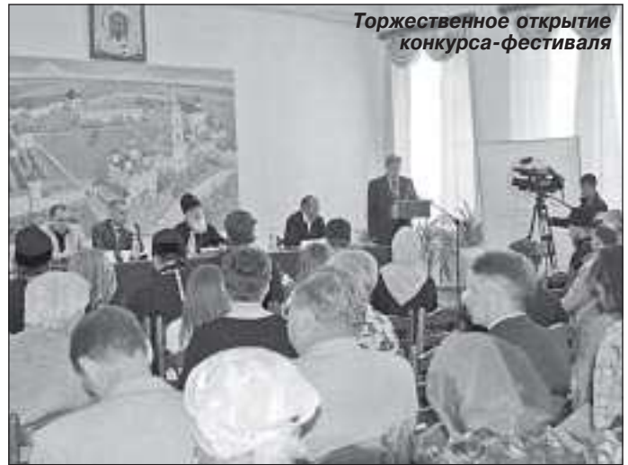
Торжественное открытие конкурса-фестиваля

Стараниями организаторов – Тобольско-Тюменской епархии русской православной церкви, департамента информационной политики и комитета по делам национальностей Тюменской области – конкурс-фестиваль превратился в поистине волнительное и грандиозное действо. Настолько сердечной была атмосфера, насыщенной программа, открытыми и откровенными участниками и хозяева мероприятия, что два дня пролетели, как один миг. Но, несмотря на это, они успели запомниться: и божественной литургией, проведенной архиепископом Тобольским и Тюменским Димитрием в Покровском соборе Тобольского кремля, и фестивалем колокольного звона, и пресс-конференцией архиепископа Димитрия, пре-