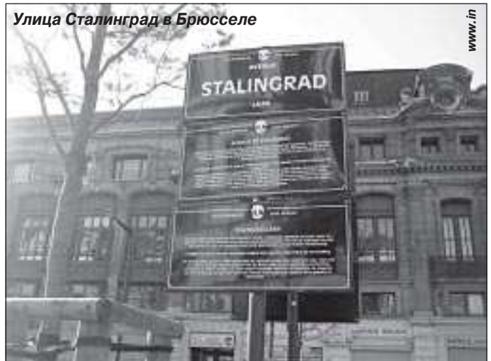
Улица Сталинград в Брюсселе