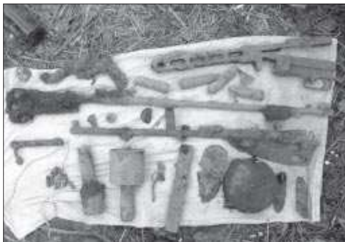
Будущие экспонаты музея

В ходе поиска нашли четыре 120-миллиметровые мины от миномета, ящик (15 штук) снарядов от немецкой проти-