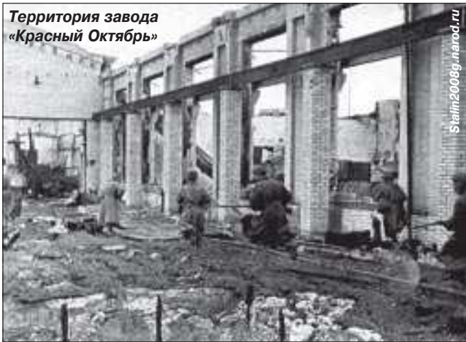
Территория завода «Красный Октябрь»

дед был командиром минометной роты. Из них ясно только то, что полк вел ожесточенные бои на улицах города.