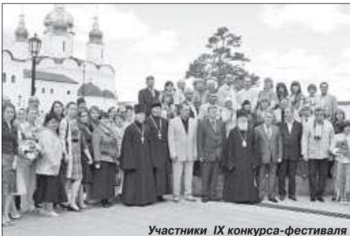
Участники IX конкурса-фестиваля