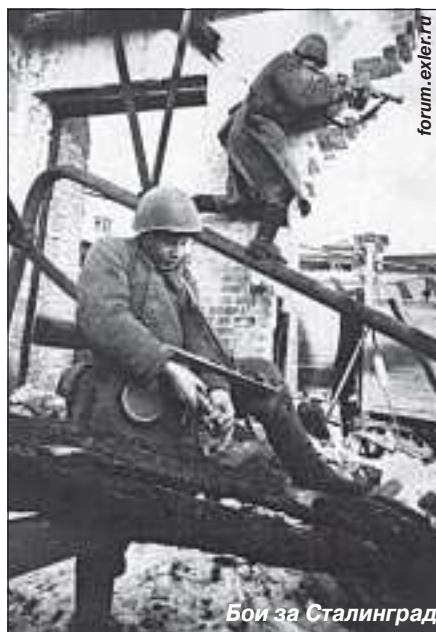
Бои за Сталинград

Особый интерес вызывает, конечно, последняя страница списка, а именно пункт 23 «Прохождение военной службы в Вооруженных Силах Союза ССР». Отсю-