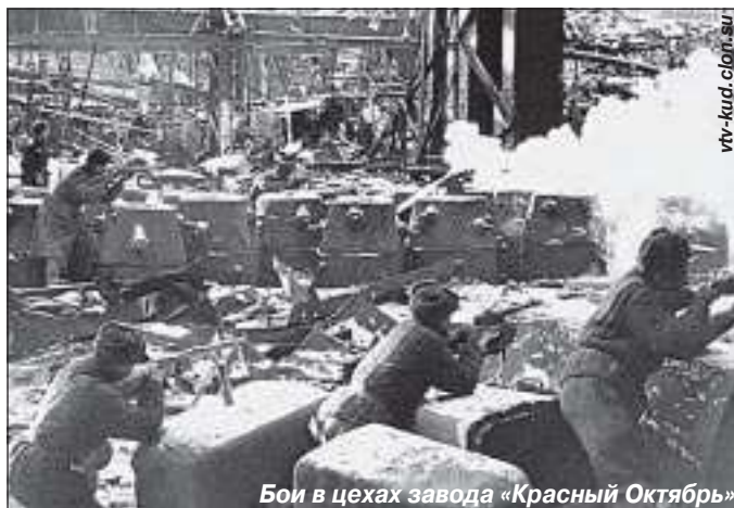
Бои в цехах завода «Красный Октябрь»