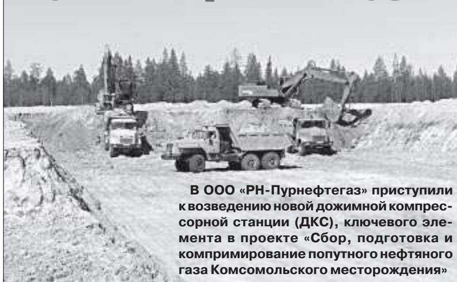
В ООО «РН-Пурнефтегаз» приступили к возведению новой дожимной компрессорной станции (ДКС), ключевого элемента в проекте «Сбор, подготовка и компримирование попутного нефтяного газа Комсомольского месторождения»

щадки ДКС. В 2009 году получено разрешение государственных надзорных органов на строительство ДКС Комсомольского месторождения и подготовлена площадка для строительства.