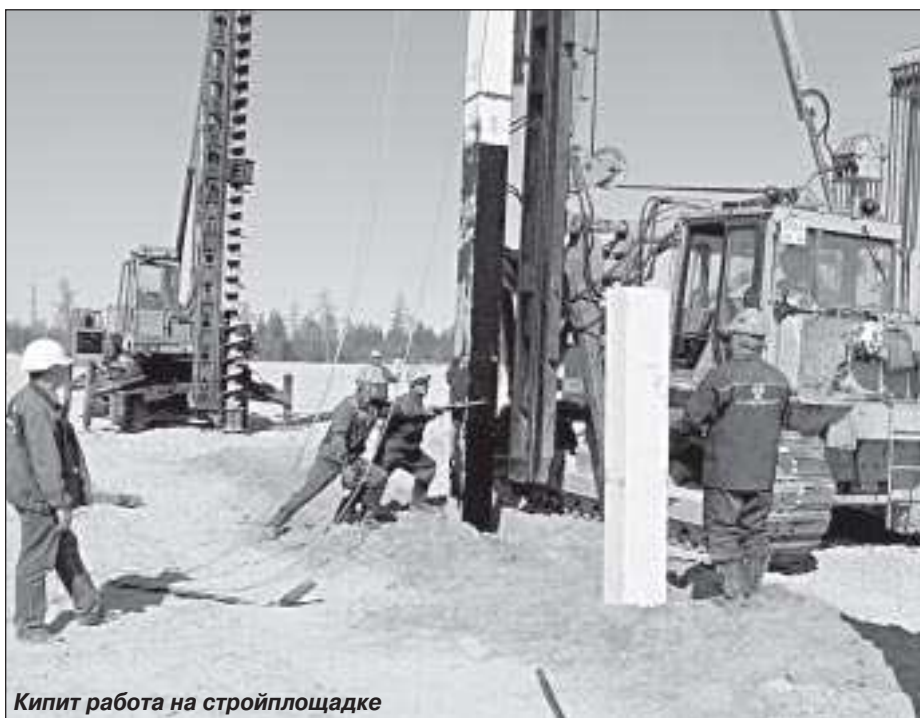
Кипит работа на стройплощадке

деть следующим образом. Попутный нефтяной газ будет подаваться для подготовки (осушки) от установки предварительного сброса воды (УПСВ) Комсомольского месторождения на ДКС. Кроме того, на ДКС будет осуществляться прием природного газа с газоконденсатной залежи Барсуковского месторождения. Уже осушенный газ пройдет в компрессорах этап компримирования (то есть сжатия и охлаждения) для снижения содержания в нем влаги и тяжелых углеводородов. Подготовленный таким образом товарный продукт поступит в магистральный газопровод транспортной системы