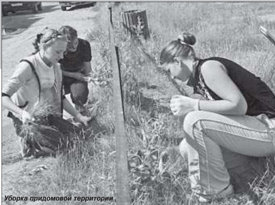
Уборка придомовой территории

В соответствии с выделенными денежными средствами «Пуровские электрические сети» выполняют работы по замене опор и проводов по улице Магистральной, заменят основание под подстанцией на улице Монтажников.