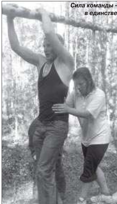
Сила команды - в единстве