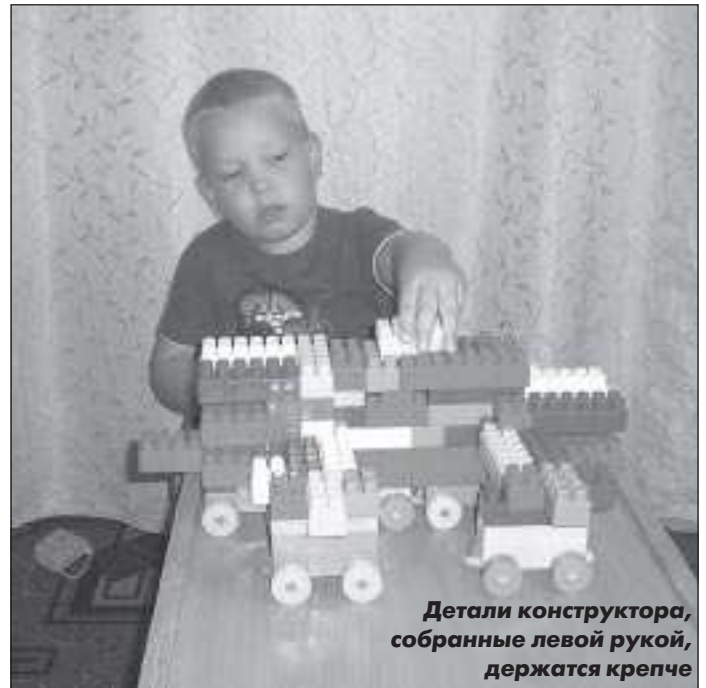
Детали конструктора, собранные левой рукой, держатся крепче

Но есть такие инструменты, которые сделаны правшами и для правшей, и которыми левшам чрезвычайно тяжело пользоваться,