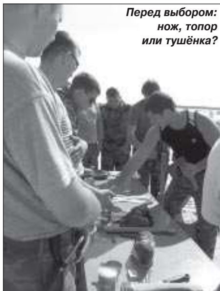
Перед выбором: нож, топор или тушёнка?

Вечером состоялась спортивная эстафета. Победителями первого игрового дня по сумме заработанных за день баллов стали