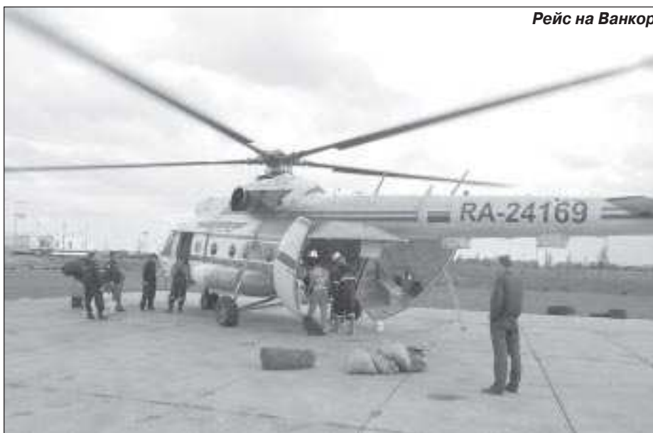
Рейс на Ванкор