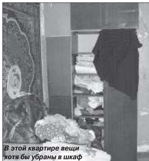
В этой квартире вещи хотя бы убраны в шкаф