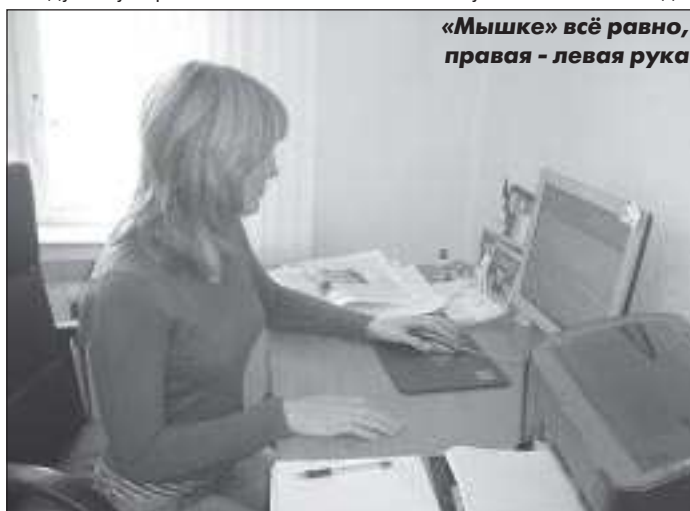
«Мышке» всё равно, правая - левая рука

По материалам сайта Галактик.орг.юа.