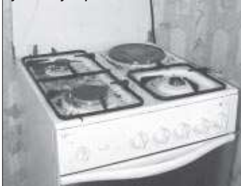
Антисанитария и полное отсутствие кухонной утвари

И, наконец, наиболее сложная категория семей, в которых наблюдается асоциальное поведение