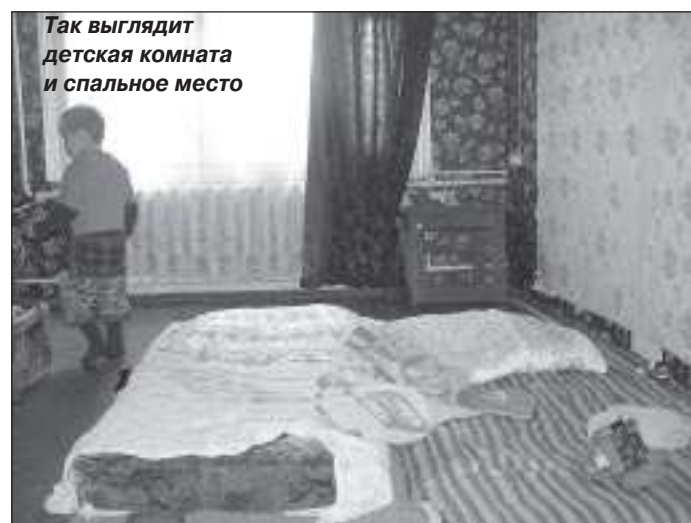
Так выглядит детская комната и спальное место

На сегодняшний день на учёте в отделении профилактики безнадзорности несовершеннолетних Центра состоят 62 тарко-салинские семьи. По степени неблагополучности они поделены на три категории. К первой категории относятся материально неблагополучные семьи. Их проблемы вызваны временными