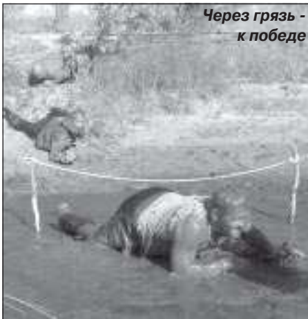
Через грязь - к победе

Во второй день жизни на острове после зарядки и завтрака участников вновь ждали запланированные организаторами конкурсы. Так как команды были предупреждены о гребле на байдарках заранее, от участников требовалось своими руками смастерить по два весла на команду. Не все самодельные вёсла прошли испытание греблей, некоторые хоть и не сломались, но только, напротив, затрудняли греблю. По результатам соревнования приплывшие первыми команды имели преимущество в