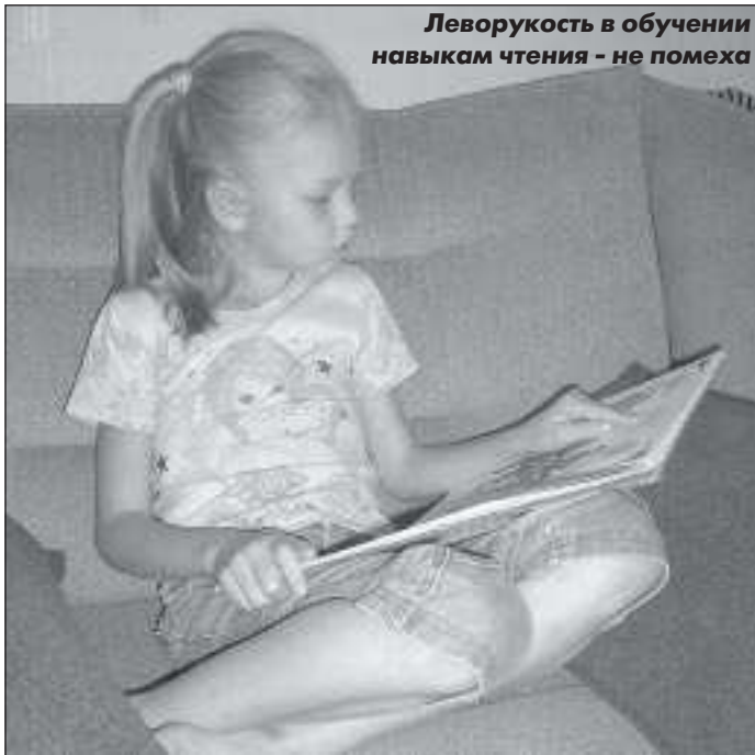
Леворукость в обучении навыкам чтения - не помеха

не берется, но не стоит переживать, если в нормальной праворукой семье рождается левша или даже двое левшей - смотрите генеалогическое древо, а не изучайте соседей.