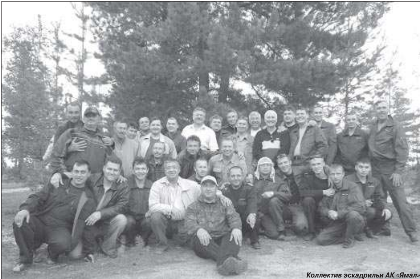
Коллектив эскадрильи АК «Ямал»

В середине 90-х годов из-за экономических потрясений в стра-