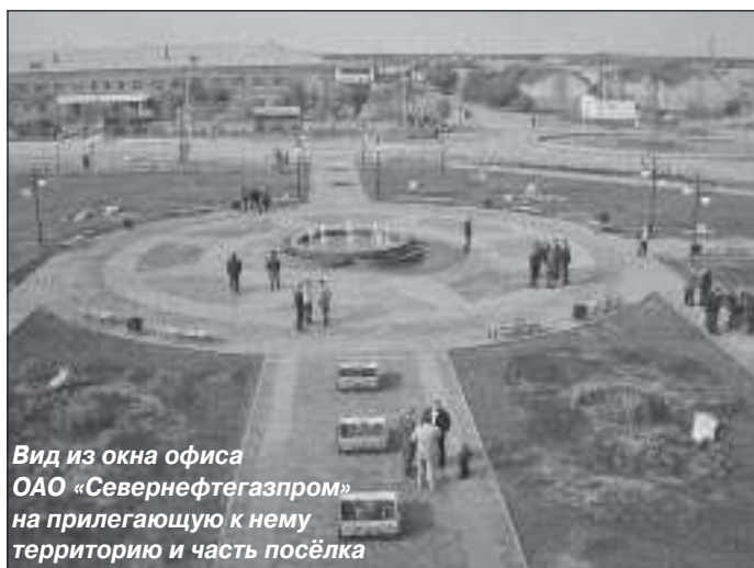
Вид из окна офиса ОАО «Севернефтегазпром» на прилегающую к нему территорию и часть посёлка