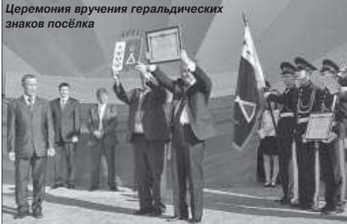
Церемония вручения геральдических знаков посёлка

также затронут вопрос очистки воды, качество которой должно стать намного лучше сегодняшнего. Далее речь зашла о понтонно-мостовой переправе, средства от эксплуатации которой могли бы не уходить на сторону, а работать на посёлок. Не обошли вниманием и имеющийся в Уренгое аэропорт, в этой связи уместно было бы вернуться к организации существовавших в былые времена рейсов, таких как Уренгой-Салехард, Уренгой-Сургут-Тюмень и некоторых других. Один из самых животрепещущих вопросов - состояние жилья, хотя, конечно, это вопрос времени. Было сказано также о состоянии дорог, которое оставляет желать лучшего. Требуются