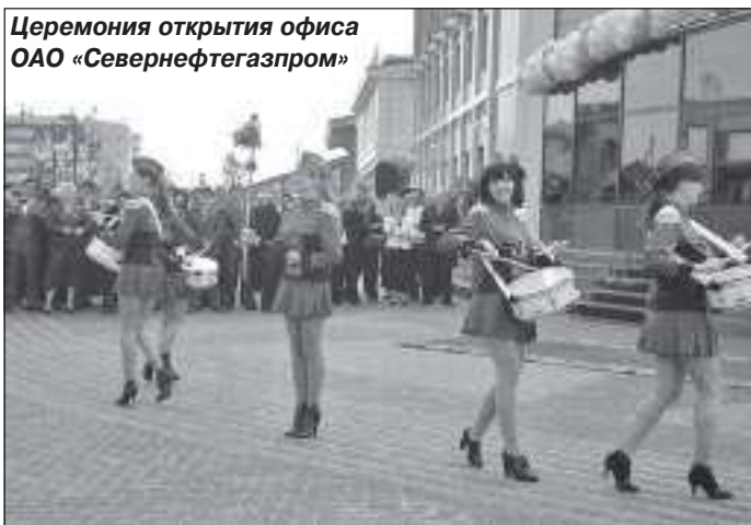
Церемония открытия офиса ОАО «Севернефтегазпром»