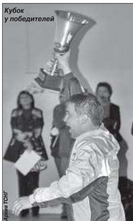
Кубок у победителей

В результате напряженных соревнований I место заняла ко-