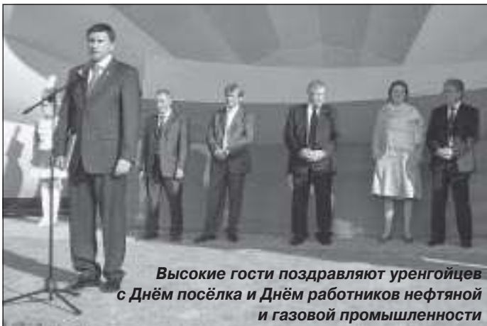
Высокие гости поздравляют уренгойцев с Днём посёлка и Днём работников нефтяной и газовой промышленности

рассказал присутствующим о настоящем времени ОАО УНГГ. Сегодня оно входит в ГК «СибНАЦ», завершая структурный цикл предприятий, занимающихся геологическими изысканиями от научного прогнозирования, сейсморазведки, проектирования до геологоразведочных работ. С помощью группы компаний, несмотря на кризис, предприняты действенные меры по улучшению положения в ОАО УНГГ, которые были направлены на ликвидацию задолженности по кредитам и платежам, обновление технической базы. Председатель ГК «СибНАЦ» поделился планами по предстоящему увеличению объёмов работ и, в связи с этим, по созданию новых бригад и увеличению количества рабочих мест. А за этим встанет