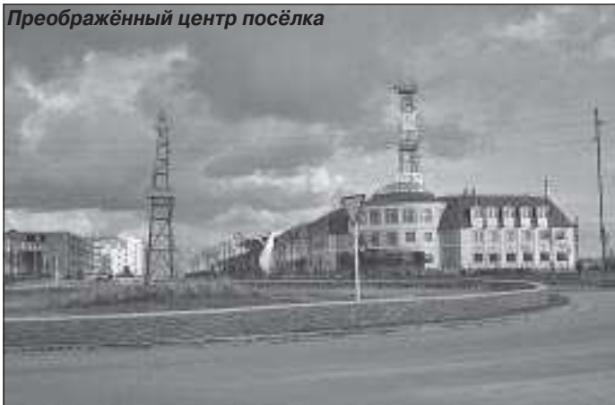
Преображённый центр посёлка

рассказал присутствующим о настоящем времени ОАО УНГГ. Сегодня оно входит в ГК «СибНАЦ», завершая структурный цикл предприятий, занимающихся геологическими изысканиями от научного прогнозирования, сейсморазведки, проектирования до геологоразведочных работ. С помощью группы компаний, несмотря на кризис, предприняты действенные меры по улучшению положения в ОАО УНГГ, которые были направлены на ликвидацию задолженности по кредитам и платежам, обновление технической базы. Председатель ГК «СибНАЦ» поделился планами по предстоящему увеличению объёмов работ и, в связи с этим, по созданию новых бригад и увеличению количества рабочих мест. А за этим встанет