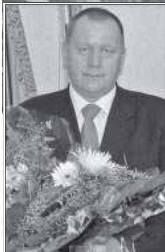
Поселку Пуровску – 30 лет! Возраст для поселка незначительный, а в плане поколений - да, растёт второе поколение родившихся здесь жителей.

Каждый день из прошедших 30 лет был прожит не напрасно: рос, расширился поселок, увеличивалось количество улиц и домов, количество жителей. Хорошел и становился краше наш Пуровск.