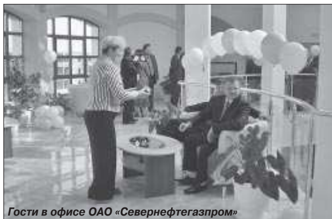
Гости в офисе ОАО «Севернефтегазпром»

Сегодня основной упор предприятие делает на разработку и обу-