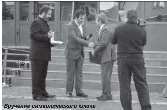
Вручение символического ключа

Трёхэтажное здание офиса рассчитано на 220 рабочих мест, состоит из металлического каркаса, несущих стен из пеноблоков и мягкой кровли. В нём работает лифт. Кроме рабочих кабинетов здесь имеются аппаратная связи, серверная, архив, два конференц-зала, столовая на 24 места. В куполообразной части здания расположен зимний сад. При внутренней отделке помещений использованы современные строительные материалы. Оборудование кабинетов соответствует последнему слову техники.