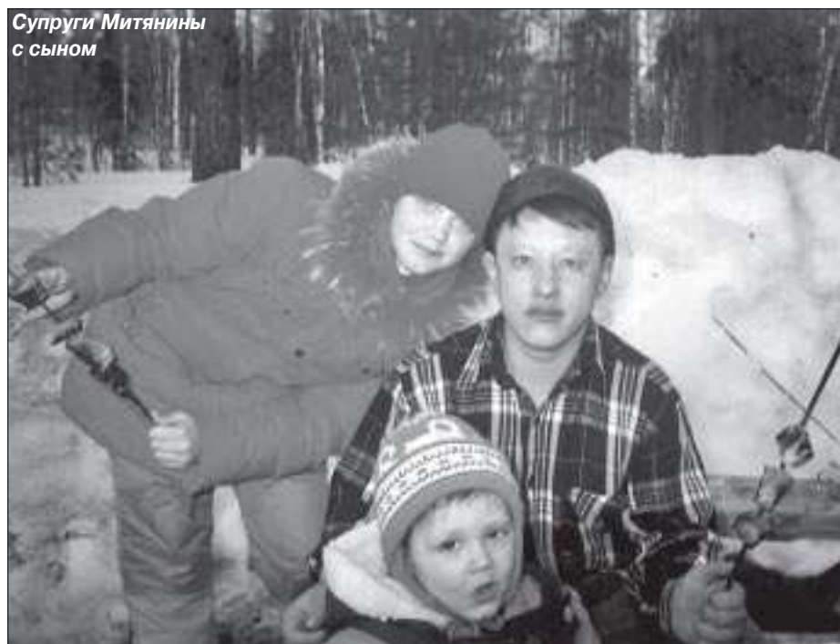
Супруги Митянины с сыном