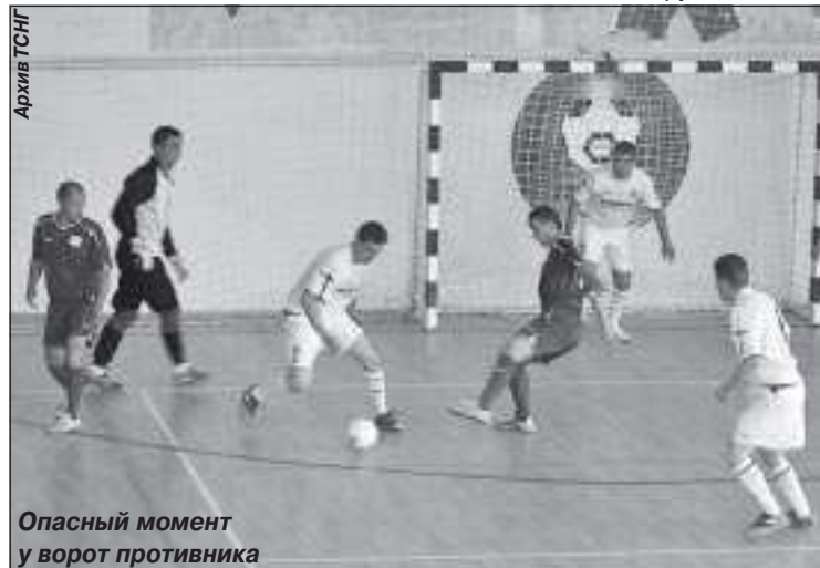
Опасный момент у ворот противника