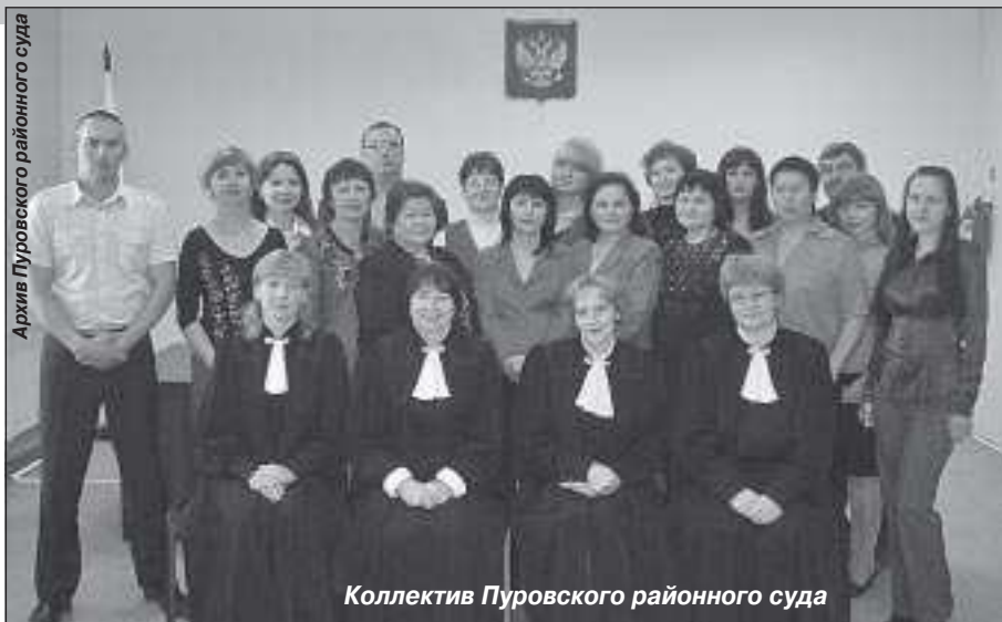
Коллектив Пуровского районного суда

Далее знакомство с судебной властью продолжилось рассказом о Конституционном суде. Интерес вызвала информация о Конституционном (уставном) суде субъекта Российской Федерации, который может быть создан субъектом Российской Федерации. К примеру, Конституционный (Уставный) суд уже действует в Свердловской области. Завершила знакомство с судами информация о Высшем арбитражном суде - высшем судебном органе по разрешению экономических споров.