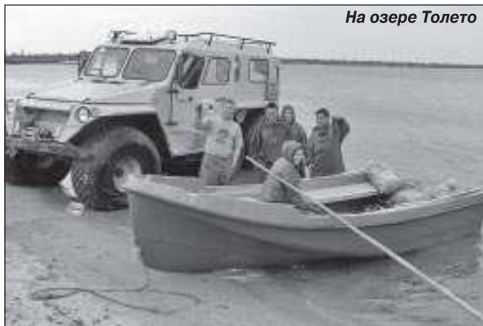
На озере Толето

Вылов рыбы в 220 тонн не предел для Харампуровской общины, наши производственные возможности позволяют вылавливать 260-270 тонн, основания