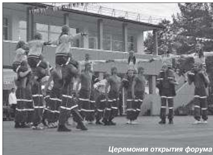
Церемония открытия форума