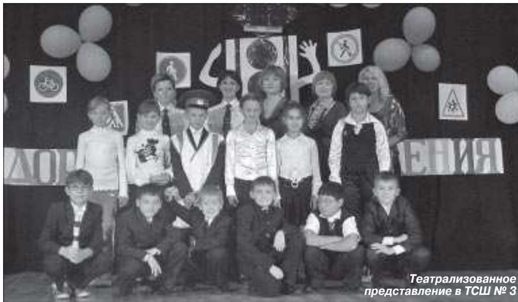
Театрализованное представление в ТСШ № 3

дятся профилактические акции «Внимание – дети!» и «Мы за безопасность». Активно в учебный процесс вовлекаются и родители, в ходе общешкольных и классных родительских собраний проводятся лекции и беседы. Кроме традиционных мероприятий в образовательных учреждениях района проводятся и новые виды активной пропаганды, такие как программа «Я – велосипедист». Следует отметить, что в ходе профилактических мероприятий и акций охват учащихся в школах района был стопроцентным, так во всероссийской профилактической акции «Внимание – дети!» приняли участие 6 897 человек. Но, несмотря на все положительные моменты, за восемь месяцев текущего года на территории района зарегистриро-