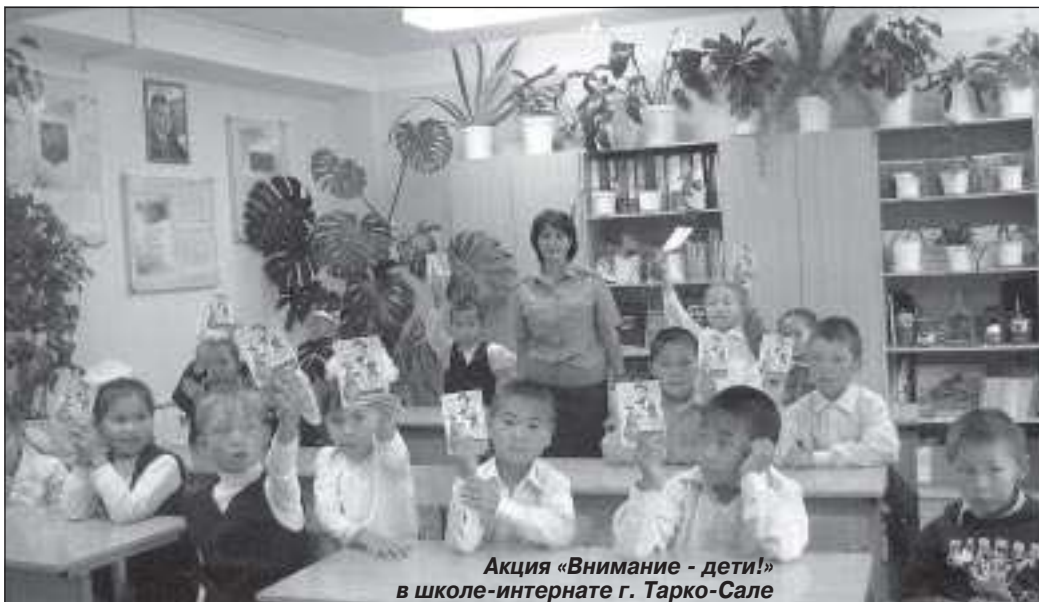
Акция «Внимание - дети!» в школе-интернате г. Тарко-Сале