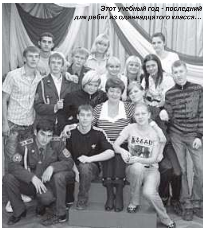
Этот учебный год - последний для ребят из одиннадцатого класса...

- Я думаю, что слово «трудно» здесь не совсем подходит, если любишь детей, болеешь за их будущее, то быть учителем - это гордое призвание. А в наше время - намного интереснее и привлекательнее. Обновление образовательных стандартов даёт возможность раскрыть у детей их способности, сориентироваться в высокотехнологичном конкурентном мире. От педагога всегда требуется, чтобы он был добрым, профессиональным, творческим, культурным человеком, мог понять ученика, вспомнить себя, каким он был в его возрасте. Дружба, взаимопонимание, человечность