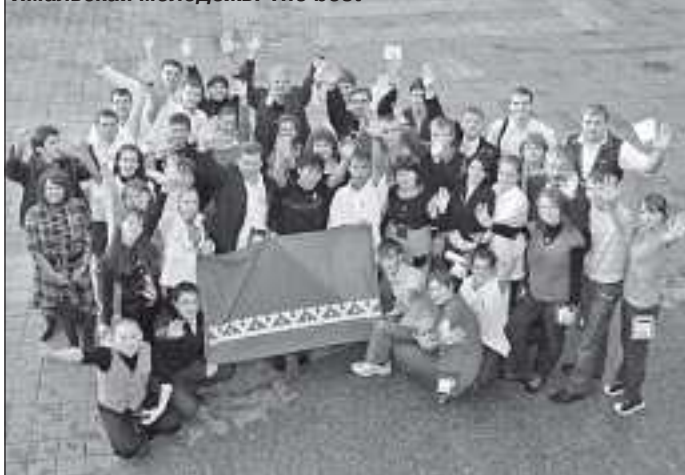
Ямальская молодёжь. The best

Ну и, конечно, нельзя не сказать об активности. Видимо, здесь