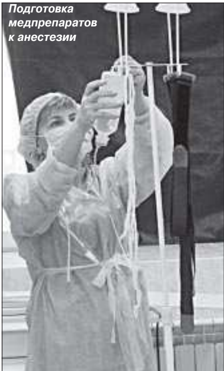
Подготовка медпрепаратов к анестезии

более частый вопрос, который задают: «Проснусь ли я после наркоза и насколько он вреден для здоровья?» Перед операцией рассказываем о том, как будет проходить наркоз и что может чувствовать человек после этой процедуры. За пять лет с момента создания отделения случаев, чтобы пациент не проснулся, не было. Немного сложнее с детьми, точнее, терпения надо больше. Крохе гораздо страшнее, чем взрослому. И, естественно, желательно начинать