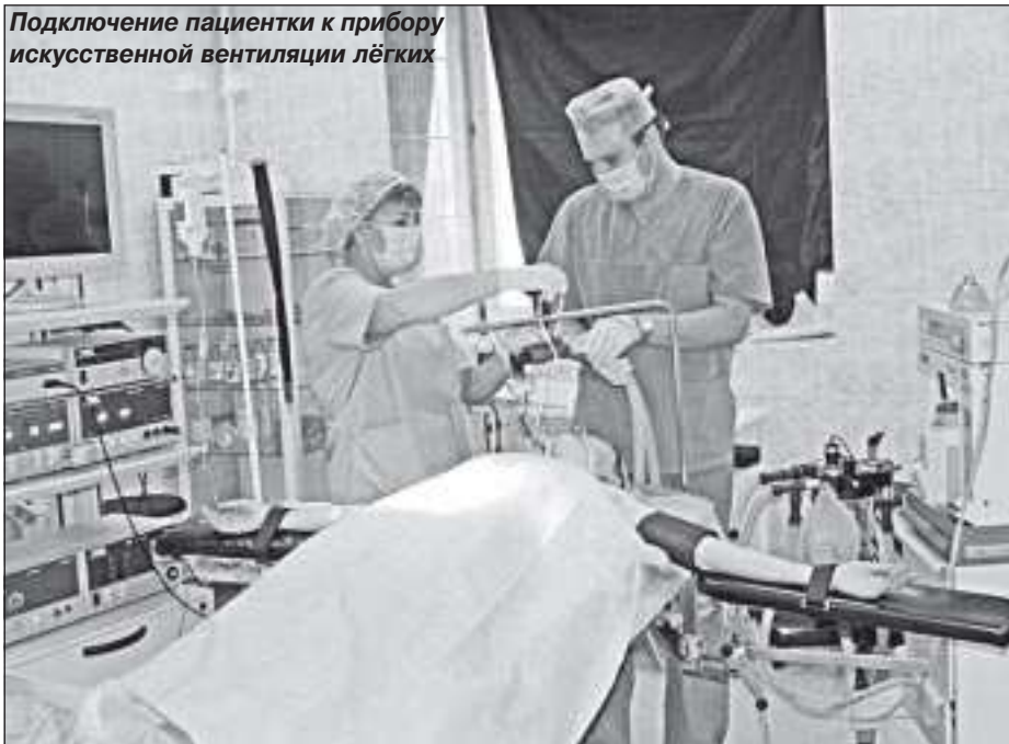
Подключение пациентки к прибору искусственной вентиляции лёгких

держание нормальной температуры тела, понижение ее всего лишь на один градус порождает массу серьезных проблем, связанных с риском для жизни.