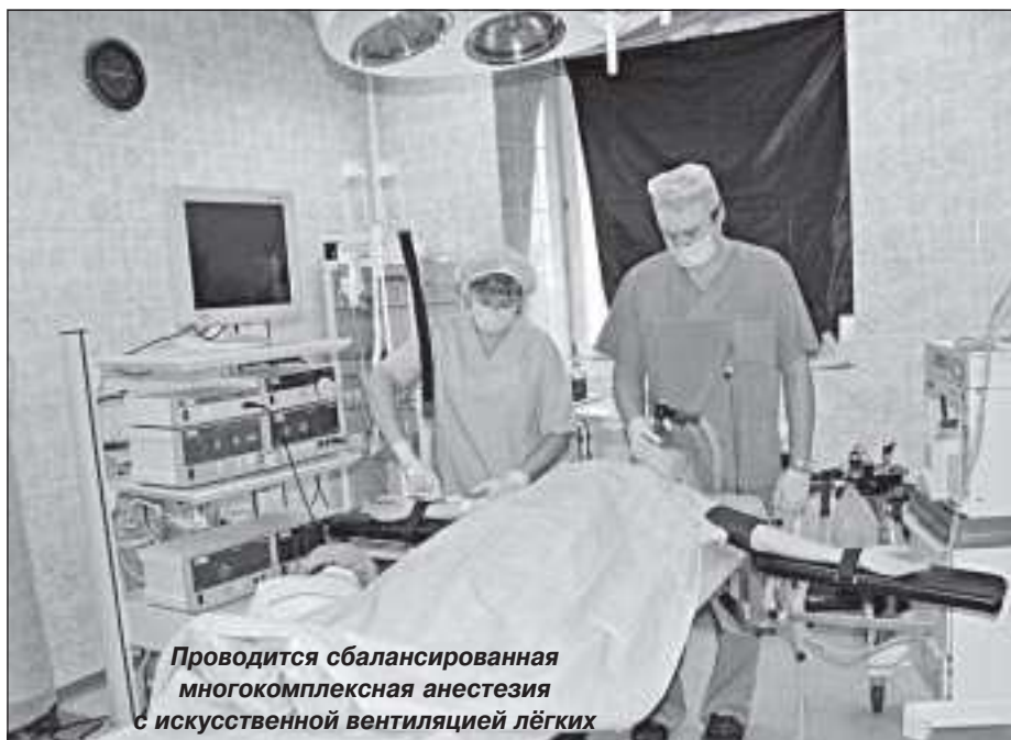
Проводится сбалансированная многокомплексная анестезия с искусственной вентиляцией лёгких

К каждому пациенту мы подходим индивидуально, хотя принципиально проблемы и задачи не отличаются. Но методы и дозировки различны. Особенно это характерно для новорожденных и недоношенных. У детей крайне важным условием является под-