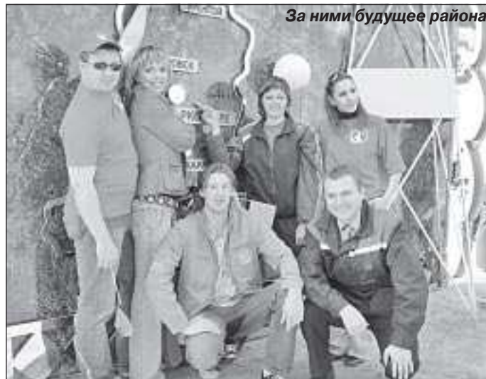
За ними будущее района