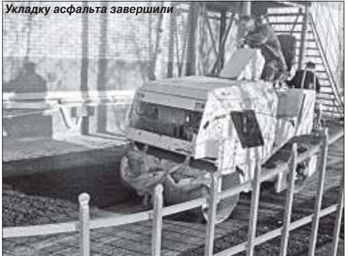
Укладку асфальта завершили