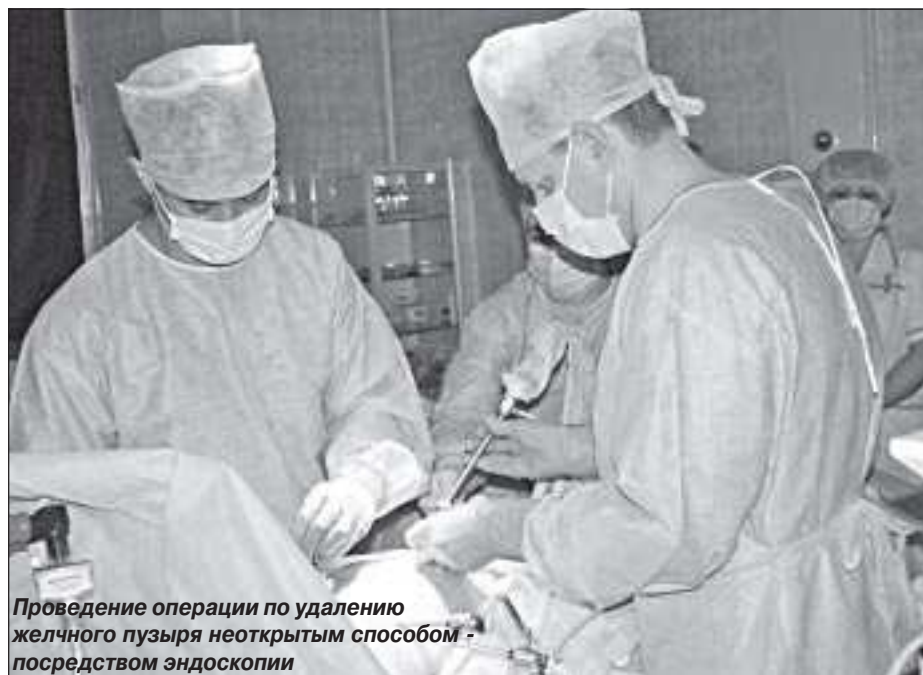
Проведение операции по удалению желчного пузыря неоткрытым способом - посредством эндоскопии

В Центральной районной больнице в 2008 году было проведено 1276 анестезий, хирургических вмешательств - 1937, в реанимации пролечены 884 человека.