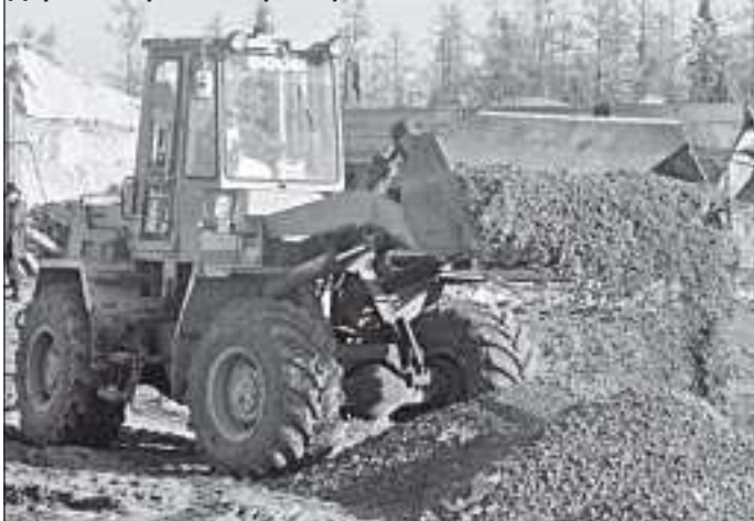
Дорожные работы в разгаре

- В нашем регионе значительно дороже, чем на Большой земле.