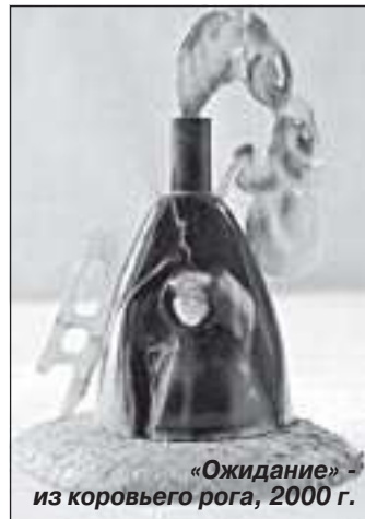
«Ожидание» - из коровьего рога, 2000 г.