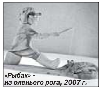
«Рыбак» - из оленьего рога, 2007 г.