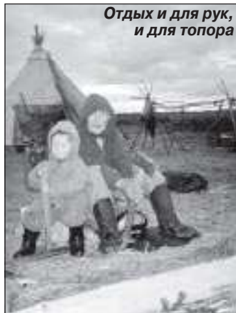
Отдых и для рук, и для топора