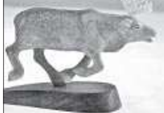
«Минурей» - из лосиного рога, 2009 г.

фессионального инструмента резчика. В последующие каникулы он работал в строительных организациях: участвовал в разборе сносимых зданий, собирал гаражные коробки, засыпал крыши керамзитом, охранял стройплощадку, строительные материалы и технику.