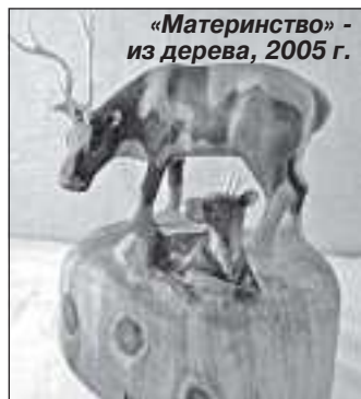
«Материнство» - из дерева, 2005 г.