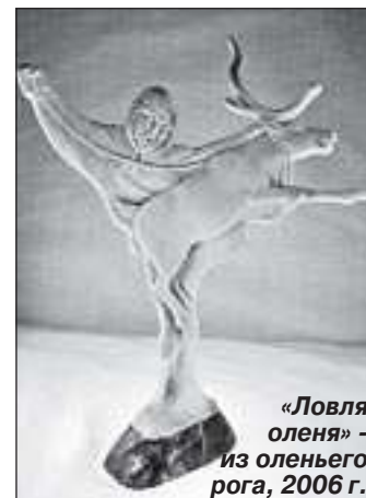
«Ловля оленя» - из оленьего рога, 2006 г.

В 1995 году после возвращения домой Сергей устроился в совхоз поваром зверокухни на ферме, где выращивали песцов. Теперь его режим дня полностью подчинялся режиму питания животных. Ранние подъемы, однообразные монотонные обязанности, отсутствие выходных – это всё, что осталось в памяти о том времени. Спустя год он уволился. Планировал поступить на художественное отделение. Но из-за несвоевременной