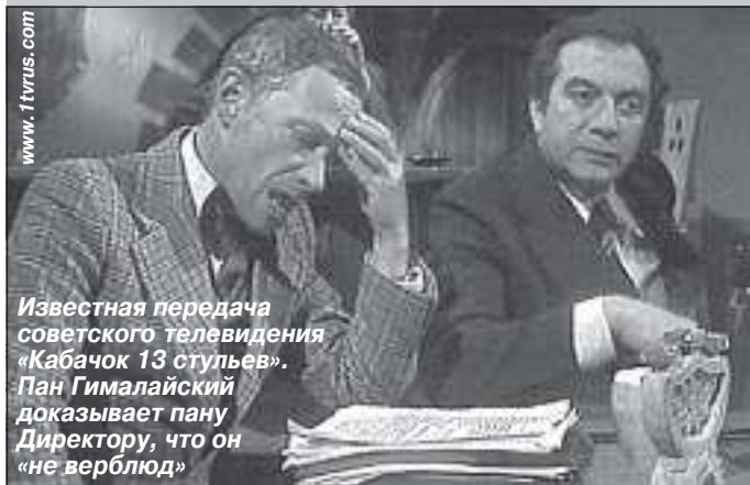
Известная передача советского телевидения «Кабачок 13 стульев». Пан Гималайский доказывает пану Директору, что он «не верблюд»

Один мой знакомый как-то сказал: «Алина, у тебя есть поразительная способность вляпываться в такие ситуации, что хоть стой, хоть падай. Об этом можно книгу писать!» Ну, книгу - не книгу, а вот одну историю рассказать могу о том, как в нашем государстве приходится доказывать, что ты не верблюд.