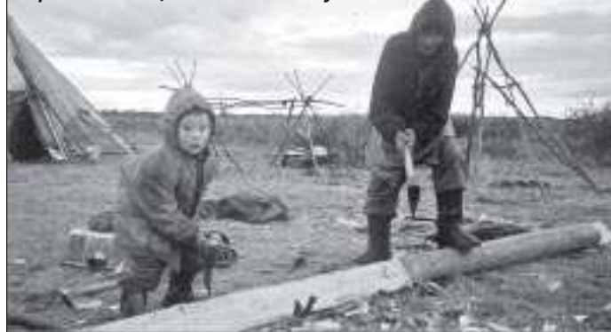
Топор в умелых руках - первый помощник по хозяйству

ярэ терсавэй тыси манрида хая. Ендад понд сэя. Хокосям нгарка и ханада.