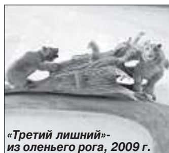
«Третий лишний» - из оленьего рога, 2009 г.

Денег на дорогу до Салехарда было в обрез, о билете на са-