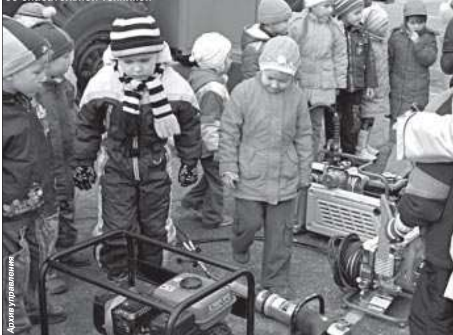
Знакомство юных пуровчан со спасательной техникой

- Всего за пожароопасный период 2009 года на территории Пуровского района было зафиксировано 128 лесных и тундровых пожаров. Основной причиной их возникновения стали сухие грозы. По количеству пожаров лето выдалось достаточно спокойным. Осложнила ситуацию экономия на авиатрулировании. Вместо этого проводился так называемый