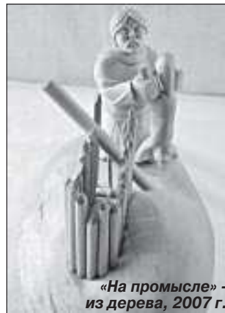
«На промысле» - из дерева, 2007 г.