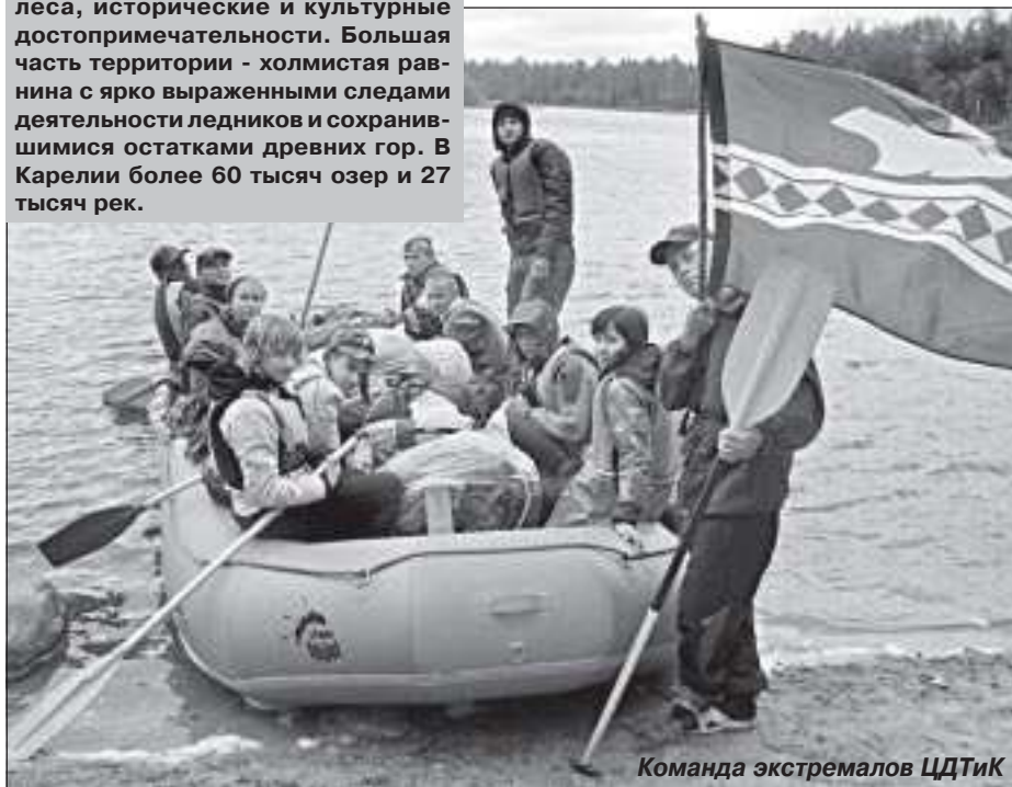
Команда экстремалов ЦДТиК

Карельская земля хранит множество тайн - от природных до рукотворных - наскальные рисунки, удивительные храмы, бурные реки для экстремалов. Воспитанники нашего районного Центра детского туризма и краеведения минувшим летом побывали в живописных труднодоступных местах Карельского края. Мы выбрали реку Чирко-Кемь, которая протекает в северо-восточной части Карелии (90 км от границы с Финляндией) и впадает в Белое море. Берега преимущественно скалистые, местами высота скалистых гряд достигает 100 метров. Маршрут наш начался с местечка Андронова гора. Получили инструктаж по технике безопасности, собрали и подготовили суда к сплаву, продукты уложили в гермоупаковки, распределились по экипажам, экипировались по всем правилам туристско-водников. Предстояло пройти участок маршрута в 111 км. Перепад воды составлял 44 метра, 25 порогов от 2 до 5 категории сложности.