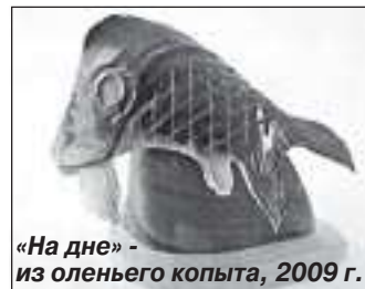
«На дне» - из оленьего копыта, 2009 г.