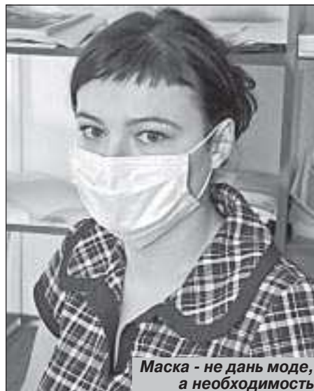
Маска - не дань моде, а необходимость

- Действительно, их не хватает, в настоящий момент их просто нет. Неделию назад