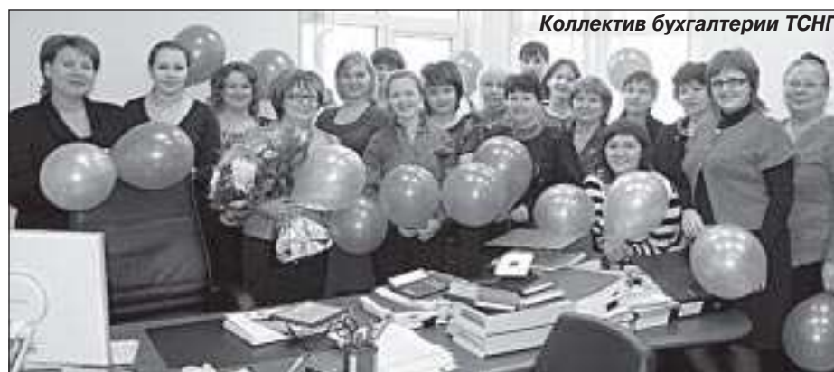
Коллектив бухгалтерии ТСНГ

- Без сомнений. Умение работать в коллективе - это требования, которые я предъявляю к себе и своим сотрудникам. Этот принцип у меня сложился после института, когда проходила практику, а потом работала в планово-экономическом отделе Таркосалинской нефтеразведочной экспедиции. Это незаменимый опыт, как с профессиональной точки зрения, так и неформального общения. В коллективе никто не разговаривал на повышенных тонах, рабочие вопросы обсуждали совместно. Еще тогда мне объяснили: если есть проблема или непонимание в работе, нельзя держать их в себе или от-