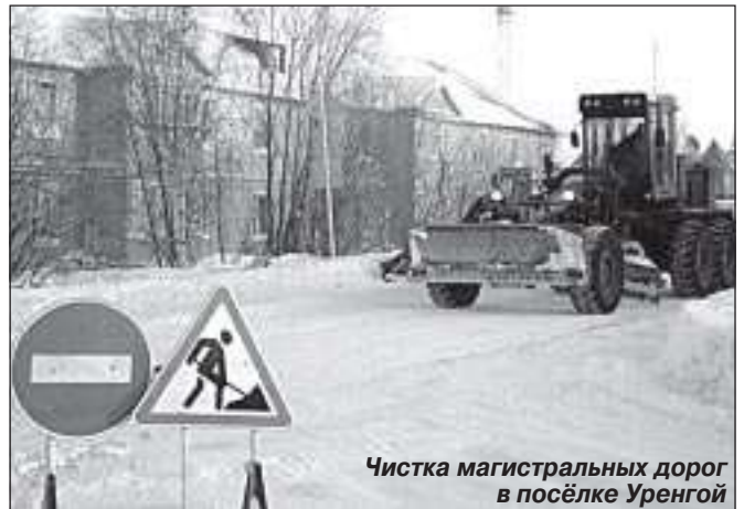
Чистка магистральных дорог в посёлке Уренгой

Если не считать некоторого напряжения, вызванного повышенным чувством ответственности во время морозов, персонал трудился в обычном режиме посменной работы. Всё это относится и к работе других участков МУП ПКС - водоотведения и водоснабжения. В сетях, находящихся на обслуживании предприятия, сбоев в период низких температур не было. И хотя зима ещё не закончилась, а для нашего предприятия она будет продолжаться до конца отопительного сезона, до 14 июня, проверка морозами показала, что подготовка к зиме 2009-2010 была проведена на должном уровне.