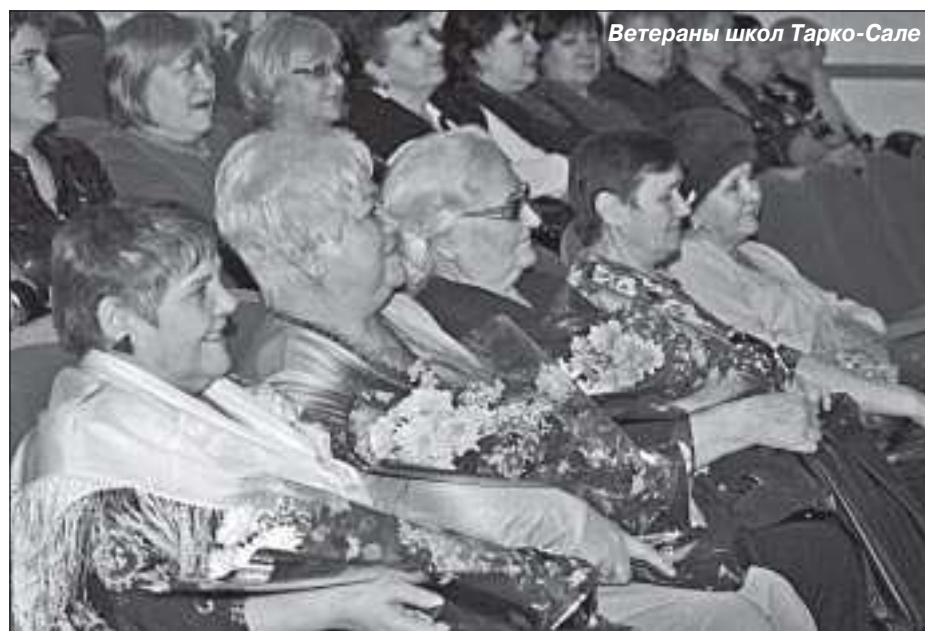
Ветераны школ Тарко-Сале

школ, ветеранов и молодых учителей, рассказывавших о прошлом и настоящем педагогической деятельности. И все это было настолько трогательно, настолько четко передавало ощущения тревоги, заботы и участия в сегодняшней жизни школы, которые испытывают педагоги, что на маленькие заминки никто не обращал внимания. Все было похоже на что-то между педсоветом, где жестко и четко «прошлись» и по достижениям, и по недостаткам современного образования, и одним школьным днем, где каждый урок – выступление отдельного учреждения образования, а перемена – творческие номера учащихся.