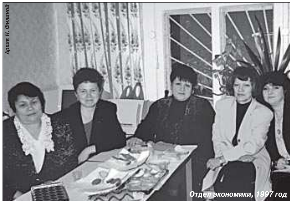
Отдел экономики, 1997 год

В настоящее время в функции отдела входит разработка прогноза социально-экономического развития Пуровского района, формирование основных показателей для разработки доходной части бюджета района. Отдел осуществляет подготовку методических документов для разработки и выполнения районных целевых программ. Если в 90-е годы на территории района работала одна комплексная программа, то на сегодняшний день - 21. В 2008 году Указом Президента РФ были утверждены показатели, оценивающие деятельность органов местного самоуправления. Теперь в полномочия отдела вошел обширный блок работы над сводным формированием данных показателей и работа над докладом главы Пуровского района о достигнутых значениях показателей для оценки эффективности деятельности местного самоуправления. Ну и, конечно, специфику работы отдела не обошел мировой экономический кризис, в настоящее время осуществляется выполнение многочисленных мониторингов по влиянию кризиса на экономику района, в которых отслеживается просроченная задолженность по выплате заработной платы, необос-