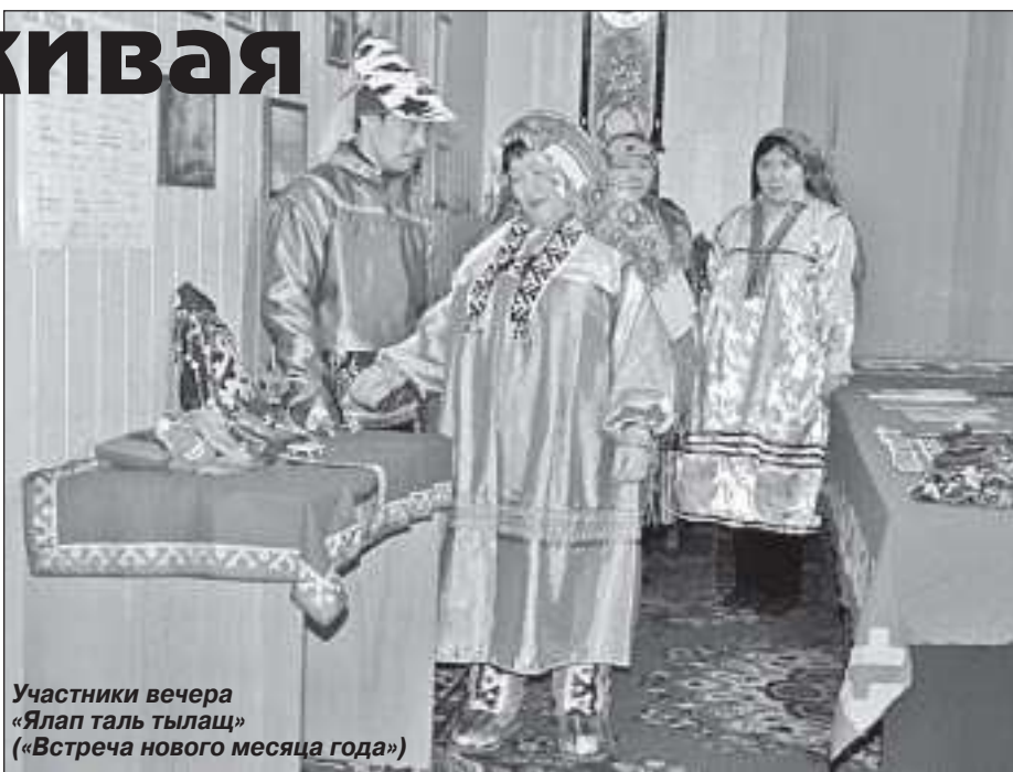
Участники вечера «Ялап таль тылащ» («Встреча нового месяца года»)