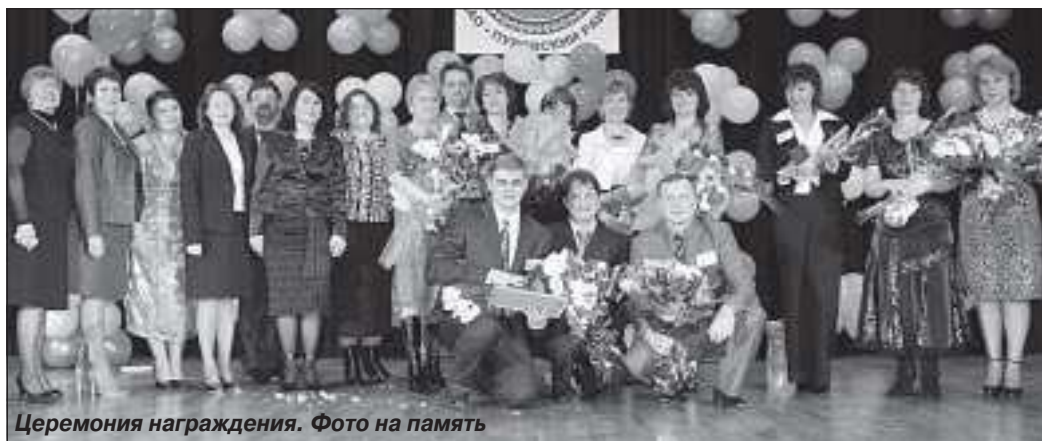
Церемония награждения. Фото на память

И хотя, по нашему глубокому убеждению, конкурс - это не шоу, все же это не значит, что он совсем лишен яркости и привлекательности. В то же время конкурс - это учеба, смотр педагогических сил, пополнение опыта, расширение рамок профессионального общения. В этом году он проходил по иной модели - в два тура, то есть организаторы старались максимально приблизить его условия к условиям окружного, изменив и содержание конкурсных заданий, и их количество.