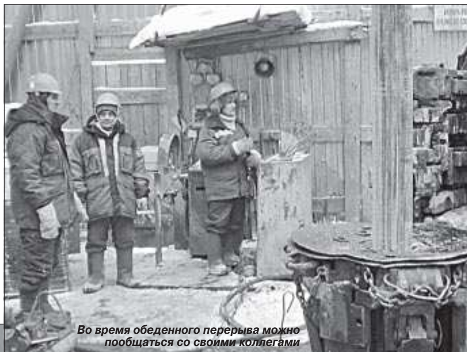
Во время обеденного перерыва можно пообщаться со своими коллегами

быть необходимый материал для отправки на исследование. Изучение материала осуществляется в ГК «СибНАЦ», которые объединяют разнопрофильные предприятия, работающие на конечный результат получения