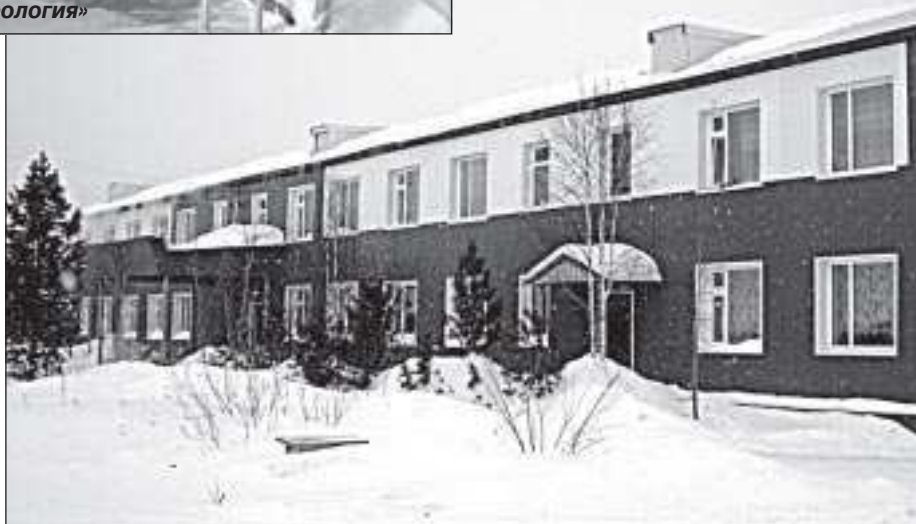
Недавно построенное общежитие для геологоразведчиков

Техническое обеспечение предприятия, улучшение условий труда и быта работников предприятия - залог более успешной производственной деятельности, удовлетворяющей запросы заказчика, что, в свою очередь, ведёт к увеличению объёмов работы и дальнейшему расширению производства.