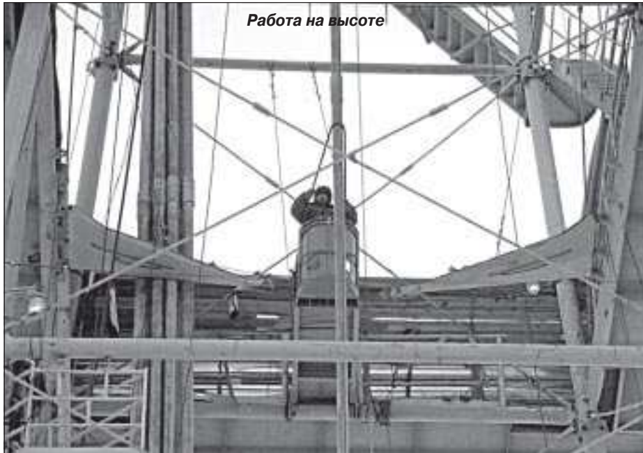
Работа на высоте

Несмотря на обеденное время, на буровой установке не прекращалась работа. Задрав голову, можно было понаблюдать за действиями людей, кажущихся снизу совсем маленькими. Поднявшись на палубу (огороженную площадку), я также увидела там работающих людей, они занимались спуском инструмента в скважину, то есть подготовкой к бурению. В царстве металла рабочие чувствовали себя весьма уверенно и неспешно производили понятные и привычные для них действия, не слишком обращая внимание на внезапно возникшего рядом человека с фотоаппаратом.