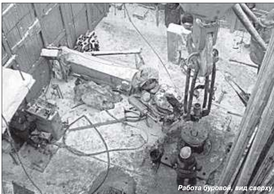
Работа буровой, вид сверху