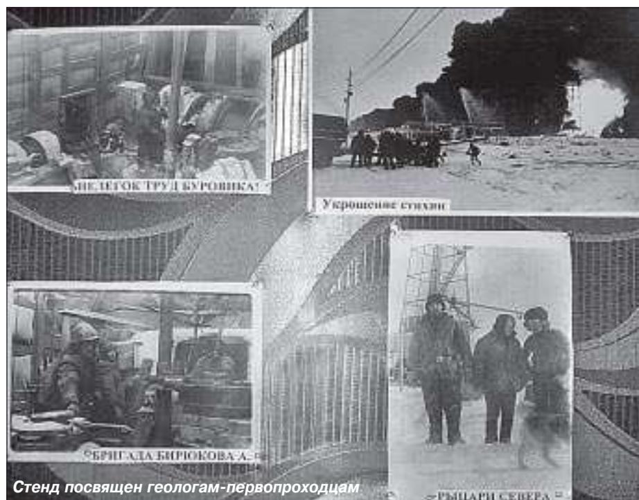
МЕСТО РАБОТЫ В ПОСЁЛКЕ

ности приёма на работу людей из других регионов. Это объясняется тем, что постоянно проживающий в посёлке человек более выгоден как работник, так как он ответственнее подходит к работе, его всегда можно разыскать в случае производственной необходимости. Поэтому больше поло-