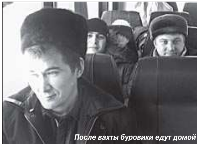
После вахты буровики едут домой

Вот и всё, что вкратце успел рассказать буровой мастер, пообещав, что в следующую вахту мы обязательно встретимся и поговорим более подробно о работе. Но и из этой, казалось бы, достаточно сухой констатации фактов, видно, что настрой у бригады положительный, люди ориентированы на работу, на перспективу. На то, что геология возрождается и их труд будет востребован.