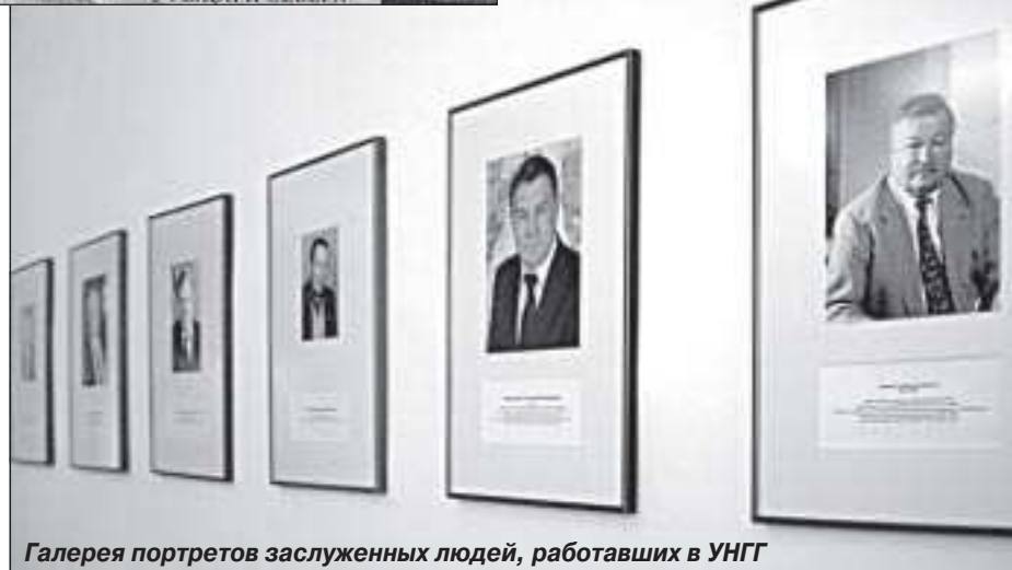
Галерея портретов заслуженных людей, работавших в УНГГ

Другое направление кадровой политики ОАО УНГГ - постепенное омоложение коллектива. Так, если в 2008 году на предприятии работало 110 представителей молодёжи в возрасте до 30 лет, то в 2010 эта цифра возросла до 182 человек. Безусловно, специалисты в возрасте обладают боль-