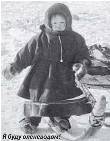
Я буду оленеводом!

вать. Потом все помыть, убрать на место, новую еду на другой раз готовить. А дети говорят, что в интернате ничего делать самим не надо, что они отвыкли.