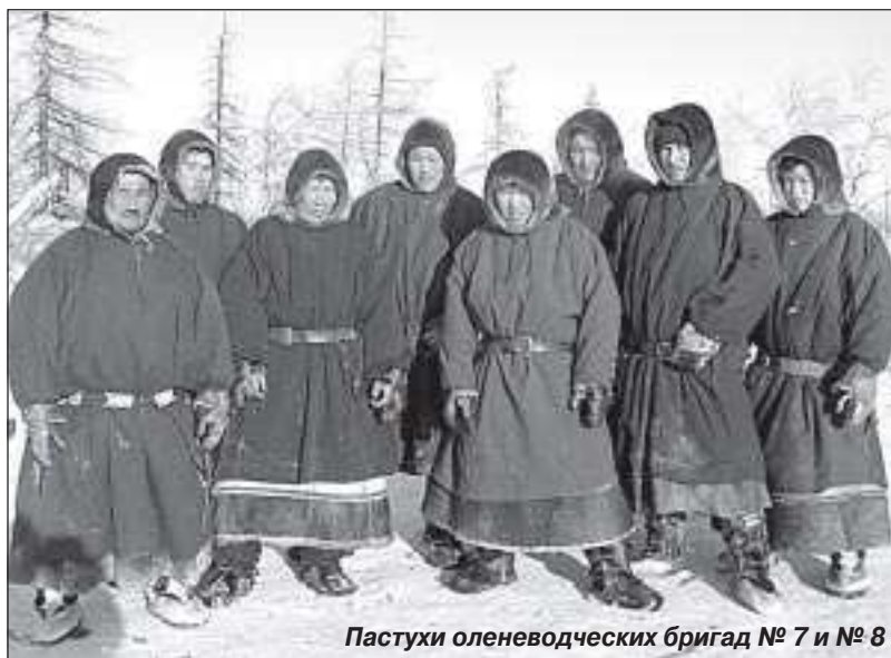
Пастухи оленеводческих бригад № 7 и № 8

- Я уже старая стала. У меня дети большие выросли. Они в школе в старших классах учатся. Хочу сказать слово директору, учителям и воспитателям школы-интерната. Вы не балуйте наших детей. Пусть они после уроков помогают поварам, посудницам, уборщицам. Учатся сами за собой убирать. А то приезжают в чум, попьют-поедят и встают из-за стола. Уходят, даже «спасибо» забывают сказать. Я их ругаю, что так нельзя. Надо самому уметь и приготовить, и стол накрыть, за старшими и младшими ухаживать.