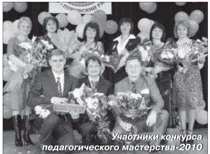
Участники конкурса педагогического мастерства-2010