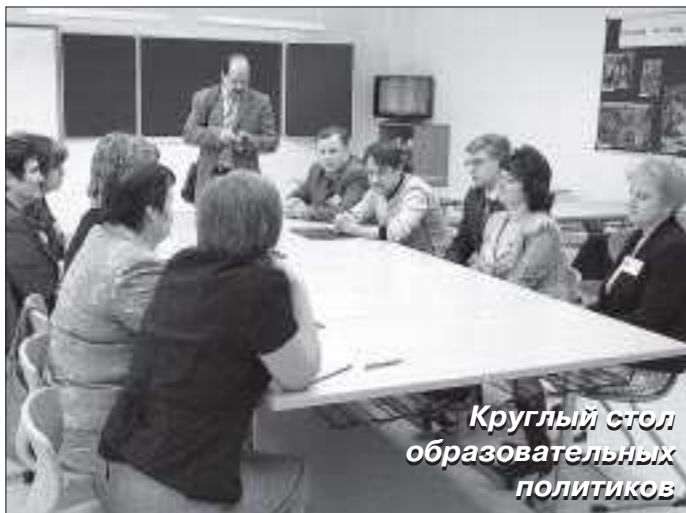
Круглый стол образовательных политиков