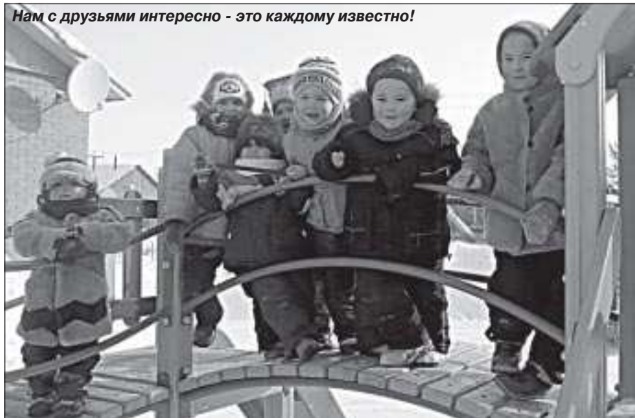
Нам с друзьями интересно - это каждому известно!

На будущий учебный год уже составлены списки первоклассников. При формировании списка выяснилось, что количество детей подходящего возраста превосходит данные по нескольким предыдущим десятилетиям. Впервые в Халясавэе на празднике