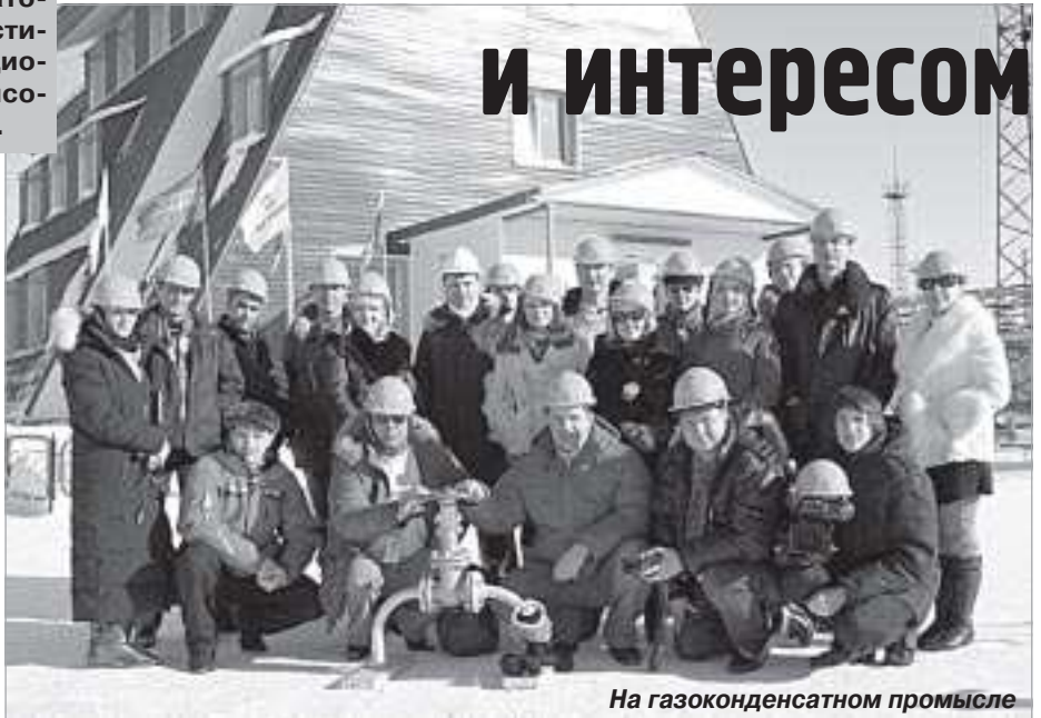
На газоконденсатном промысле

и учились, как надо работать. Поработав в нашей сфере пять-десять лет, уже забываешь, для чего ты, собственно, работаешь на телевидении. Надо время от времени, образно выражаясь, мордой по батарее поводить журналиста (и я не исключение), для того, чтобы он это вспомнил. Посмотрев сюжеты, я по-хорошему обиделся (на себя, естественно), потому что мне, человеку, всю сознательную жизнь посвятившему телевидению, показали, как надо работать».