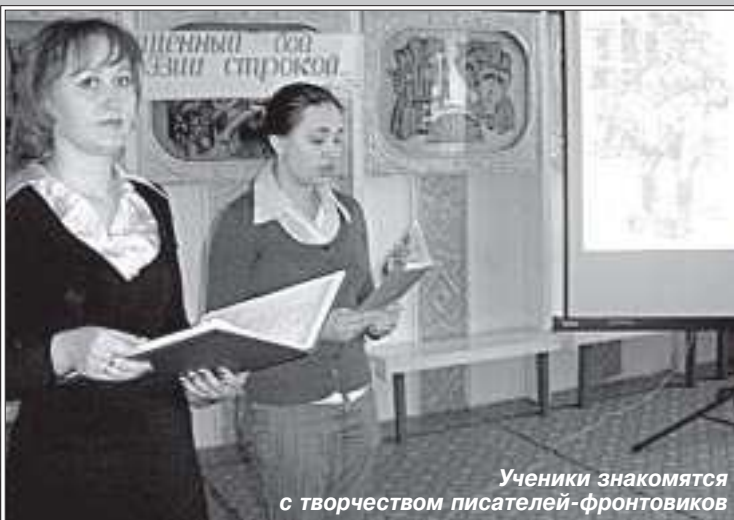
Ученики знакомятся с творчеством писателей-фронтовиков