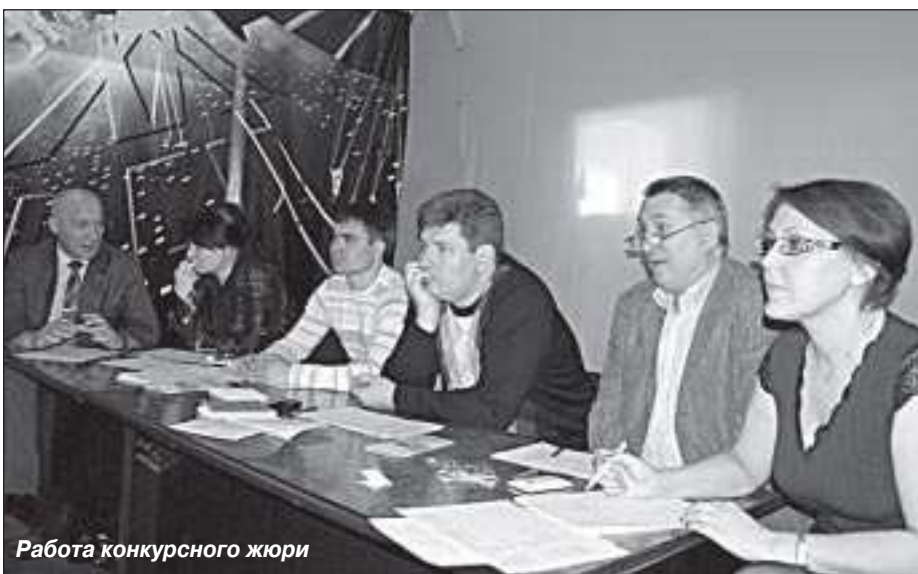
Работа конкурсного жюри

И вот настал самый волнительный момент – награждение победителей по номинациям. В номинации «Покорители Севера» победил коллектив ТРК «Луч» с постоянной