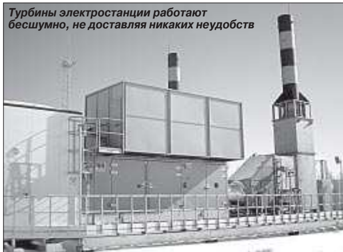
Турбины электростанции работают бесшумно, не доставляя никаких неудобств

на будущую эксплуатацию нижележащих пластов с более высоким содержанием конденсата.