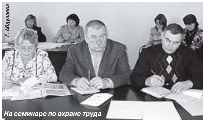
На семинаре по охране труда

Профсоюзы большое внимание уделяют вопросам охраны труда на предприятиях и в организациях. В марте в Тарко-Сале прошел семинар по обучению уполномоченных лиц профкомов, в котором приняло участие более 80 человек. Были рассмотрены актуальные вопросы, касающиеся сферы охраны труда, проведены тренинги. По окончании семинара слушателям были вручены удостоверения.