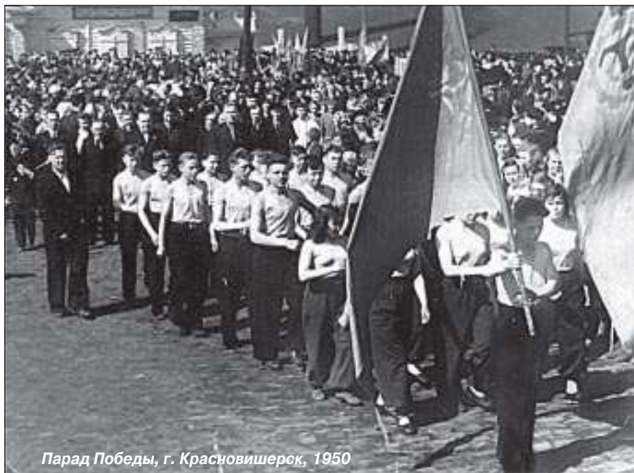
Парад Победы, г. Красновишерск, 1950