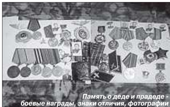
Память о деде и прадеде - боевые награды, знаки отличия, фотографии