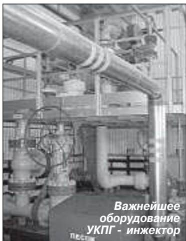
Важнейшее оборудование УКПГ - инжектор

ход газа - передаются именно сюда, и отсюда дистанционно ведется управление.