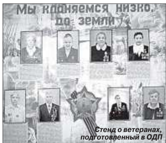
Стенд о ветеранах, подготовленный в ОДП

В администрации посёлка еженедельно проводятся совещания по подготовке к празднованию с представителями служб, предприятий и учреждений, которые информируют о подготовке к празднику. Администрация координирует работу всех организаций по подготовке к 9 Мая. Отдел благоустройства администрации посёлка обеспечит праздничное убранство улиц к 9 Мая. Особое внимание уделяется улице Геологов, по которой в День Победы пройдут праздничные колонны и где у памятной стелы состоится митинг.