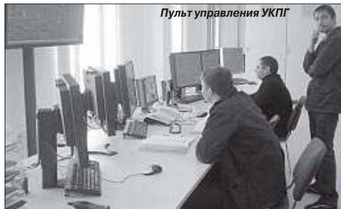
Пульт управления УКПГ

Началось знакомство с «сердцем» УКПГ - операторной. Здесь, в служебно-эксплуатационном блоке, установлен пульт управления. С каждого газового куста данные - температура, давление и рас-