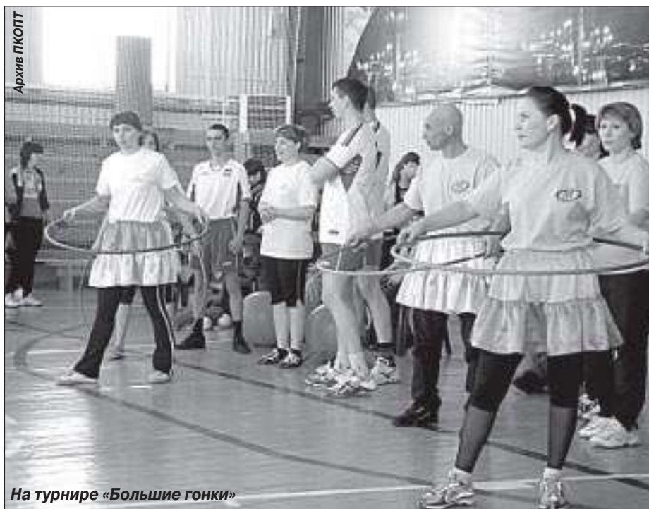
На турнире «Большие гонки»