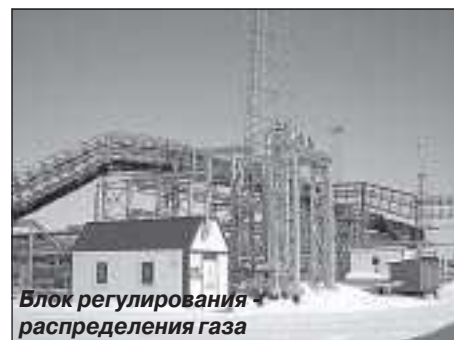
Блок регулирования распределения газа