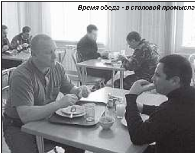
Время обеда - в столовой промысла

четверых, в который входили, как полагается, первое, второе и третье блюда, составила около 230 рублей. Насколько при этом питание дотировано предприятием, остаётся только догадываться.