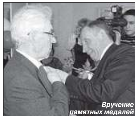
Вручение памятных медалей