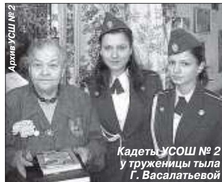
Архив УСОШ № 2

В творческих объединениях подростково-молодёжного клуба «Ровесник» проходят тематические часы «Нам завещаны память и слава». Здесь оформлен выставочный стенд поделок «Детский взгляд на войну». 7 мая состоится конкурс патриотической песни «Это – радость со слезами на глазах».