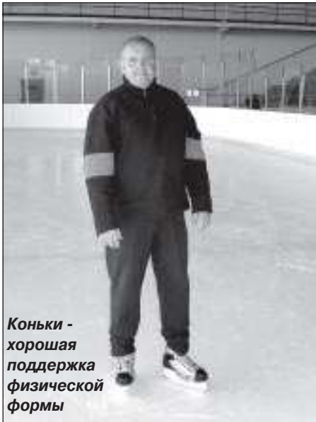
Коньки - хорошая поддержка физической формы