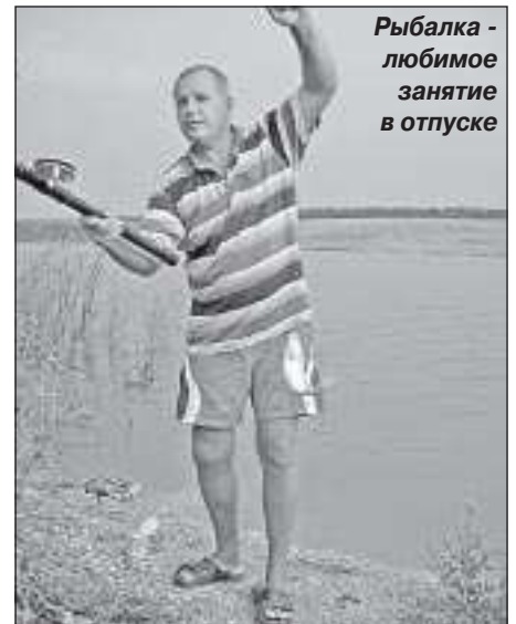
Рыбалка - любимое занятие в отпуске

Е. ЛОБОДОВСКАЯ