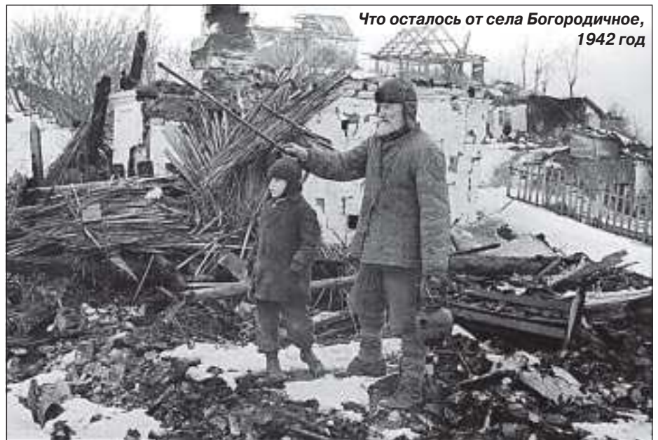
Что осталось от села Богородичное, 1942 год

«Волею случая в руках моего учителя оказалась папка с архивными материалами семьи Владислава Ганшкевича: семь фотографий, шесть писем, извещение, справка, письмо из военкомата, фронтовая листовка, две газеты от 9 и 10 мая 1945 года. Это всё, что осталось в семейном архиве о девятнадцатилетнем солдате, павшем в бою «За социалистическую Родину» южнее села Богородичи в Украине 16 августа 1943 года. Но