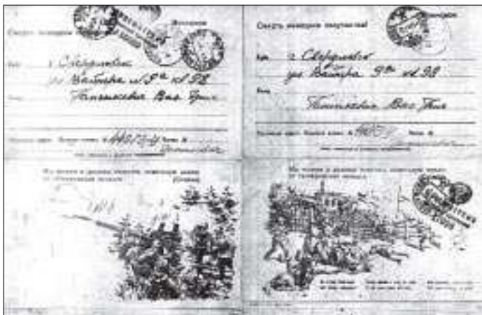
Копии документов из архива семьи Ганшкевич (фронтовая корреспонденция)

до 5 часов утра. Жаль, что Вусик не знал об этом. Он бы пришел ко мне. Цены на продукты здесь гораздо дешевле. Мед дешевле в пять раз. Вино тоже дешевое. Места становятся скучные - степь. Очень красивые были за Красноуфимском, проехали большие тоннели. Скоро поедем на юг, в направлении Сталинграда».