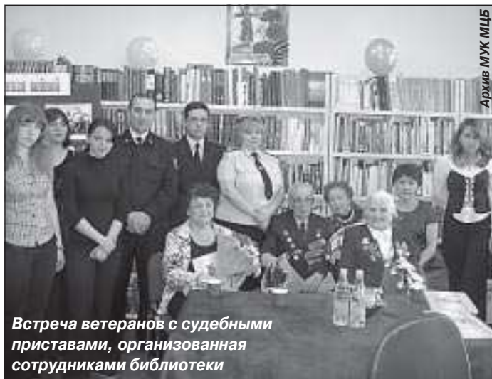
Встреча ветеранов с судебными приставами, организованная сотрудниками библиотеки

Так назывался литературно-поэтический вечер-воспоминание, посвященный 65-летию Победы в Великой Отечественной войне, организованный сотрудниками Межпоселенческой центральной библиотеки. В мероприятии, куда были приглашены ветераны ВОВ и труженики тыла, приняли участие учащиеся 10 «Г» класса Тарко-Салинской школы № 2, учащиеся Тарко-Салинского профессионального училища и представители службы судебных приставов.