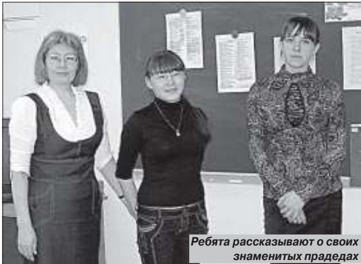
Ребята рассказывают о своих знаменитых прадедах

Е. ГУСМАНОВА, заведующая сектором краеведения МУК «Межпоселенческая центральная библиотека»