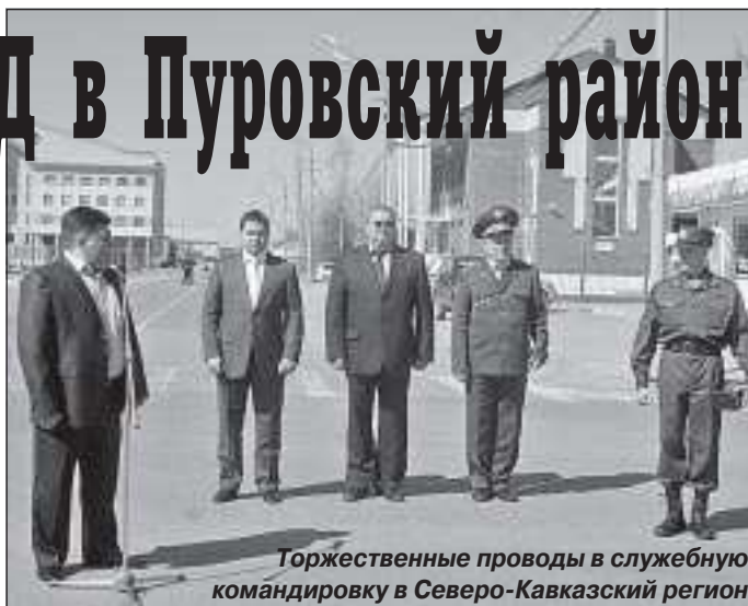
Торжественные проводы в служебную командировку в Северо-Кавказский регион

которой обсуждались вопросы строительства нового административного здания для поселковой милиции.