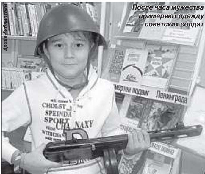
После часа мужества примеряют одежду советских солдат

Ради будущего надо помнить и понимать прошлое. Ведь отрыв от родной истории смертельно опасен, особенно для подрастающего поколения. Много людей по крупицам собирает память о войне. Такие люди есть и в нашем посёлке Ханымее. В год 65-летия Победы они охотно рассказывают о проведённой ими работе по восстановлению исторической правды о той, теперь уже далекой войне. Мы, работники библиотеки, в свою очередь, хотим, чтобы ребятам на пользу пошли знания о том, что за себя, своё будущее надо уметь постоять, порой ценой собственной жизни, как это сделали их предки.