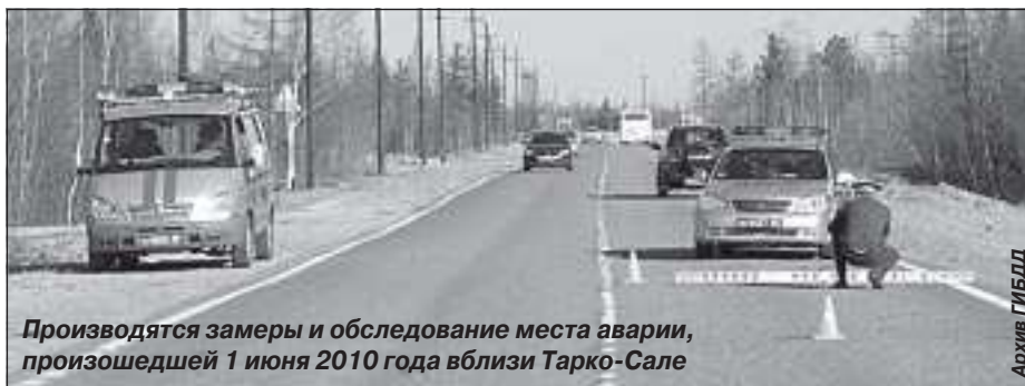
Производятся замеры и обследование места аварии, произошедшей 1 июня 2010 года вблизи Тарко-Сале

За 5 месяцев с участием пешеходов произошло 7 ДТП (АППГ – 5), в результате которых 1 человек погиб и 7 получили телесные повреждения. На 50 % увеличилось число ДТП по вине самих пешеходов. Так, за пять месяцев зарегистрировано 3 дорожно-транспортных происшествия, в которых 4 человека получили телесные повреждения.