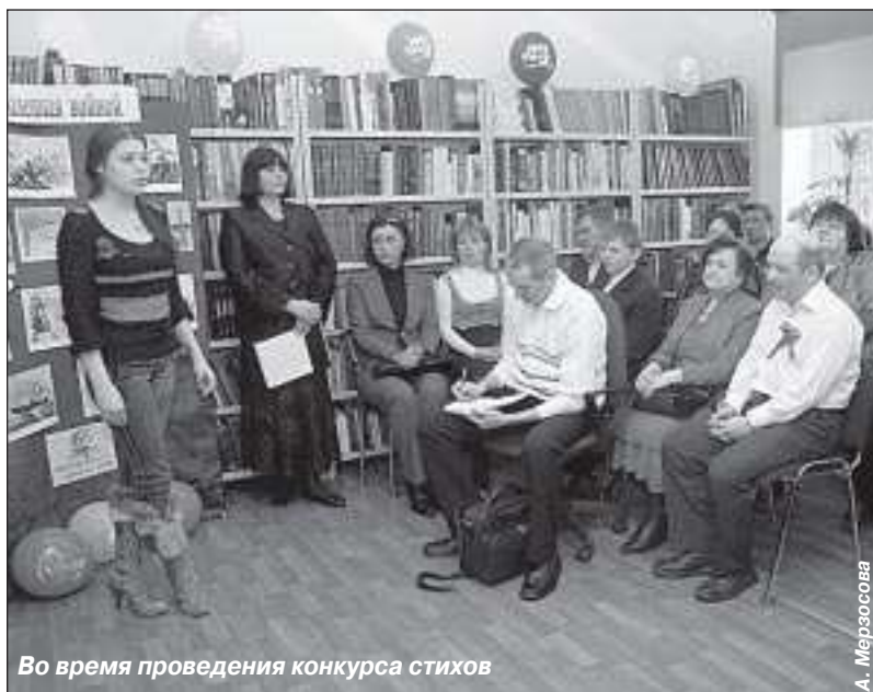
Во время проведения конкурса стихов

По итогам конкурса всем участникам были вручены призы, приобрести которые помогли