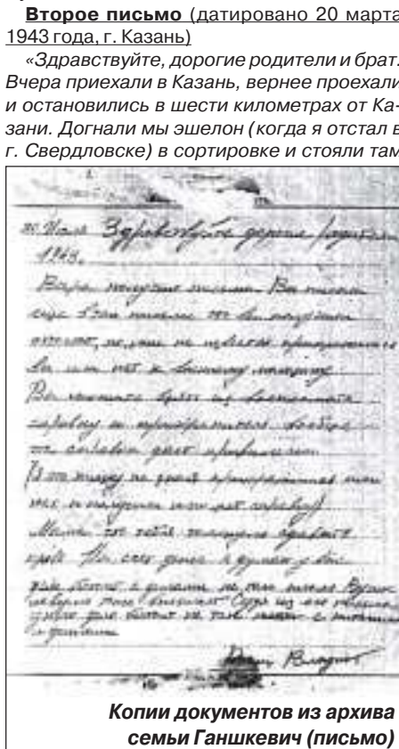
Копии документов из архива семьи Ганшкевич (письмо)

Второе письмо (датировано 20 марта 1943 года, г. Казань) «Здравствуйте, дорогие родители и брат. Вчера приехали в Казань, вернее проехали и остановились в шести километрах от Казани. Догнали мы эшелон (когда я отстал в г. Свердловске) в сортировке и стояли там