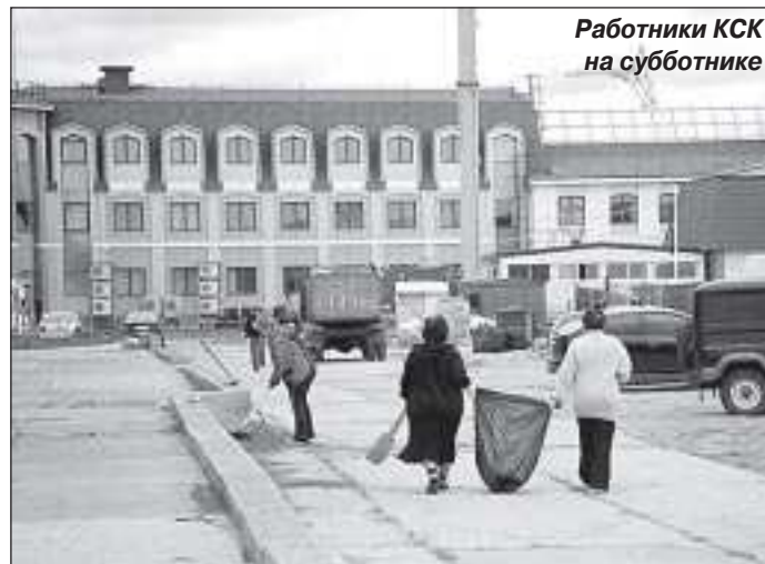
Работники КСК на субботнике

чи рублей) будет затрачена на асфальтирование двух участков улично-дорожной сети Уренгоя (площадью 4477 кв. м на участке от базы ООО «Бригпур» до магазина «Престиж» и от УСОШ № 1 до улицы Глебова). Устройство 60 контейнерных площадок в жилом секторе посёлка потребует затрат на сумму более трёх миллионов 816 тысяч рублей. На устройство пешеходных тротуаров из сборных железобетонных плит общей протяжённостью полкилометра будет затрачено более двух миллионов 756 рублей (от УДШИ до пятиэтажного дома и от УПОМ до рынка «Маяк»). Предусматривается также: установка 14 опор улично-