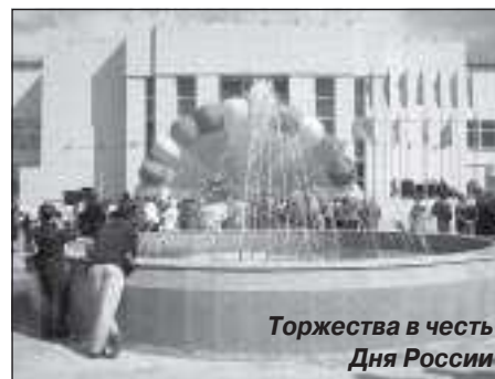
Торжества в честь Дня России

В День защиты детей в учреждениях посёлка состоялись мероприятия. В КСК «Уренгоец» детвора могла встретиться с любимыми героями в мульткафе «Сказочный бум». В филиале КЦСОН для ребят было организовано мероприятие «Детство цвета радуги», которое закончилось праздничным столом с фруктами и сладостями. Оба праздника сопровождались развлекательными программами.