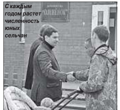
С каждым годом растет численность юных сельчан

Самбург и Халясавэй стали первыми в графике посещения исполняющего полномочия главы Пуровского района Евгения Скрыбина национальных поселков. Подобные выездные совещания уже состоялись в Тарко-Сале, Уренгое, Пурпе и Ханымее. На очереди деревни Харампур и Толька.