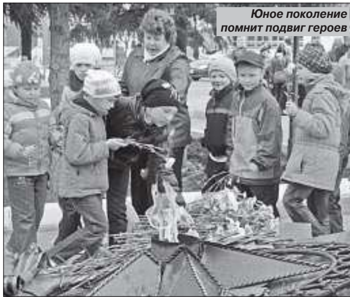
Юное поколение помнит подвиг героев

- День памяти и скорби призван напомнить всем нам о павших воинах, обо всех погибших, замученных в фашистской неволе, умер-