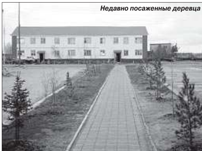
Недавно посаженные деревья

мостиков через наземные коммуникации, контейнерных площадок и контейнеров, новогодней иллюминации, пожарных водоемов, содержание скверов, лесопарков, пляжей, пожводеёмов, санитарную уборку земель общего пользования, разборку бесхозных строений. В настоящее время проходят торги по определению подрядчиков на выполнение этих работ.