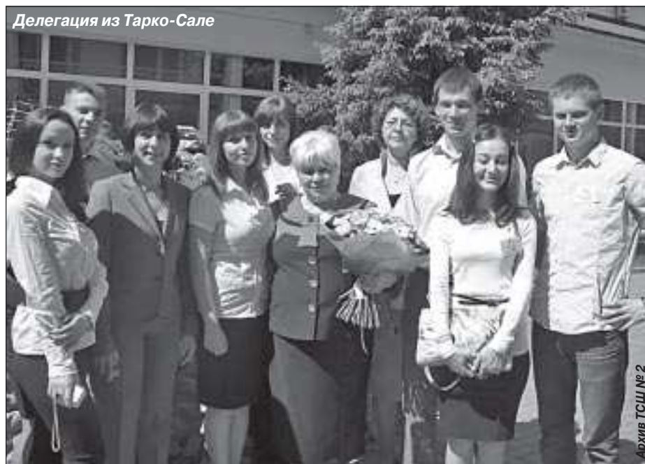
Делегация из Тарко-Сале