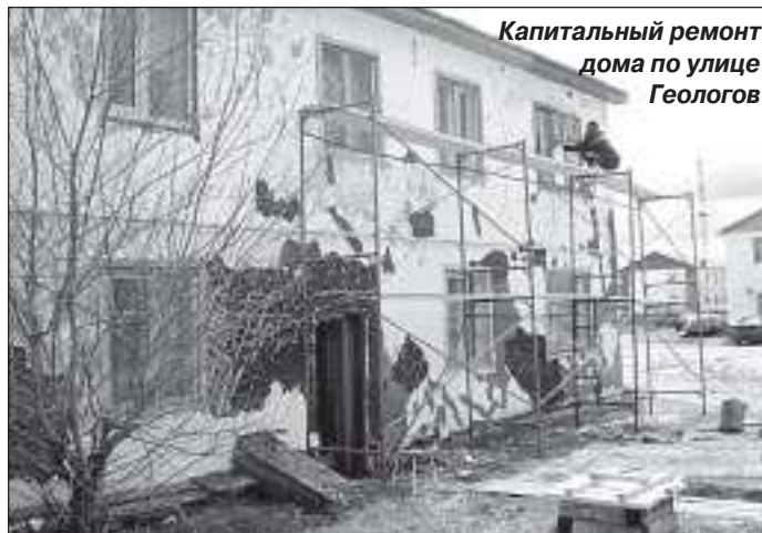
Капитальный ремонт дома по улице Геологов

миллиона 529 тысяч, большая часть которых предназначена для проведения текущего ремонта объектов благоустройства. Ремонтными работами по уличному освещению предусмотрены: выправка опор под линии электропередач, смена светильников, перетяжка проводов с помощью механизмов, устройство управляющего провода на новогоднюю иллюминацию, замена повреждённого участка кабельного подвода уличного освещения. Обустройство и ремонт улично-дорожной сети предусматривает: нанесение дорожной разметки на дороги с твёрдым покрытием, установку дорожных знаков в соответствии с утверждённой схемой дислокации технических средств дорожного движения, текущий ремонт дорог и тротуаров улично-дорожной сети Уренгоя.