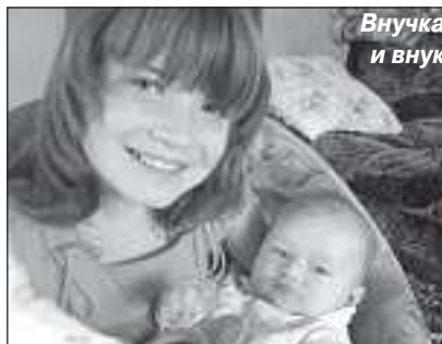
Внучка и внук