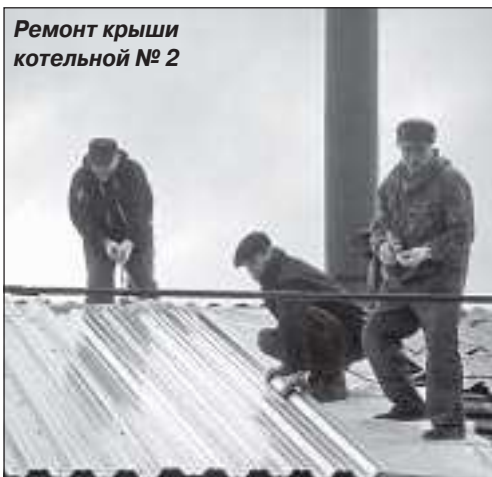
Ремонт крыши котельной № 2

социальной и коммунальной инфраструктуры посёлка в соответствии с соглашением между администрациями муниципальных образований Пуровский район и п. Уренгой. За счёт этих средств – 15 миллионов рублей – в значительной степени преобразится посёлок, поскольку они будут направлены в основном на работы капитального характера. Самая большая часть этой суммы (более пяти миллионов 521 тыся-