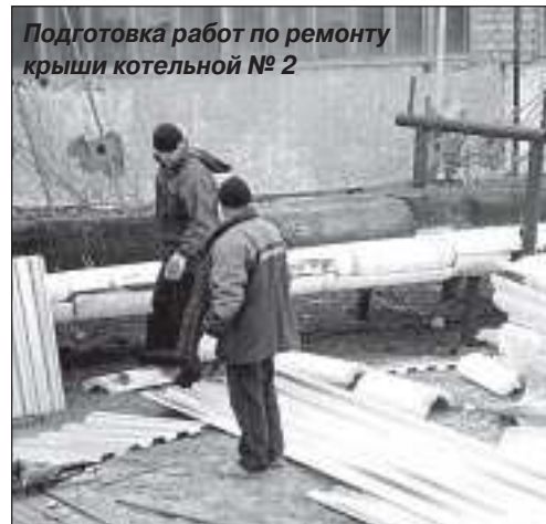
Подготовка работ по ремонту крыши котельной № 2

го освещения на участке внутриквартальной дороги, устройство покрытия из щебёночных материалов участка внутриквартальной дороги в микрорайоне Таёжном и двух автобусных остановок с павильонами возле зданий средних школ, поставка трёх детских спортивно-игровых комплексов со скамейками и установка трёх детских спортивно-игровых комплексов в микрорайонах. Трансферты выделены посёлку в мае, в июне были оформлены заявки на проведение работ. Сами работы будут производиться в июле и августе.