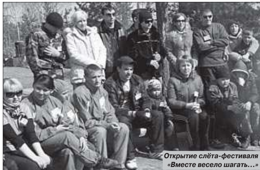
Открытие слёта-фестиваля «Вместе весело шагать...»