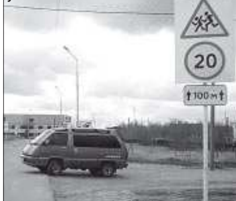
Дорожные знаки установлены этим летом

миллиона 529 тысяч, большая часть которых предназначена для проведения текущего ремонта объектов благоустройства. Ремонтными работами по уличному освещению предусмотрены: выправка опор под линии электропередач, смена светильников, перетяжка проводов с помощью механизмов, устройство управляющего провода на новогоднюю иллюминацию, замена повреждённого участка кабельного подвода уличного освещения. Обустройство и ремонт улично-дорожной сети предусматривает: нанесение дорожной разметки на дороги с твёрдым покрытием, установку дорожных знаков в соответствии с утверждённой схемой дислокации технических средств дорожного движения, текущий ремонт дорог и тротуаров улично-дорожной сети Уренгоя.