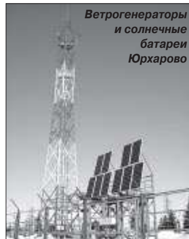
Ветрогенераторы и солнечные батареи Юрхарово