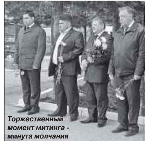
Торжественный момент митинга - минута молчания

Вечная память о героях будет жить в наших сердцах.