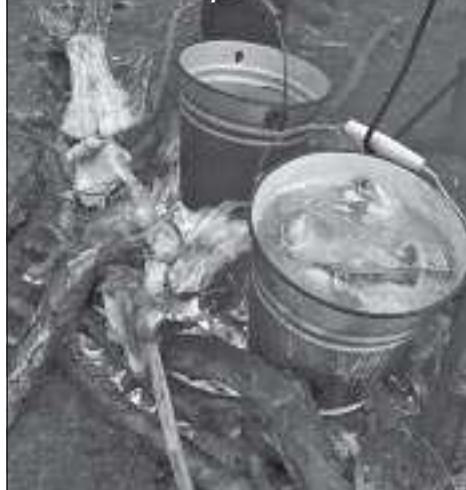
Самая вкусная уха готовится на костре