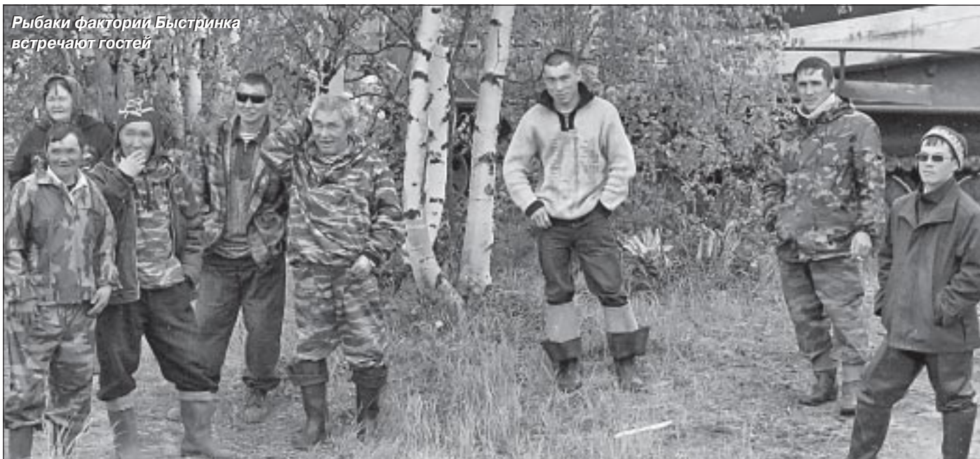
Рыбаки фактории Быстринка встречают гостей