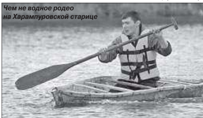
Чем не водное родео на Харампуровской старице