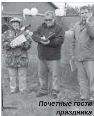
Почетные гости праздника

Разделка рыбы – это женский вид оригинальных состязаний, требующий своеобразного мастерства и определенных навыков и умений. От участниц требовалось разделить рыбу на скорость: почистить, распотрошить и отделить пластинами филейную часть, и чтоб ни единой косточки!