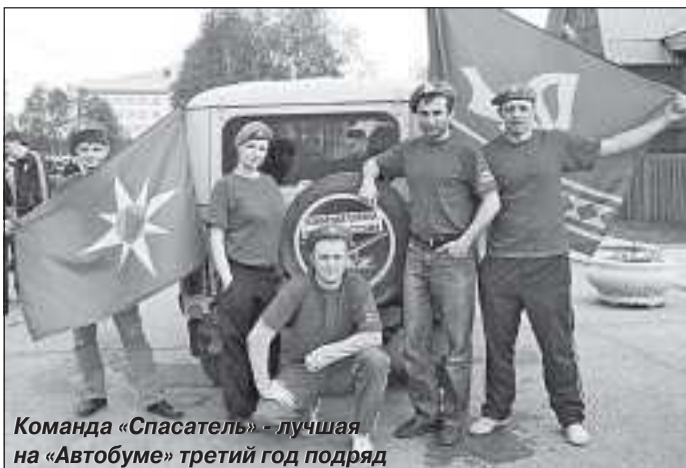
Команда «Спасатель» - лучшая на «Автобуме» третий год подряд

своего железного коня. Возможным это стало благодаря конкурсу, по условиям которого участникам за определённое время необходимо было как можно больше заработать. Из подручных средств - только тряпки и моющие средства. Случайных автомобилистов радовали то ли результат работы, то ли неожиданное участие в игре, но, без сомнения, все клиенты временной придорожной автомайки остались довольны.