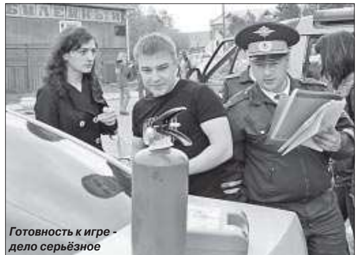
Готовность к игре - дело серьёзное

В этот день некоторым автомобилистам, проезжающим по улице Мезенцева, посчастливилось за очень умеренную плату помыть