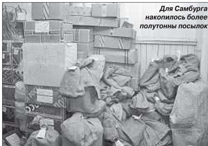
Для Самбурга накопилось более полутонны посылок

Центральное отделение связи принимает ежемесячно около 9 тысяч заказных писем.