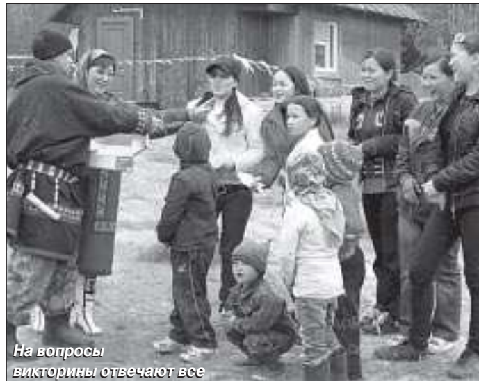
На вопросы викторины отвечают все