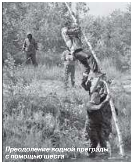
Преодоление водной преграды с помощью шеста

Е. ЛОСИК.