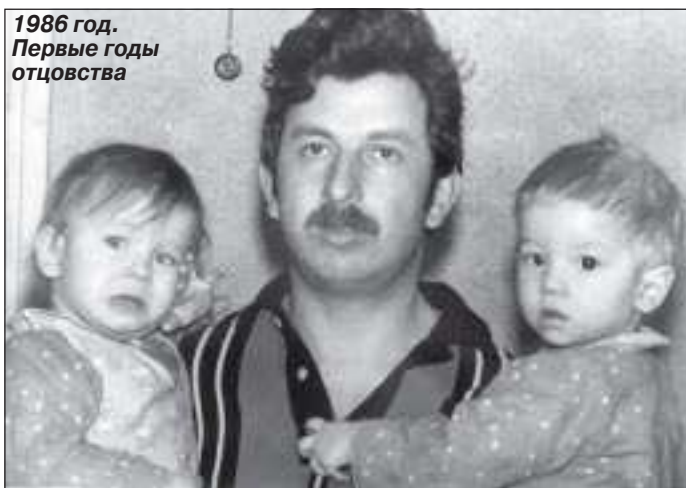
1986 год. Первые годы отцовства

кую должность. А в ноябре 1983 года определили на работу в отдел Государственного пожарного надзора РОВД.