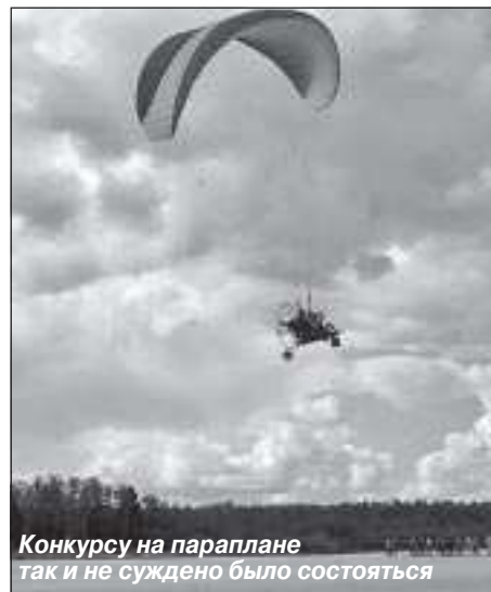
Конкурсу на парашуте так и не суждено было состояться

После завтрака команды в конкурсной форме знакомились друг с другом и шутили на тему футбола. По мнению судей, остроумней всех были «Варвары». Последним мероприятием первого дня игры стала эстафета с пластиковыми стаканчиками, наполненными водой, которые командам нужно было