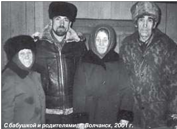
С бабушкой и родителями, г. Волчанск, 2001 г.

Учиться нравилось, появились друзья, двое стали настоящими друзьями на всю жизнь. В училище занимался стрельбой из пистолета, был в составе сборной команды Ташкентского ВОКУ. Спорт стал хорошим дополнением к учебе. Со мной занимались замечательные тренеры. Один был чемпионом Европы по стрельбе из пистолета, второй – чемпионом мира. Справедливости ради скажу, что из трех лет учебы два года я