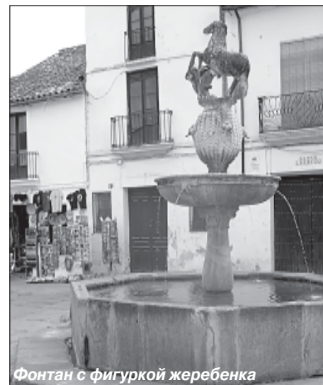
Фонтан с фигуркой жеребенка

От знаменитой на весь мир Кордовской мечети осталось двойственное впечатление. Впрочем, как таковой мечети нет, а есть католический собор - Вознесения Богоматери, встроивший в центр бывшей мечети. Со всех сторон собор обступают знамени-