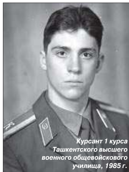
Курсант 1 курса Ташкентского высшего военного общевоинского училища, 1985 г.

Мало кто из молодых людей, выбирая профессию, железно знает, что это – его призвание, что это – то самое, чему он посвятит жизнь. Так же было и у меня. В начале учебы было тяжело. Но к ненормированному армейскому распорядку дня я привык сразу. Мой отец – заядлый рыбак-охотник – нередко брал меня и братьев с собою на промысел. Не поспать ночь-другую для меня не было трудностью. Урал – суровый край, его климат не сравнить с ташкентским. В Узбекистане казалось тепло даже в морозные ночи.