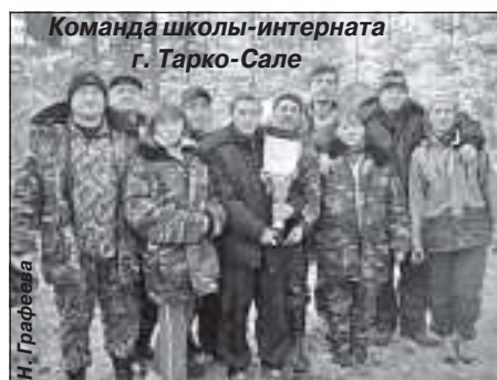
Команда школы-интерната г. Тарко-Сале

В рамках мероприятий совместно с департаментом образования и муниципальным учреждением дополнительного образования «Центр туризма и краеведения» был проведён туристский слёт по летним видам