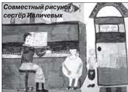
Совместный рисунок сестёр Ивличевых

В рамках Всероссийской акции профсоюза образования «В каждом живёт учитель», направленной на повышение социального престижа профессии и позитивного образа педагога в общественном сознании, прошёл конкурс творческих работ среди воспитанников детских садов и учащихся общеобразовательных школ. Для воспи-