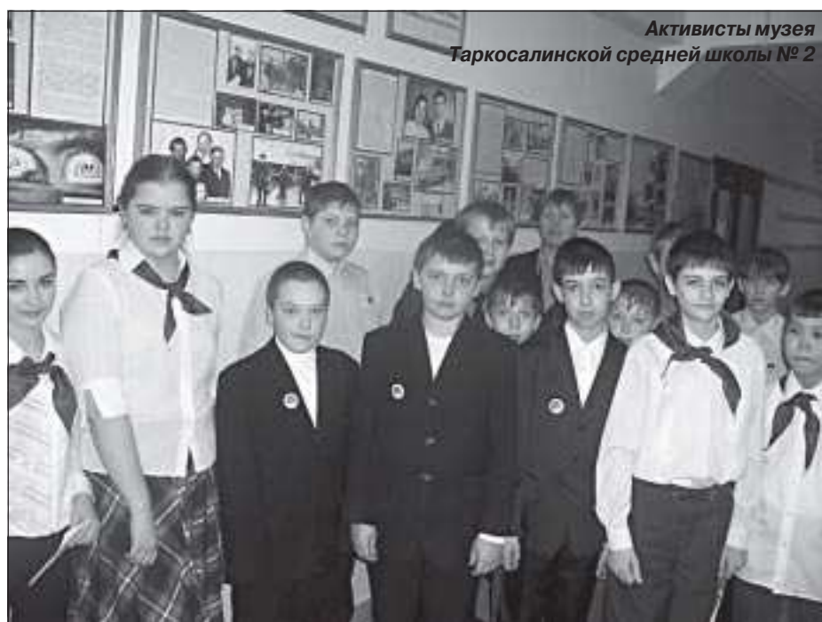
Активисты музея Таркосалинской средней школы № 2

Подготовила С. ИВАНОВА