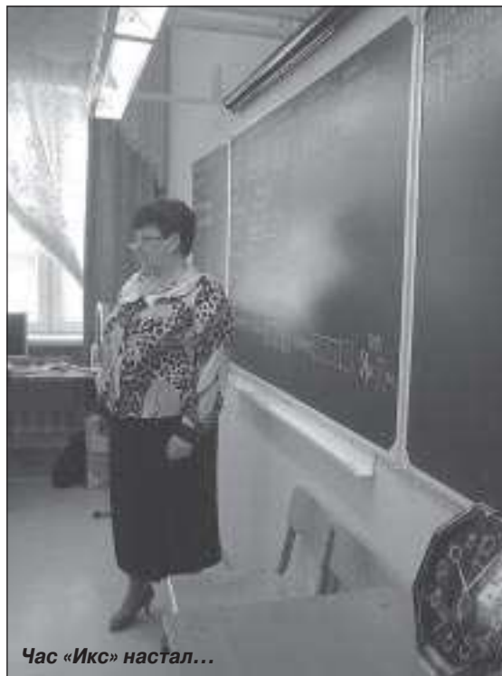
Час «Икс» настал...

Департаментом образования совместно с информационно-методическим центром