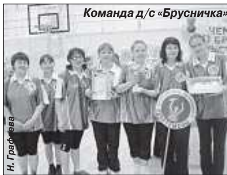
Команда д/с «Брусничка»

туризма, в котором приняли участие команды образовательных учреждений из г. Тарко-Сале, посёлков Пурпе, Пуровск, Ханымей. В результате двухдневной борьбы первое место у команды МООУ «Санаторная школа-интернат» г. Тарко-Сале, второе - у команды МОУ ДОД «Дом детского творчества» п. Пурпе, третье место у команды школы-интерната д. Харампур.