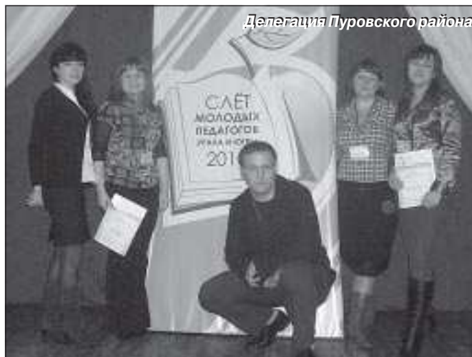
Делегация Пуровского района

Слет проводился с целью формирования и развития устойчивой среды профессионального общения, стимулирования молодых пе-