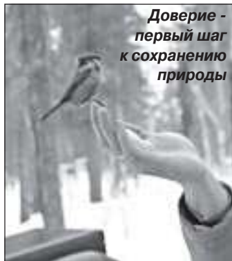
Доверие - первый шаг к сохранению природы

Проблема отношений человека и окружающей среды стала сегодня в ряд острых и неотложных забот человечества. Сохранить гармонию человека и природы - основная задача, стоящая перед молодым поколением.