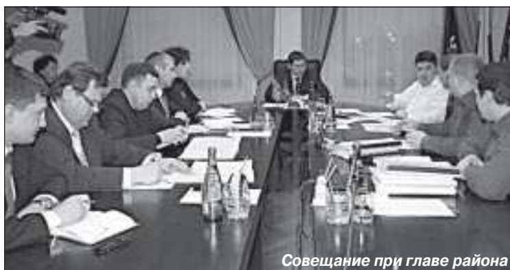
Совещание при главе района

Предстоящая реконструкция улиц включает в себя замену сетей тепловодоснабжения, связи, электросетей, газовых труб, но-