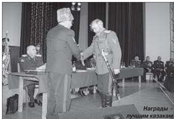
Награды - лучшим казакам

- обеспечение участия казачества в возрождении принципов общегосударственного патриотизма, верного служения Отечеству на основе традиций казачества,