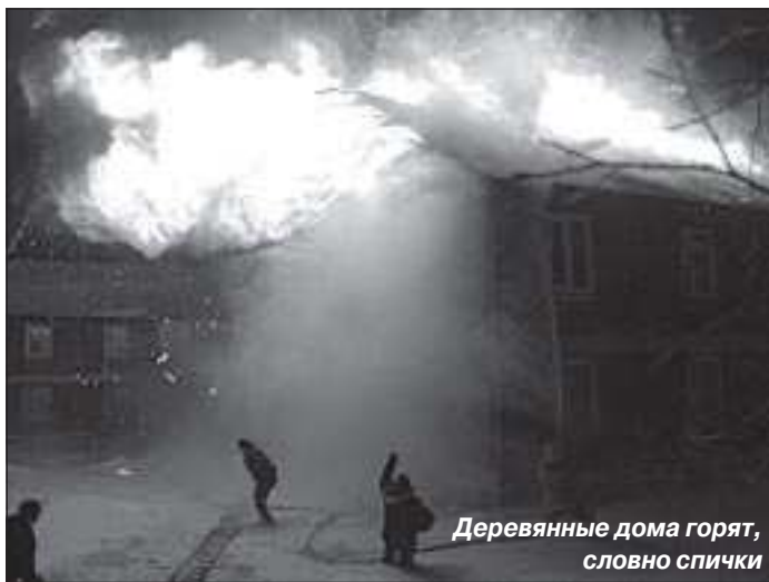
Деревянные дома горят, словно спички

полосы, раньше их называли минерализованными. Ширина противопожарных разрывов будет расти по отношению к прежним нормативам. В Красноселькупском районе, где я в свое время работал главным государственным инспектором по пожарному надзору, есть такой поселок Ратта, окруженный лесом. Так там администрация изыскала средства и провела противопожарную полосу – на 50 метров вырубили всё. Внешний вид, конечно, испортился, но поселок защищен от возможной беды со стороны лесного массива. У нас этого пока нет. Наряду с Халясавзем и Харампуром в такой защите нуждается и Уренгой – опасные