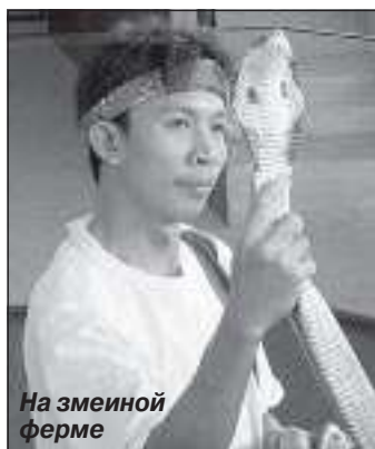
На змеиной ферме

Недалеко от города расположено несколько крокодиловых, змеиных, слоновьих ферм, где устраиваются всевозможные представления с участием животных. Мы не упустили возможность посмотреть и на это.