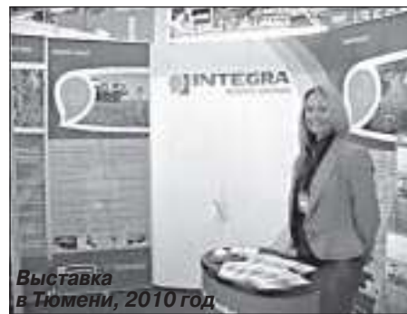
Выставка в Тюмени, 2010 год

- По сравнению с прошлым годом план у нас довольно агрессивный. Заказы непростые, вплоть до опытно-методических исследований, которые планирует заказать ТНК-ВР. Они хотят опробовать новые технологии и методики. С профессиональной точки зрения – это интересно. С точки зрения бизнеса – не просто, так как нам необходимо будет выполнить все жесткие требования и получить прибыль.