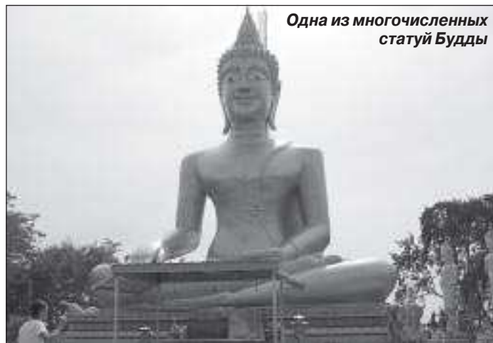
Одна из многочисленных статуй Будды

В 70-е годы прошлого века это была небольшая деревенька, где американцы во время войны с Вьетнамом организовали военную базу. А поскольку военным надо было где-то жить, питаться, развлекаться, здесь стали строить отели, рестораны, магазины, деревенька начала быстро развиваться. Сегодня это курортный город, пожалуй, самый известный в стране. Расположена Паттайя на берегу Сиамского залива, в двух часах езды от Бангкока. Здесь имеются все виды развлечений, необходимых отдыхающим. Всю прибрежную по-