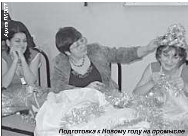
Подготовка к Новому году на промысле

Вместе с персоналом ТСНГ отмечаем все знаменательные события, готовим праздничные программы и находим полное взаимопонимание, а когда быт налажен, то и производственных успехов легче добиваться, а в результате выигрывают оба предприятия.