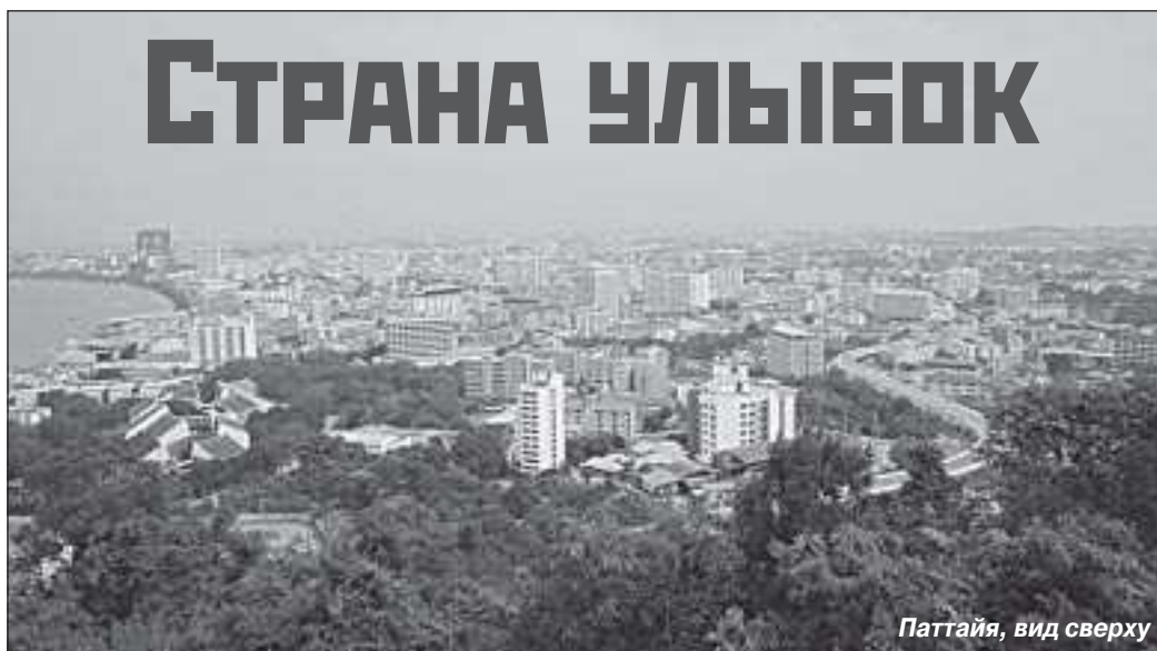
Паттайя, вид сверху

Как приятно в разгар морозов оказаться в солнечной и теплой стране, скинуть зимние одежды, поплавать в море, позагорать под ласковым солнышком. Сейчас это сделать просто. Туристические фирмы предлагают разные страны на любой вкус. В турагентстве Тарко-Сале предложили Тайланд. Честно говоря, планировала ехать не туда, но подвернулась дешевая путёвка, я собралась и не пожалела.