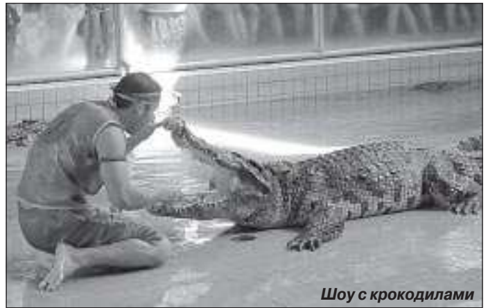
Шоу с крокодилами

В 17 километрах от Паттайи расположен тропический сад Нонг Нуч. Это красивейший садо-