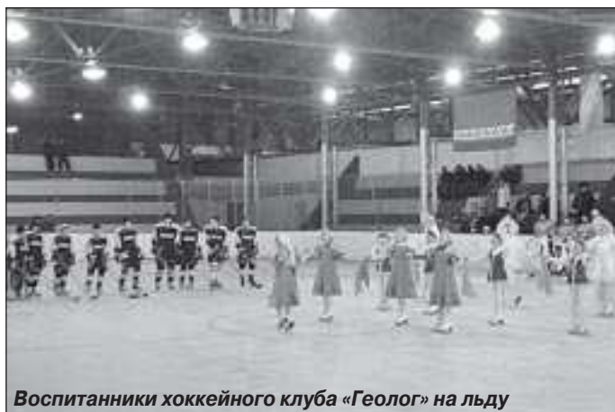
Воспитанники хоккейного клуба «Геолог» на льду