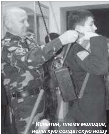
Исынтай, племя молодое, нелегкую солдатскую ношу

Каждый, кто служил, подтвердит мои слова, что место службы – это во многом определяющий фактор самой службы. За два года мне довелось побывать во многих воинских частях, стоявших как в Монголии, так и в Советском Союзе, и я могу с полной уверенностью сказать, что каждый воинский гарнизон при массе сходств имеет свои особенности и традиции. Забайкальский военный округ в целом отличался сильным влиянием сержантского состава. Забайкалье никогда не относилось к престижным местам службы, и следствием этого было то, что офицеров и прапорщиков был вечный некомплект. Поэтому весь груз внутригарнизонной службы лежал на плечах сержантов старшего призыва. К примеру, во многих частях, где мне довелось побывать, сержанты срочной службы стояли на должностях стар-