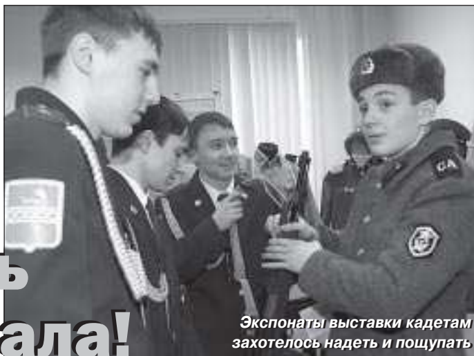
Экспонаты выставки кадетам захотелось надеть и пощупать