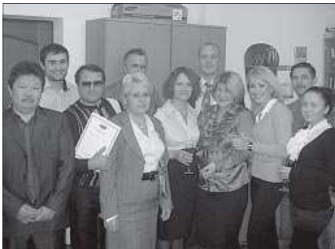
Профсоюзный актив «Тернефтегаза»

Профсоюзным комитетом за отчетный период были проведены конкурсы детских рисунков к 23 февраля, к Дню Победы. Также за счет профсоюзных взносов организовывались детские утренники и поздравлялись юбиляры.