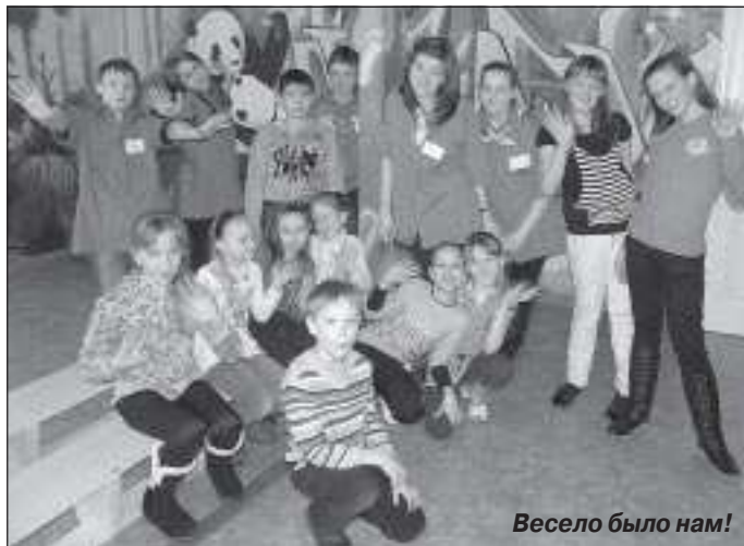
Весело было нам!