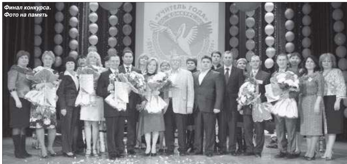
Финал конкурса. Фото на память

– Любой учитель должен развиваться, и как раз такие конкурсы позволяют познакомиться с опытом других учителей. Я живу и работаю на самом юге Пуровского района, и педагоги Ханымея вынуждены вариться в собственном соку. Общение с помощью Интернета никогда не заменит живого слова. Здесь я увидел, прежде всего, как работают другие учителя, мои соперники. Ну и самому захотелось попробовать свои силы. Задания, которые я готовил дома, какое-то лучше, какое-то хуже, я воплотить сумел. Но, на мой взгляд, самые сложные конкурсы-импровизации – разговор с родителями и круглый стол образовательных политиков. Зато было интересно: полный экспромт, полная неожиданность. На победу надеемся, наверное, все мы, но то, что я стал лауреатом, считаю уже своей личной победой.