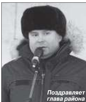
Поздравляет глава района