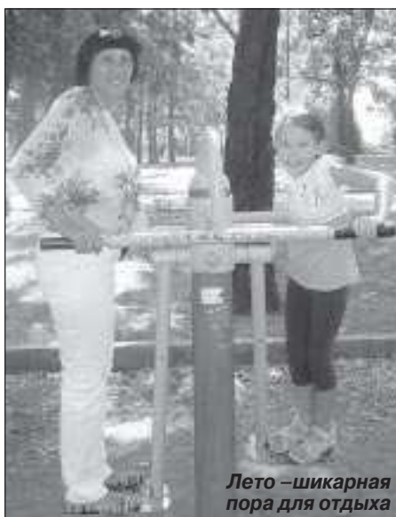
Лето – шикарная пора для отдыха

Несомненно, претенденты на роль приемных родителей проходят своеобразный отбор. Ими должны стать абсолютно здоровые люди – без патологических заболеваний, не состоящие на учете у нарколога или психиатра. Следует отметить, что учитываются и размеры жилой площади, где будет проживать ребенок, и состав семьи – предпочтительнее отдается полным семьям. Открытие приемной семьи становится возможным, если на воспитание берутся дети, при этом их количество не должно превышать восьми человек с учетом собственных деток. Де-