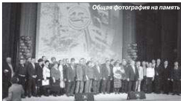
Общая фотография на память

- Третий год подряд работаю на празднике, на охране общественного порядка. Настроение, безусловно, рабочее, но оставаться равнодушной ко всему происходящему вокруг очень сложно – праздник чувствуется во всем: в счастливых лицах людей, в музыке, посмотрите, ка-