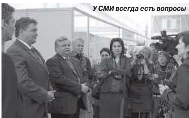
У СМИ всегда есть вопросы

инновационными центрами РФ. Диапазон научной мысли широк, предлагаемые новинки могут найти практическое применение в отраслях газовой промышленности. Это и современное оборудование для проведения геологических и геофизических работ, для разработки месторождений, строительства скважин и трубопроводов, и трубные изделия, и контрольно-измерительные приборы, и средства связи и коммуникации.