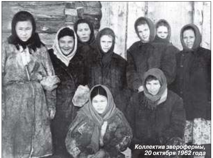
Коллектив зверофермы, 20 октября 1962 года