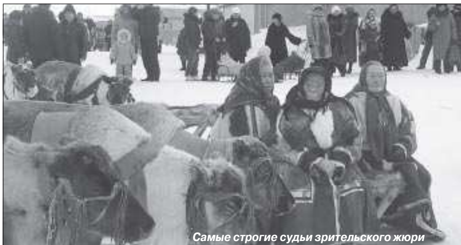
Самые строгие судьи зрительского жюри

День оленевода каждый год с большим нетерпением жду. Спешу на праздничную площадь с самого раннего утра. Рад видеть пастухов, их детей. Точно знаю, что без таких общих праздников нельзя. Они связывают