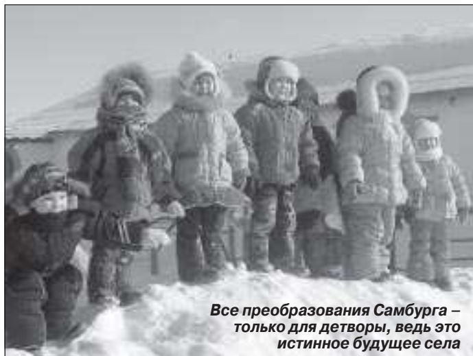
Все преобразования Самбурга – только для детворы, ведь это истинное будущее села