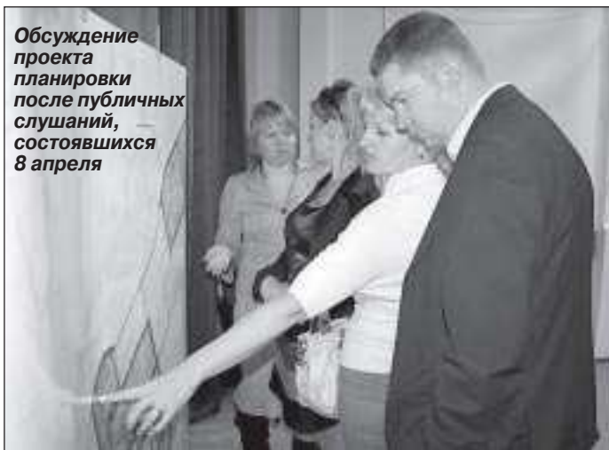
Обсуждение проекта планировки после публичных слушаний, состоявшихся 8 апреля