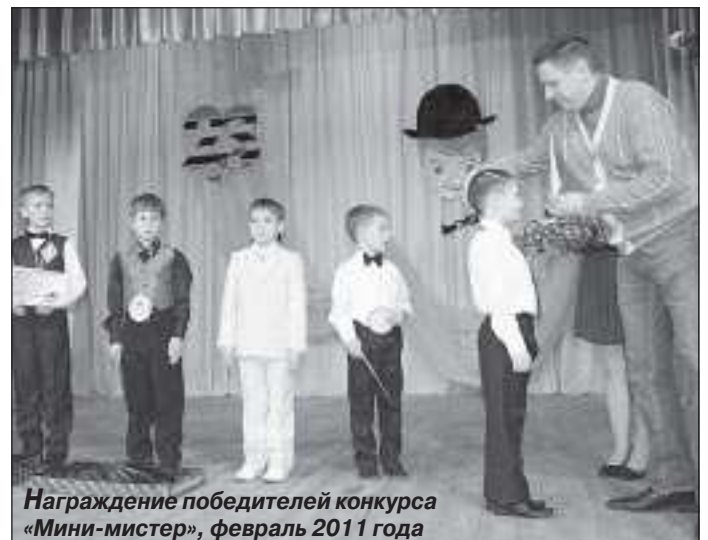
Награждение победителей конкурса «Мини-мистер», февраль 2011 года

После окончания школы, несмотря на возможность связать свою судьбу со спортивной карьерой, юноша захотел стать офицером. И поступил в Ульяновское высшее военно-техническое училище, готовившее снабженцев.