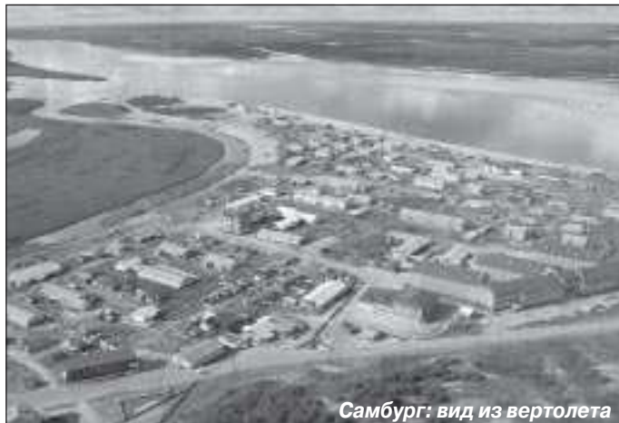
Самбург: вид из вертолета

- Всегда приятно говорить о достижениях, но неправильно было бы умолчать и о проблемах. Они есть и у Самбурга. Мы обеспокоены отсутствием чистой питьевой воды, несомненно, это негативно сказывается на здоровье односельчан. Пока отсутствует система централизованного газоснабжения. Не до конца отрегулирована транспортная схема сообщения между поселениями, что затрудняет