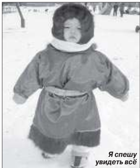
Я спешу увидеть всё

9 апреля население маленького села Самбург выросло без преувеличения раза в два. Улицы, центральная площадь и берег реки Пур были переполнены его жителями, съехавшимися со всей самбургской тундры кочевниками и многочисленными гостями, прибывавшими сюда и на вертолетах, и по зимнику. Сколько у организаторов было переживаний, что праздник сорвется из-за необычно ранней весны! Но погода не подвела. Она держалась буквально из последних «зимних» сил, давая возможность оленеводам показать себя и свои достижения. И только поздно вечером, когда все село ос-