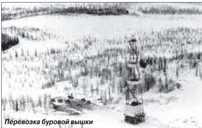
Перевозка буровой вышки