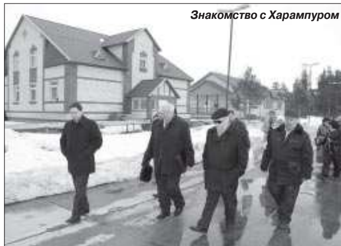
Знакомство с Харампуром

- Считаем, что для оленеводческих субъектов должен быть установлен упрощенный порядок оформления землеустройства и постановки на кадастровый учет земель любых категорий. Можно, к примеру, формировать землеустройство оленеводческих хозяйств, как было прежде, установлением внешних границ, независимо от наличия на данном участке иных объектов и участков.