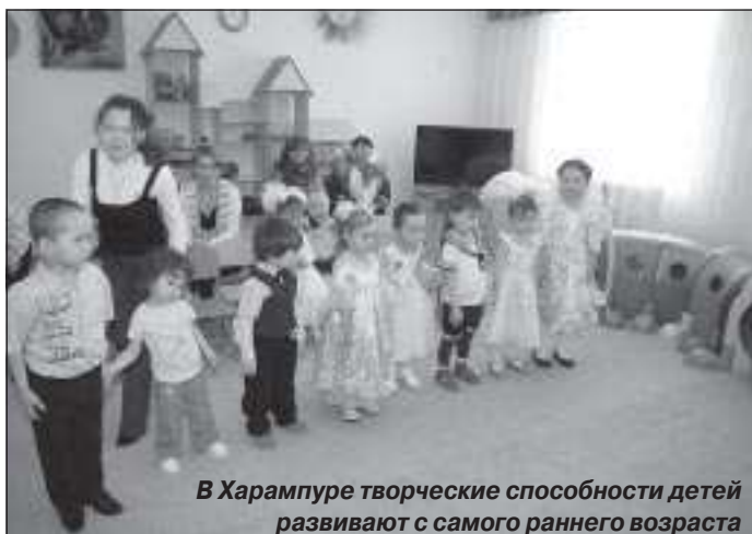
В Харампуре творческие способности детей развивают с самого раннего возраста

- Отмечу, что на Ямале огромное внимание уделяется сохранению родных языков. Общее количество школьников, изучающих их, составляет 5023 человека или 53,4 процента от общего количества