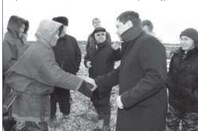
Встреча с оленеводами ООО «Совхоз «Верхне-Пуровский»

С докладами в рамках заседания выступили главы муниципальных образований, которые говорили об опыте работы по защите