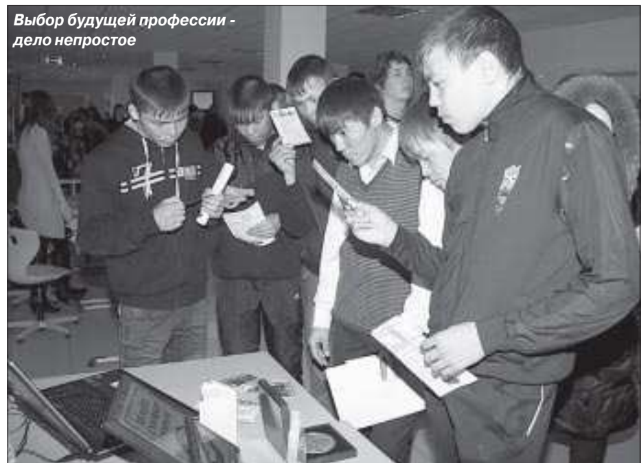
Выбор будущей профессии - дело непростое