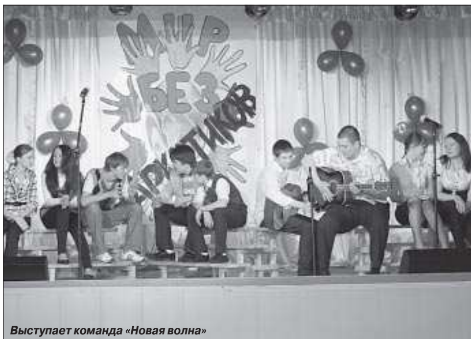
Выступает команда «Новая волна»