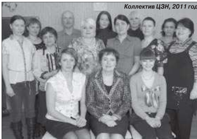
Коллектив ЦЗН, 2011 год