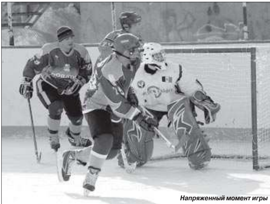
Напряженный момент игры

От редакции. Пока материал готовился к печати, лед растаял. Эти полные спортивного задора фотографии – история уже ушедшей зимы. Зима ушла, и любители ледовых сражений остались остались без своего увлечения. Но с надеждой, что недалек тот день, когда погонять шайбу в свое удовольствие можно будет вне зависимости от поры года и таких капризных на Севере погодных условий.