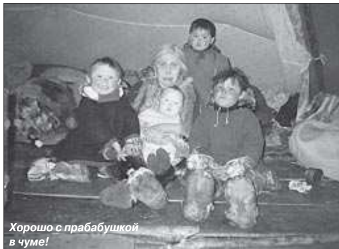
Хорошо с прабабушкой в чуме!

Вечером в стойбище приехали на упряжке родители. Пока оленей распрягали, к ним с богатой добычей подошли старший сын-охотник и средний сын-рыбак. Услышал младший, что возле чума голоса раздаются. Выскочил, расцеловал всех и позвал к огню чай пить. Удивились родственники. Смотрят и не узнают своего младшего сына и брата. Спрашивают, что случилось, отчего такие перемены в нем. Рассказал он о вороне, о вороненке, о коршуне злом.