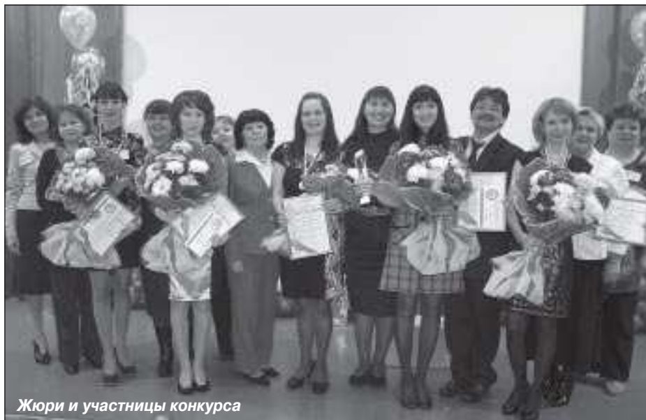
Жюри и участницы конкурса

5-6 апреля 2011 года в Пуровском районе состоялся II (очный) тур районного конкурса педагогического мастерства «Лучший педагог детского сада». Участие в профессиональном соревновании приняли пять педагогов из пяти муниципальных дошкольных образовательных учреждений района.