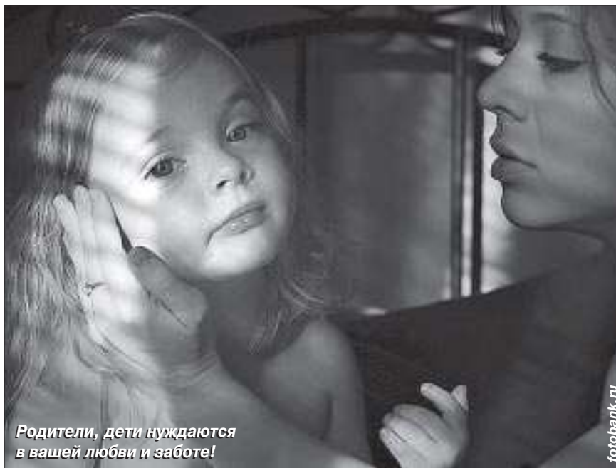
Родители, дети нуждаются в вашей любви и заботе!

Для детей, регулярно подвергающихся психологическому насилию, свойственны следующие черты: задержка психического развития; невозможность сконцентрироваться, плохая успева-