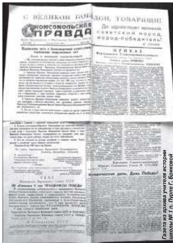
Газета из архива учителя истории школы № 1 г. Пурге Г. Бриковой