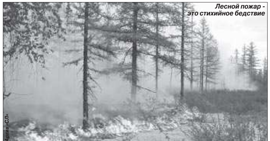
Лесной пожар - это стихийное бедствие

Отдел надзорной деятельности по Пуровскому району ГУ МЧС РФ по ЯНАО