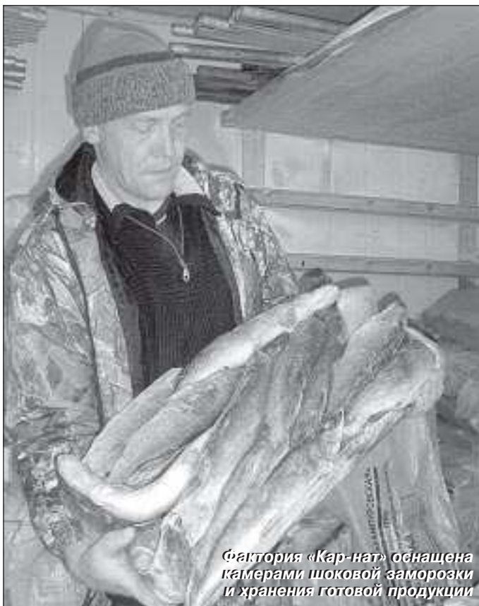
Фабрика «Кар-нат» оснащена камерами шоковой заморозки и хранения готовой продукции

молочные продукты. Правда, этим летом магазин был закрыт на капитальный ремонт. Конечно, были сложности с покупкой необходимого. Но зато сейчас магазин утеплен, установлены пластиковые окна и металлические двери, пристроена большая светлая веранда. Вид у него теперь цивилизованный. Осталось только сделать более продолжительным режим работы торговой точки в будние дни и организовать ее в выходные и праздничные.