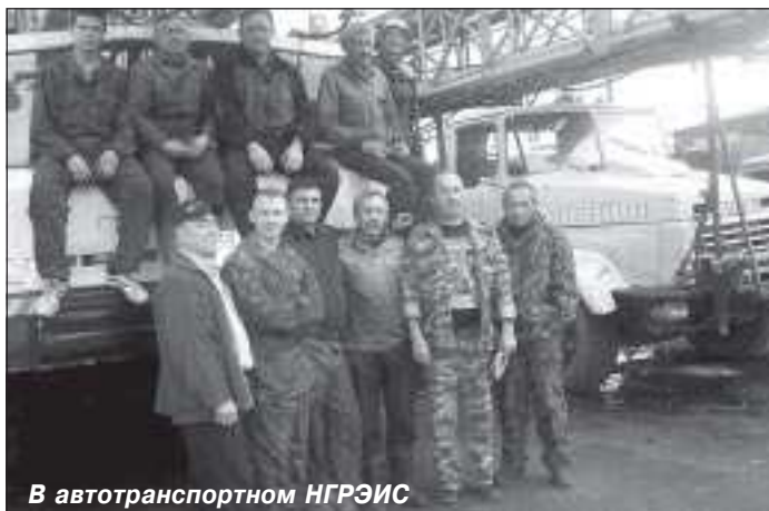
В автотранспортном НГРЭС

Автомобиль уже давно перестал быть роскошью, а стал обычным средством передвижения. На Севере машина есть практически в каждой семье. Стать автолюбителем может каждый, кто пройдет специальное обучение и сдаст экзамен. Правда, сделать это непросто, некоторым приходится пересдавать несколько раз. А некоторые, получив водительское удостоверение, сесть за руль так и не решаются. Казалось бы, что проще, знаешь правила дорожного движения - крути себе баранку. Но на дорогах всякое может случиться.