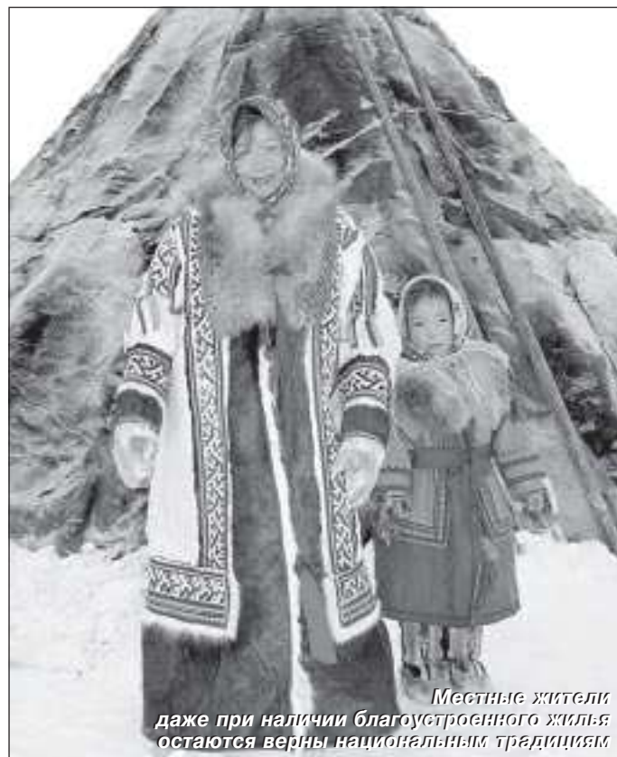
Местные жители даже при наличии благоустроенного жилья остаются верны национальным традициям

Оксана АЛФЁРОВА, фото автора и из архива «СЛ»