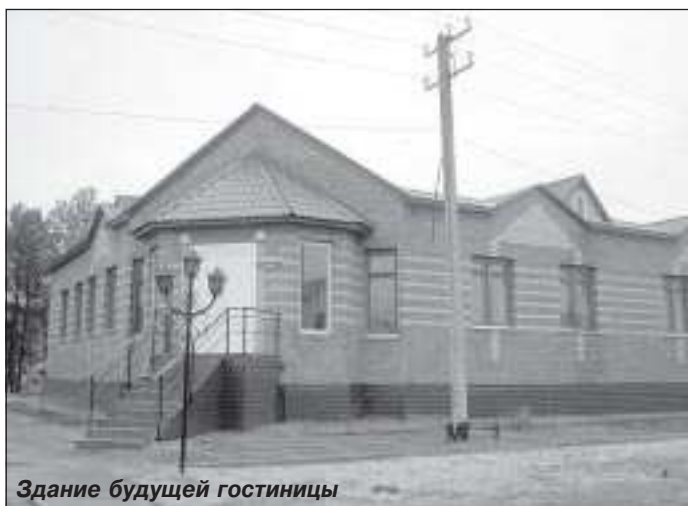
Здание будущей гостиницы