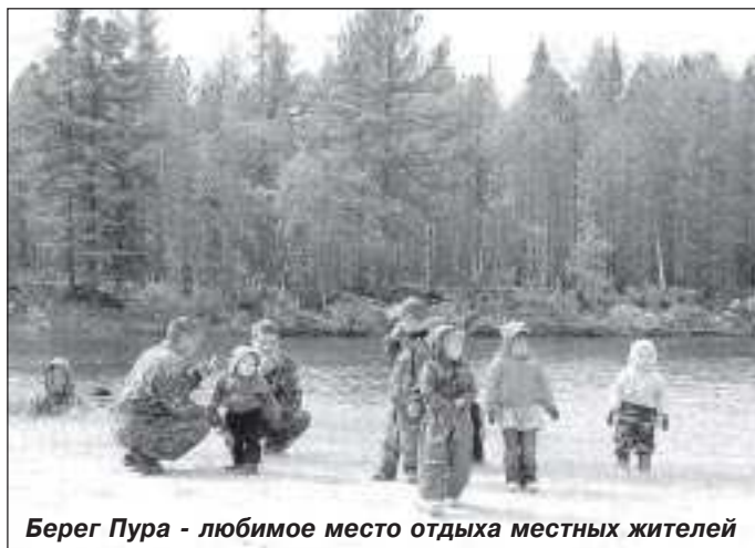
Берег Пура - любимое место отдыха местных жителей

- Два года отсутствует регулярное транспортное сообщение между Харампуром и райцентром. Оно закрылось из-за низкого потока пассажиров. Дело в том, что последняя цена на билет в одну сторону составляла почти 400 рублей. Если необходимо выехать всей семьей, а это примерно 4-5 человек, то сумма получалась внушительная. За такие деньги удобнее заказать такси. Тогда можно будет не зависеть от расписания