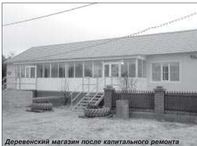
Деревенский магазин после капитального ремонта