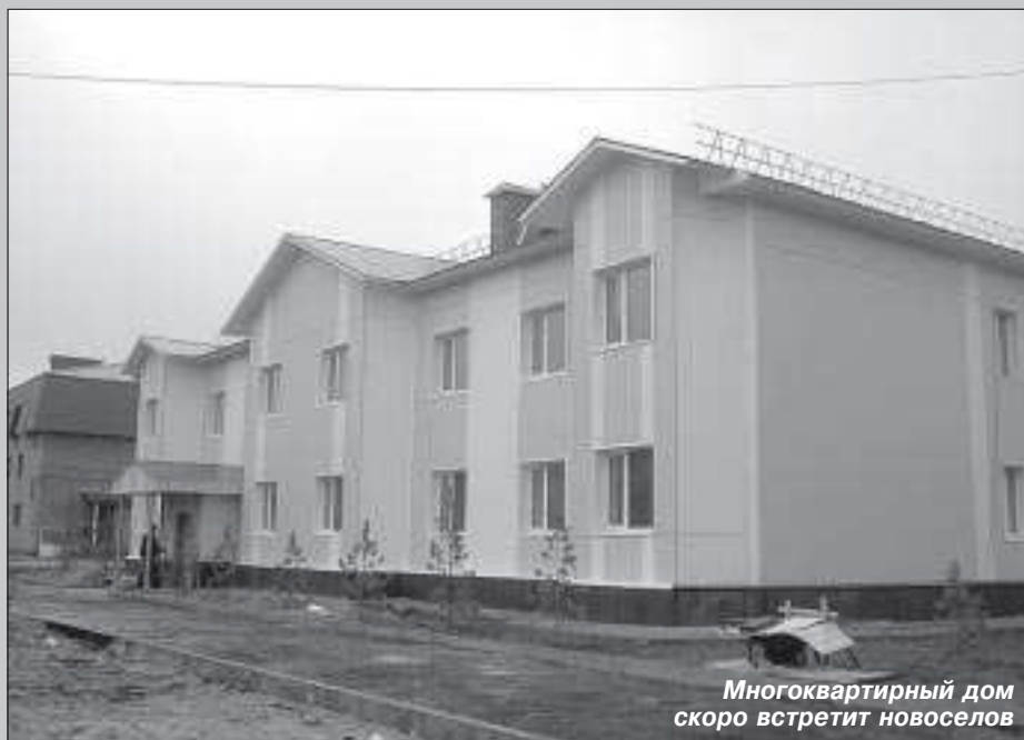
Многоквартирный дом скоро встретит новоселов

Именно они, их отношение к своей малой родине и являются главной особенностью национальной деревни. В Харампуре все от мала до велика знают друг друга. Малейшее изменение во внешнем облике поселения отмечается сразу. У кого, как не у местных жителей, можно узнать о деревенских новшествах, о том, что уже сделано, что запланировано на ближайшее будущее и даже о чем они мечтают. И вот что они говорят: