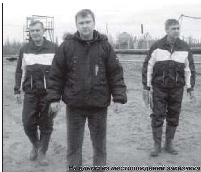
На одном из месторождений заказчика

на тендер с одними расчётами, а за это время цена на дизтопливо выросла на 10 процентов.