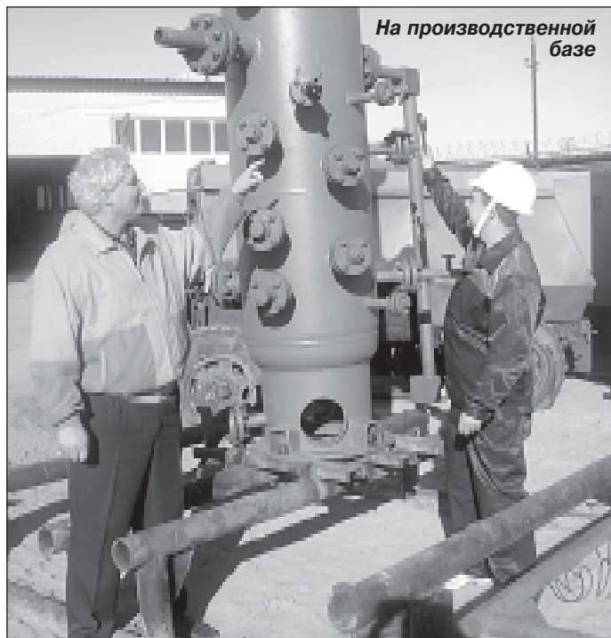
На производственной базе

К сожалению, не все предприятия своевременно платят за выполненные нашей экспедицией объёмы работ, это не лучшим образом сказывается на производственной ситуации. В результате на закупку необходимого оборудования приходится брать кредиты в банке и выплачивать проценты. К тому же, пока проходят тендеры, цены на необходимые составляющие для обеспечения производственного процесса растут. К примеру, недавно подали заявку