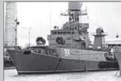
МПК-192 «Уренгой» – малый противолодочный корабль.

Смотрел на будущих моряков, уходящих этим субботним вечером в армию, и думал: а ведь пройдет совсем немного времени и память этих ребят пополнится еще одним незабываемым впечатлением –