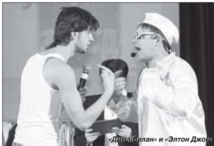
«Дима Билан» и «Элтон Джон»