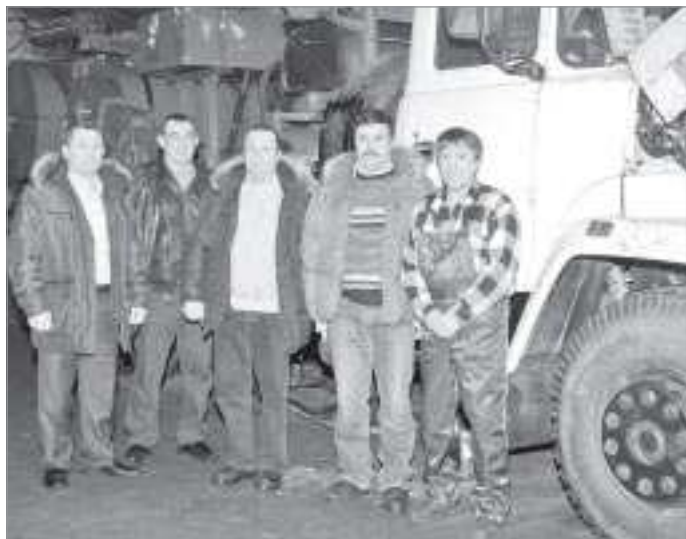
Коллектив цеха технологического транспорта

два. Вся молодость и лучшие годы связаны с экспедицией. Это не просто предприятие, а родной дом, где тебя окружают близкие люди, которые стараются, чтобы в нем было все благополучно».