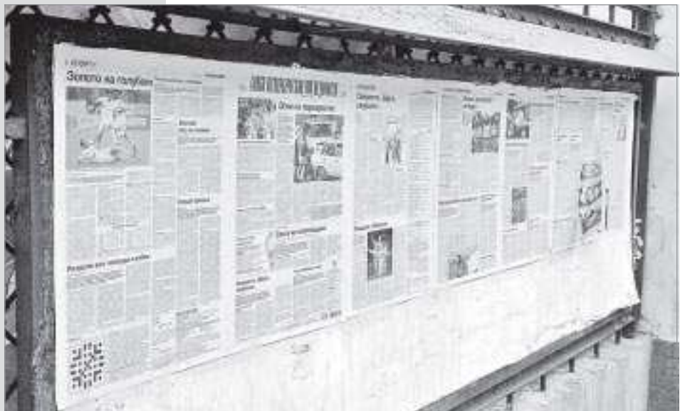
«Санкт-Петербургские ведомости» до сих пор выходят. Газета на специальном уличном стенде

С УКАЗА ПЕТРА I, ПРИНЯТОГО В 1703 ГОДУ, 13 ЯНВАРЯ В НАШЕЙ СТРАНЕ ПРАЗДНУЕТСЯ КАК ДЕНЬ РОЖДЕНИЯ ПЕРВОЙ ОТЕЧЕСТВЕННОЙ ГАЗЕТЫ. СЕГОДНЯ ПРАЗДНИК НАЗЫВАЕТСЯ ДЕНЬ РОССИЙСКОЙ ПЕЧАТИ И ОТМЕЧАЕТСЯ ВСЕМИ ПРОФЕССИОНАЛАМИ, РАБОТАЮЩИМИ КАК В ПЕРИОДИЧЕСКИХ ИЗДАНИЯХ, ТАК И НА ТЕЛЕВИДИИ И РАДИО.