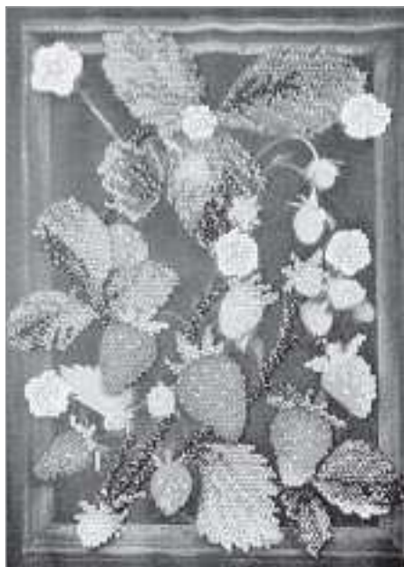
Натюрморты к кухонному интерьеру