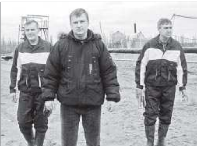
На одном из месторождений заказчика, 2007 год