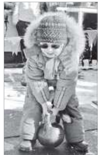
Подрастающий Геркулес из Тарко-Сале

Основное же спортивное состязание происходило на хоккейном корте первой школы. Здесь состоялся открытый турнир по хоккею на Кубок главы