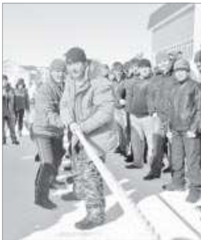
Команда «Север» по перетягиванию каната