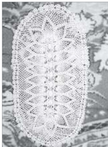
Каждый узор - и сердце, и душа

Во все свои работы опытная рукодельница вкладывает сердце и душу. «Когда заканчиваю, мне так хорошо становит-