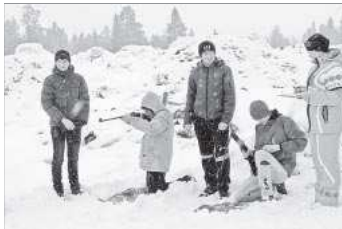
Снегопад - не помеха для меткой стрельбы

Эту игру посвятили 70-летию Сталинградской битвы, поэтому знание основных этапов переломного сражения в истории Великой Отечественной войны было обязательным. После прохождения эстафеты команда второй школы «Оба-на!» опережала своих соперников на 9 баллов, и, казалось, победа была уже у них в кармане. Оставался только штурм снежной крепости. Но его итоги изменили ситуацию на противоположную: игрок команды-лидера замешкался на вершине и попросту забыл забрать символ победы, чем и воспользовался его соперник. В итоге флаг вместе с куб-