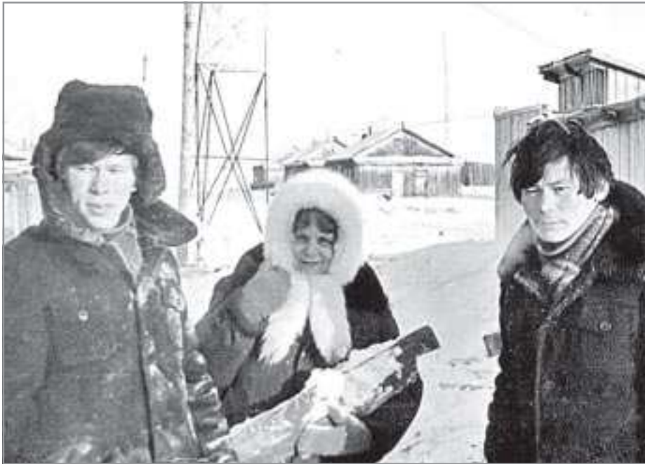
На заготовке дров для столовой интерната. 1981 год

ко лет, проведенных рядом с родными людьми в маленьком деревянном домике на берегу Урала, стали для меня одним из самых светлых воспоминаний. Там же, в Оренбурге, я, самая обычная советская школьница, услышала объявление Совинформбюро о начале войны.