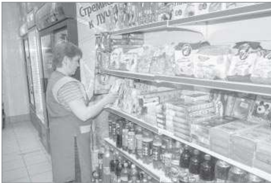
Магазины самообслуживания в городе уже не редкость

- Определяющую роль играют сегодня рыночные отношения, спрос потребителей. Хотя определенные нормы, конечно же, существуют. Установлены нормативы минимальной обеспеченности населения площадью торговых объектов в Ямало-Ненецком автономном округе. Так, норматив минимальной обеспеченности населения площадью торговых залов по продаже продовольственных товаров в Пуровском районе составляет 136 квадратных метров на 1000 жителей, по факту - 350 квадратных метров. По площади торговых залов по продаже непродовольственных товаров норматив для нашего района - 316 кв. метров на 1000 жителей, в реальности также имеем больше - 552. Суммарный норматив минимальной обеспеченности населения пло-