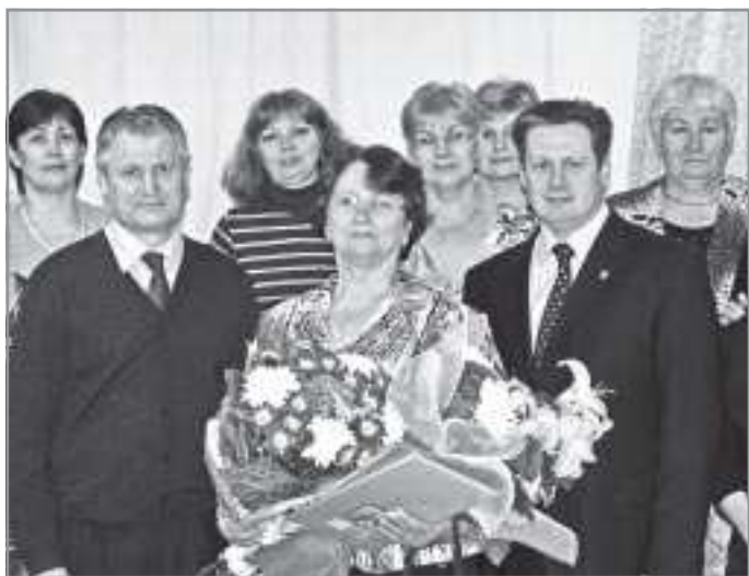
Фото на память с руководителями и коллегами

нула бы: «Конечно, одна я бы ничего не сделала, мой коллектив - это не просто коллектив, это уже моя семья. Люди, к которым я пришла в свое время и которые пришли в детсад одновременно со мной, - мы вместе до сих пор».