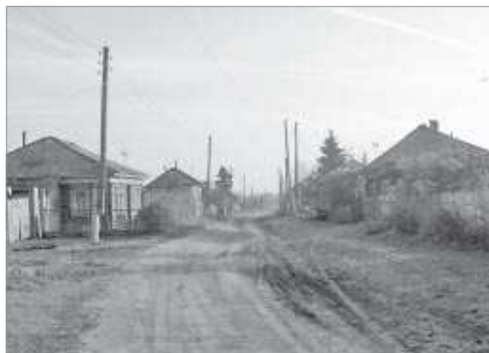
Длинные улицы Окунёво