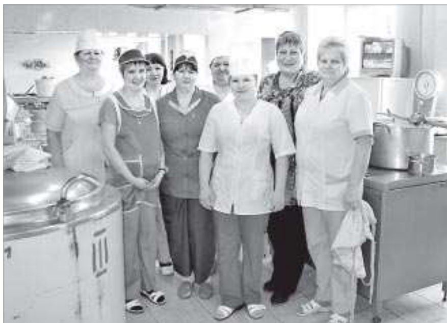
Коллектив столовой школы №1

В СТОЛОВОЙ ШКОЛЫ №1 ГОРОДА ТАРКОСАЛЕ ТРУДИТСЯ ЗАМЕЧАТЕЛЬНЫЙ ЖЕНСКИЙ КОЛЛЕКТИВ. КАЖДАЯ ИЗ ЖЕНЩИН - НАСТОЯЩИЙ ПРОФЕССИОНАЛ В ПОВАРСКОМ ДЕЛЕ. СКОЛЬКО ВКУСНЫХ И ПИТАТЕЛЬНЫХ БЛЮД ДЛЯ ШКОЛЬНИКОВ ОНИ ПРИГОТОВИЛИ ЗА ВСЕ ГОДЫ РАБОТЫ, ДАЖЕ НЕ СОСЧИТАТЬ - ПРЕДСТАВИТЬ ТРУДНО! КОГДА ПОДХОДИТ К ЗАВЕРШЕНИЮ ТРУДОВОЙ ДЕНЬ, ДАМЫ ОТПРАВЛЯЮТСЯ ПО ДОМАМ, ГДЕ ИХ С НЕТЕРПЕНИЕМ ЖДУТ СЕМЬИ. МНЕ СТАЛО ИНТЕРЕСНО: ЧЕМ ЖЕ ПОТЧУЮТ СВОИХ РОДНЫХ И БЛИЗКИХ ДИПЛОМИРОВАННЫЕ ПОВАРА, КАКИЕ РЕЦЕПТЫ ПО ПРАВУ СЧИТАЮТ СВОИМИ ФИРМЕННЫМИ. ОБ ЭТОМ Я СНАЧАЛА СПРОСИЛА, А ЗАТЕМ ПОСПЕШИЛА ЗАПИСАТЬ ОТВЕТЫ АСОВ КУХНИ В СВОЙ БЛОКНОТ. ТЕПЕРЬ ЖЕ ДЕЛЮСЬ С ВАМИ, МОИМИ ЧИТАТЕЛЯМИ, КУЛИНАРНЫМИ СЕКРЕТАМИ ПРОФЕССИОНАЛОВ ИЗ ПЕРВОЙ ТАРКОСАЛИНСКОЙ ШКОЛЫ.