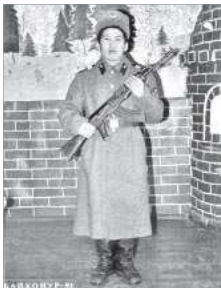
Служба в рядах Советской армии, 1991 г.