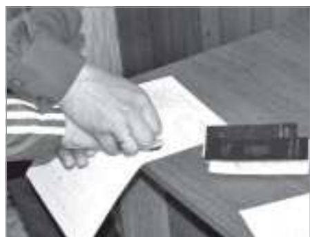
А пальчики-то вот они

Как известно, именно высокая миграционная привлекательность Ямала способствует притоку граждан из стран и ближнего, и дальнего зарубежья.