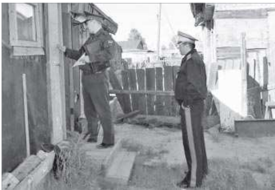
В зоне особого внимания - балки и вагоны

«Комплексное освоение месторождений полуострова Ямал и прилегающих акваторий наряду с развитием Северного морского пути и Северного широтного хода является основным направлением национальной политики в Арктической зоне. Дальнейшее развитие стратегических проектов потребует увеличения