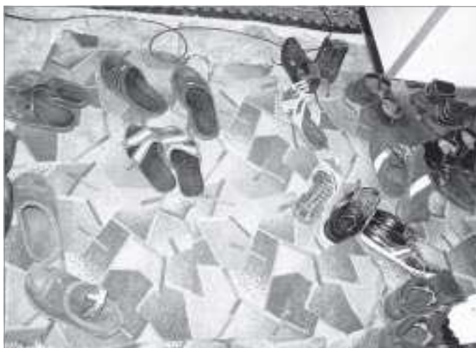
Наличие мужской обуви явно указывает: балок обжитой

за нарушения миграционного законодательства в соответствии с ч.1 ст.18.8. КоАП РФ на физическое лицо предусматривается наложение штрафа от двух до пяти тысяч рублей, но возможно и его выдворение за пределы РФ. ■