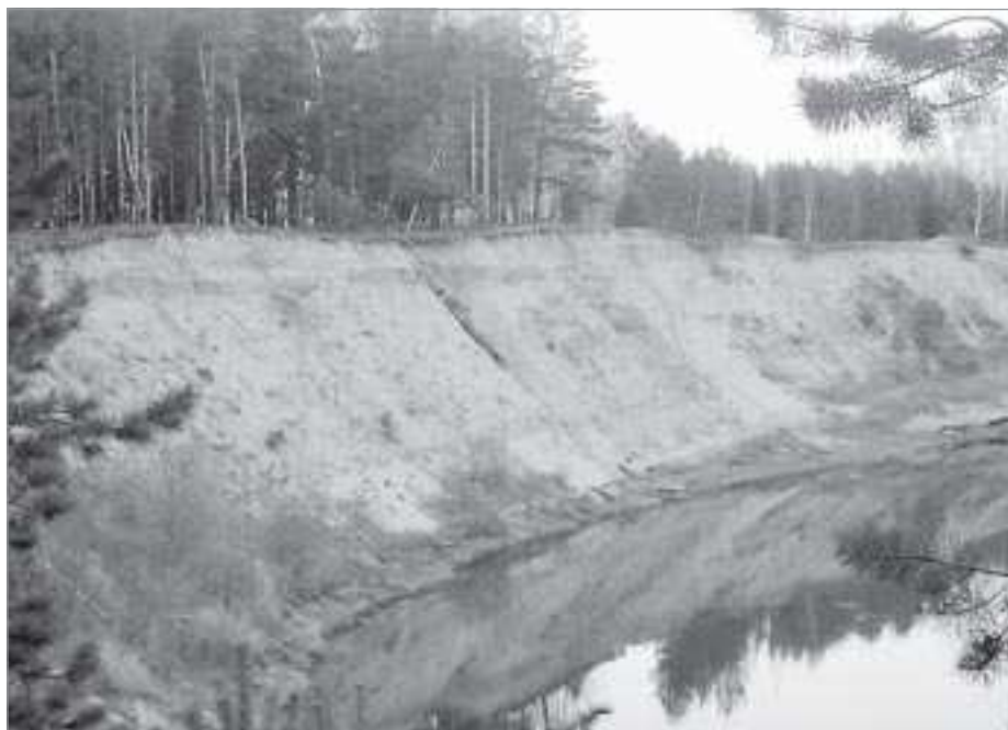
Живописные песчаные обрывы кое-где достигают 20 метров