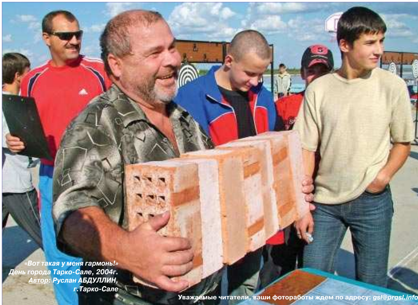
«Вот такая у меня гармонь!» День города Тарко-Сале, 2004г.