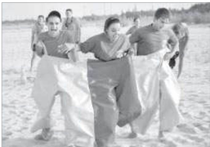
Бег в штанах «сиамские близнецы»

Утро началось с физической зарядки под веселую музыку. А вот пищу для завтрака пришлось добывать на охоте. В этот день участникам предстояло пройти еще не одно соревнование: пейнтбол, водные лыжи и полет с парашютом. В завершение дня ребятам дали задание построить пло-