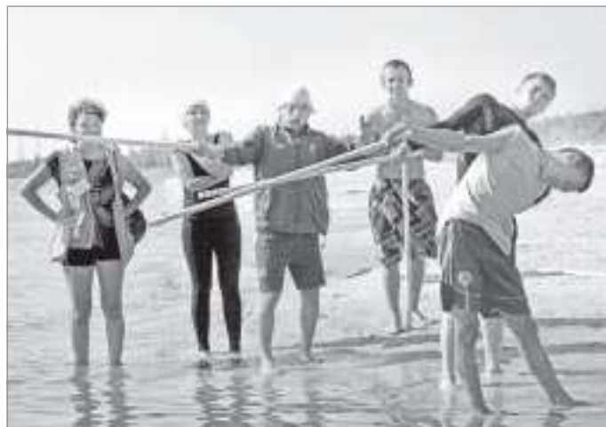
Кто дольше продержится, тот первым поплывет

После ознакомительных мероприятий игрокам предложили выбрать три предмета из десяти: ведро, поварешка,