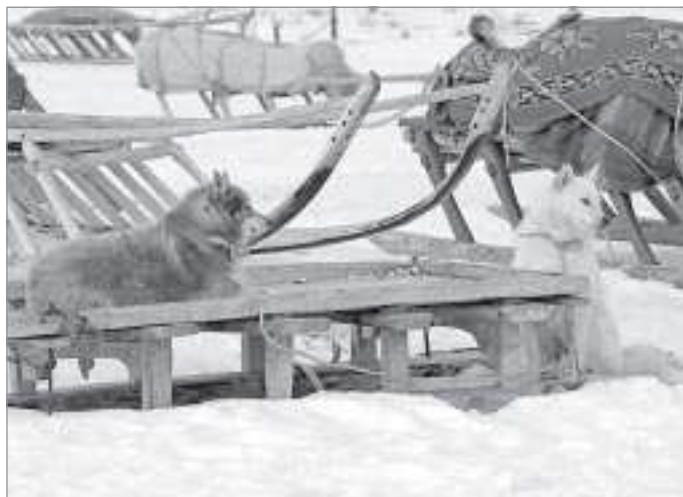
Собаки любят свою работу и готовы к ней всегда

туху перегонять стадо в нужном направлении, сгонять оленей в кучу». Еще более кратко об оленегонной лайке говорят биологи и работники сельского хозяйства в одной коллективной монографии: «Умелое применение собак при выпасе значительно повышает производительность труда».