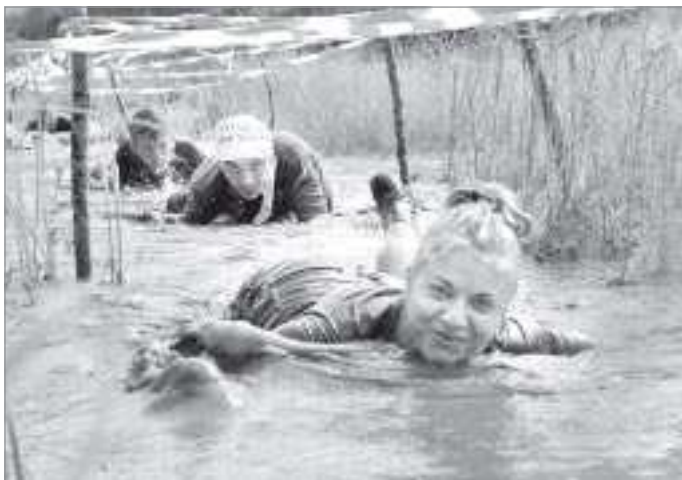
Ползком к заветной цели

Когда я подъехала к таркосалинскому пляжу, где проходил сбор, большинство участников уже находились там. Работающая молодежь из разных уголков Ямала с сумками и рюкзаками, заполненными походным скарбом из того, что разрешалось правилами взять с собой, с нетерпением ждала прибытия паром и предвкушала предстоящие приключения.