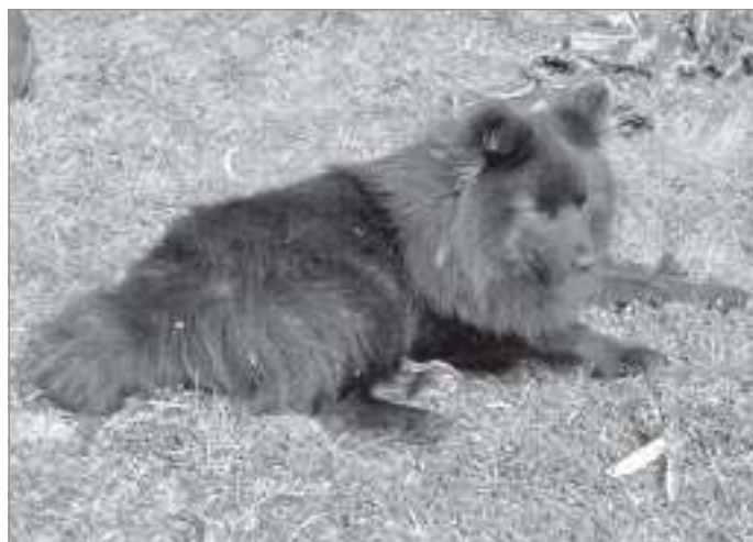
Алто - по-ненецки «собака черной масти»