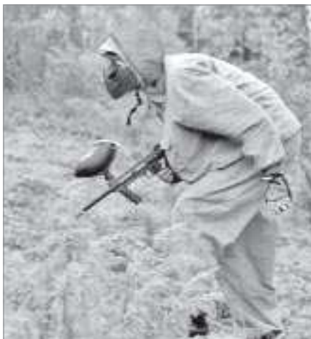
Соперник где-то рядом

ты для состязания, предусмотренного на следующий день. В качестве материала на строительство пошли стены разобранных хижин, пластиковые бутылки и все нетонущее, что ребята смогли найти в окрестностях своего поселения. У некоторых команд строительство затянулось настолько, что в эту ночь им удалось поспать часа три, не больше.