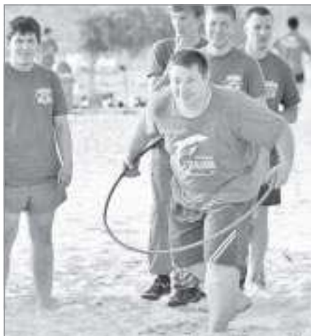
Эстафета с обручем

всего полчаса. Уговаривать никого не пришлось, участники тут же бросились в чащу и через некоторое время возвратились обратно с самым на тот момент ценным - пакетами с едой. Те, кому фортуна улыбнулась шире, добыли такое количество съестного, что его хватило бы не на один день.