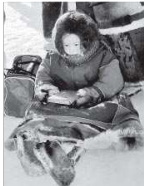
Я уезжаю в интернат