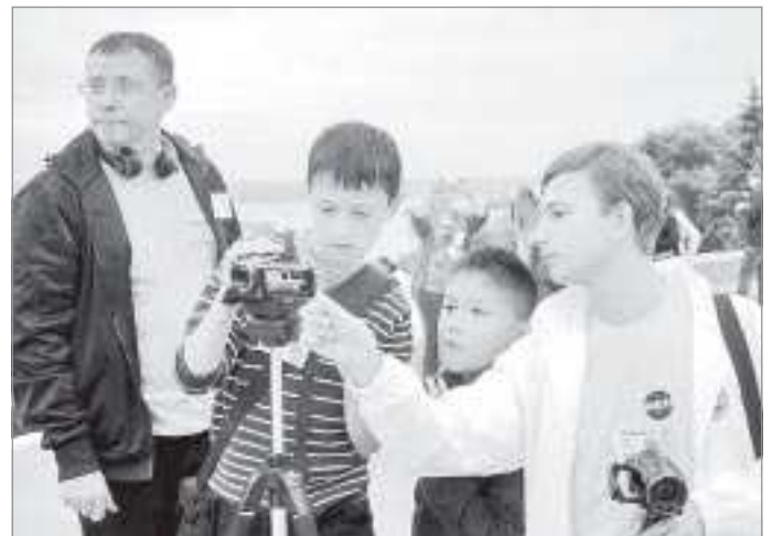
По материалам пресс-службы губернатора ЯНАО, собственных корреспондентов и внештатных авторов

Главный приз фестиваля - часы в форме корабельного якоря - теперь гордо украшает помещение студии «Радуга-Абэй».