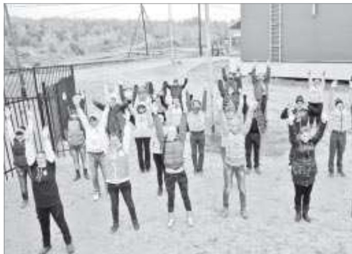
В здоровом теле - здоровый дух

яло провести три дня. Начало мероприятию было положено в пятницу, тринадцатого сентября. Несмотря на весь мистицизм даты и небольшие неудобства в пути, вечером делегация из 40 ак-