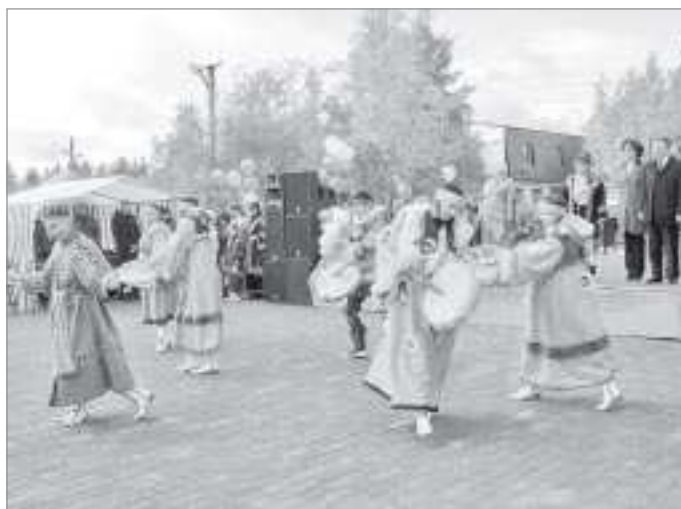
Выступление оркестра в сквере - новая добрая традиция