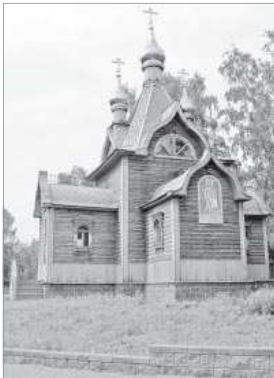
Церковь Иоанна Крестителя на водах