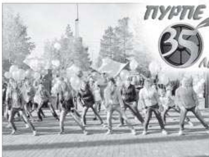
Юные пурпейцы - главная ценность поселка