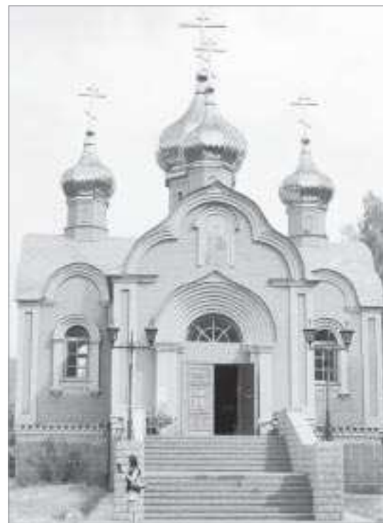
Церковь Димитрия Солунского

Зимой, в Крещение к источнику просто-напросто не пробиться. Чтобы окунуться в купель и получить благодать господню, многие люди приезжают за сутки. Летом, особенно в прохладную погоду, несколько проще, но на моей памяти Ачаирская купель не пустовала ни разу - ни в промозглые осенние дни, ни в снежные зимние. Вода из купели сбегает в небольшое озерцо, в котором приезжие тоже не прочь искупаться. В нем она не такая чистая, но, несмотря на это, своих полезных лечебных свойств не теряет. Летом монастырские поляны утопают в буйстве красок полевых цветов, а вдоль выложенных камнем тропинок цветут розы. Вокруг трапезной важно разгуливают хозяйские коты, деловито умываются и без инте-