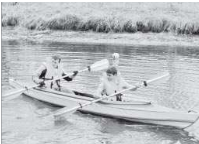
Командная гребля на байдарках