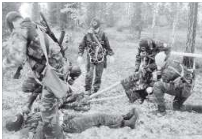
Тяжело в учении - легко в бою!

Разбившись на группы по шесть человек, ребята учились ориентироваться на местности с помощью карты и компаса. К привычным дисциплинам этой осенью добавилась и новая - инженерно-тактическая подготовка, в ходе которой рыли окопы, строили блиндажи. Обед для изучающих военное дело кадетов готовили в полевой кухне. Несмотря на плотный график занятий, ребята и занимающиеся в кадетских классах девочки выкраивали время, чтобы посидеть у костра, попеть песни под гитару.