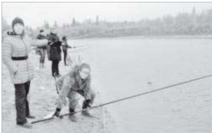
Примечательная черта соревнований - участие представительниц прекрасного пола

Поговорка «ОХОТА - ПУЩЕ НЕВОЛИ» ПОЛУЧИЛА НА МИНУВШЕЙ НЕДЕЛЕ СВОЕ НАГЛЯДНОЕ ПОДТВЕРЖДЕНИЕ В УРЕНГОЕ. НЕСМОТЯ НА СИЛЬНЫЙ ДОЖДЬ, В СУББОТУ НА БЕРЕГУ РЕЧКИ МАЛАЯ ХОДЫРКА, НЕДАЛЕКО ОТ МЕСТА ЕЕ ВПАДЕНИЯ В ПУР, СОСТОЯЛИСЬ СОРЕВНОВАНИЯ ПО СПОРТИВНОМУ РЫБОЛОВСТВУ.