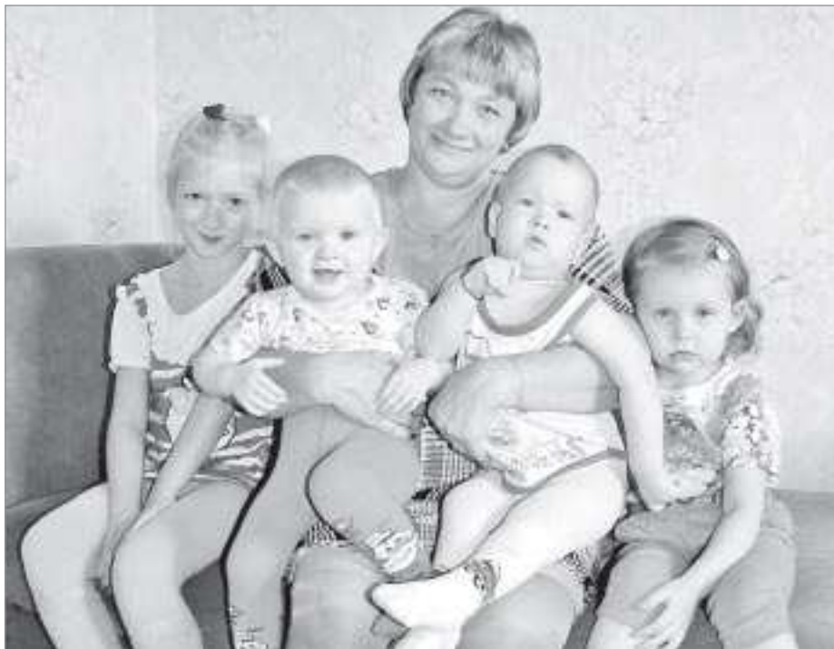
С младшими внуками, 2013г.

Родилась и выросла будущий воспитатель в городе Тюмени. Родители были, как она сама говорит, простыми работягами. Рядом со школой, в которой училась