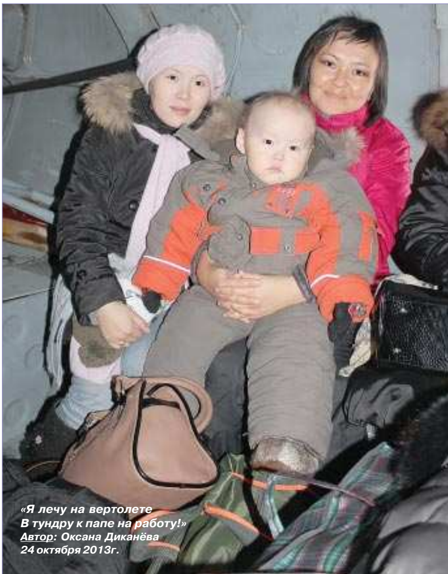
«Я лечу на вертолете В тундру к папе на работу!» Автор: Оксана Диканёва 24 октября 2013г.