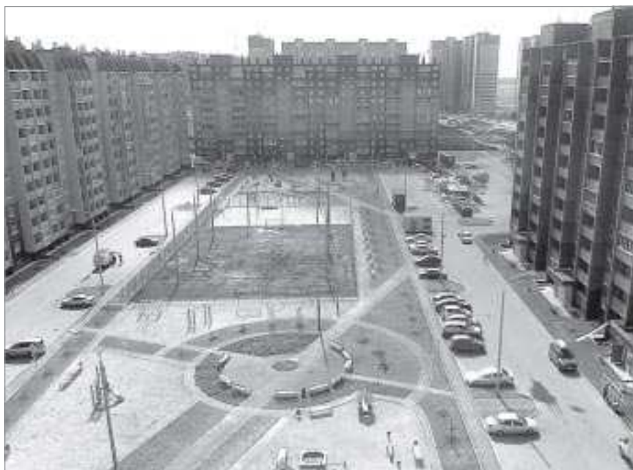
Новоселы запечатлили вид из окна на микрорайон

Ямальский-1 - жилой комплекс, состоящий из 14 многоэтажных домов. Общая площадь жилья, подготовленного здесь для ямальцев, - почти 140 тыс. кв. метров. Микрорайон построен практически за два года в рамках соглашения о сотрудничестве между ЯНАО и ОАО «Газпром», финансирование строительства осуществлялось в пропорции «50 на 50».