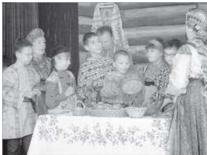
Посиделки - основная форма досуга

«Снаступлением осени и промыслового сезона в крестьянской среде коми-зырян едва ли не главной формой досуга становились посиделки, - рассказывал один из участников команды. - Они начинались с праздника Покрова Пресвятой Богородицы и за-