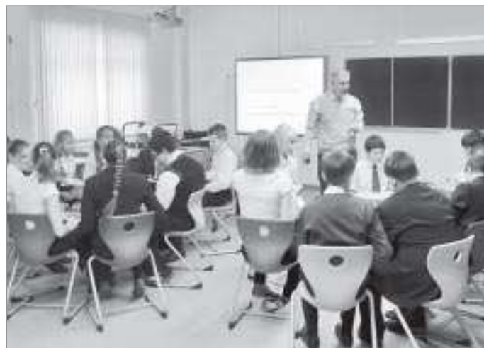
Работа в группах развивает навыки общения детей

Постоянно модернизируемые, с учетом особенностей учащихся, методики преподавания позволяют педагогам не только более четко составить образовательный маршрут ребенка, но и создать благоприятные условия для целостного развития его личности.