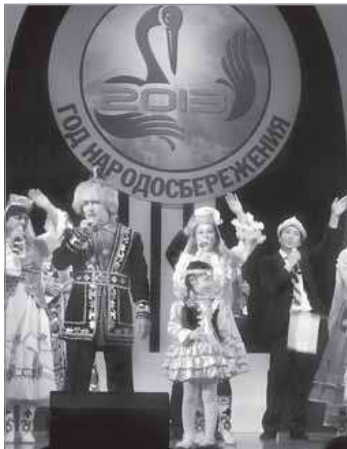
В концерте приняли участие артисты десяти национальностей

Примечательно, что организаторам мероприятия удалось в рамках всего одного дня продемонстрировать горожанам множество разных направлений в общественной жизни Ноябрьска. Каждый человек мог познакомиться с этнографией Ямала, фольклором и традициями народов, живущих по соседству, их прикладным творчеством. Среди посетителей форума были те, кто инте-