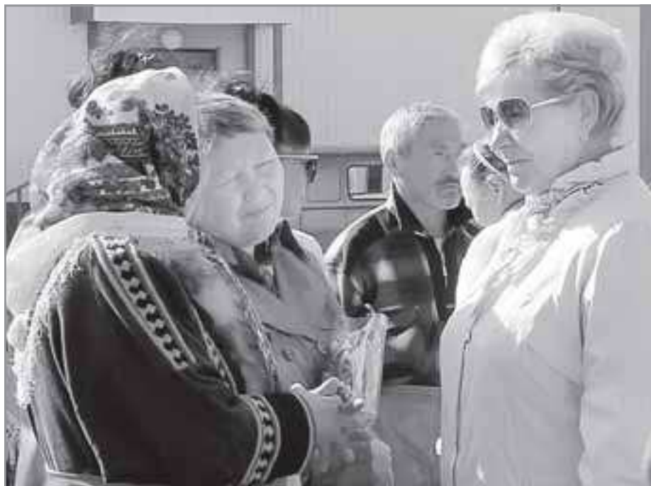
Люди доверяют представителю губернатора

- Сейчас необходим, возможно даже, куда больше, чем в 2011 году. Люди доверяют представителям губернатора. Делятся с нами тем, что волнует, высказывают переживания. Считаю, что институт