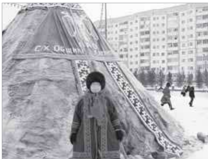
На окружном празднике оленеводов в г.Надыме