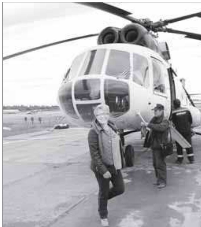
Вертолет - самый лучший вид транспорта на Ямале в любое время года