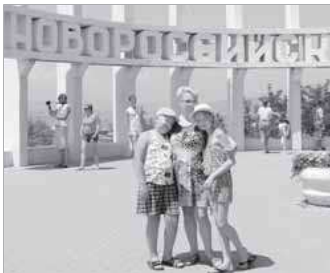
У сына и дочери есть способности к сочинительству