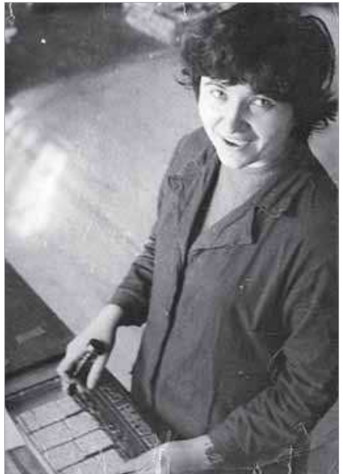
Верстка газетной полосы, 1980 год

Там поступила в ГПТУ-18. Группа наборщиков ручного набора была самой малочисленной в училище - всего шестнадцать человек. В самом училище девочек учили обязательной теории и тому, как изготавливать бланочную продукцию. Для этого в подвале здания была оборудована комната. К сожалению, за два года учебы будущие наборщики всего однажды побывали в Тюменской областной типографии, где им, как обычным экскурсантами, а не перспективным практикам, был