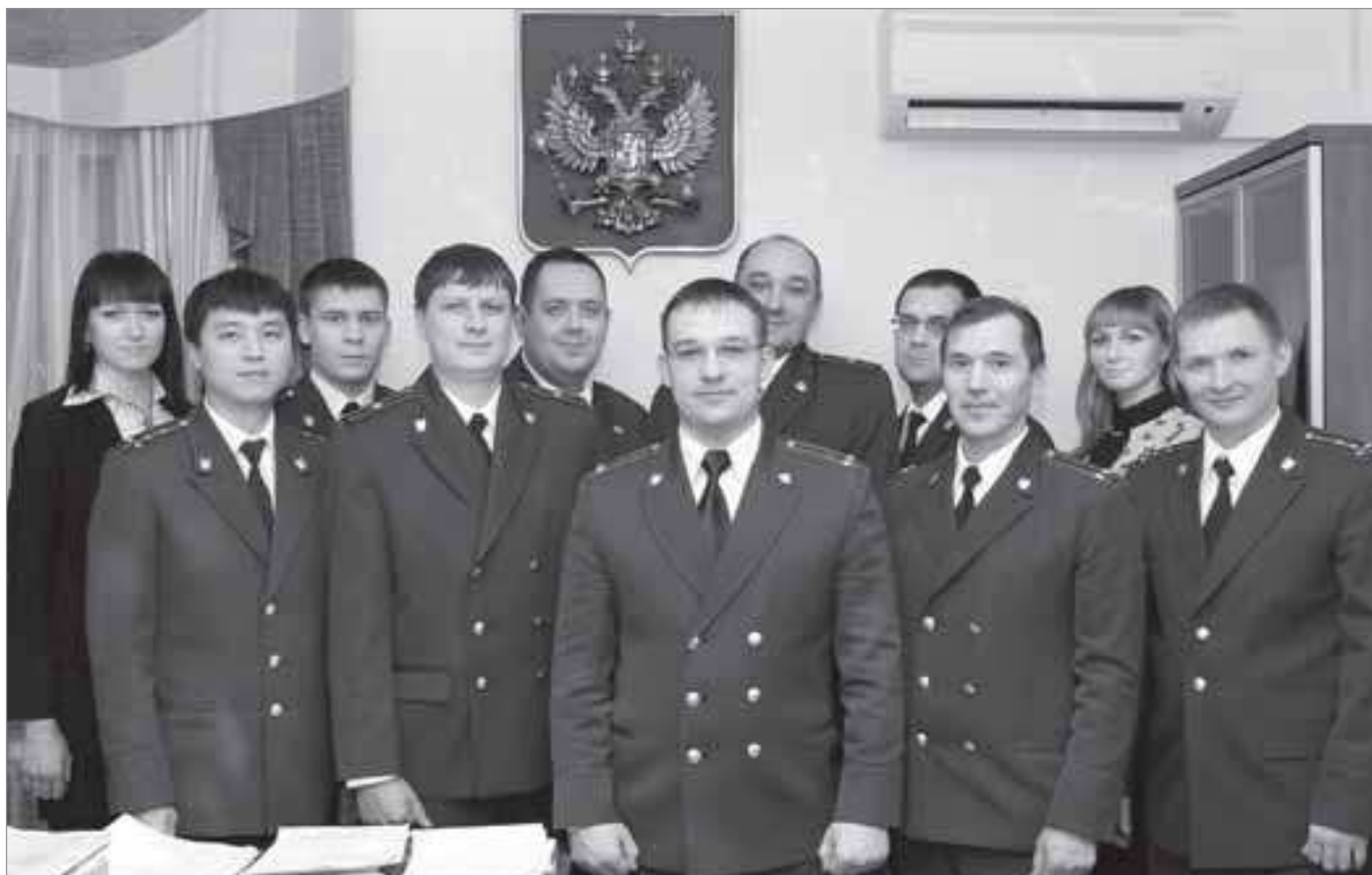
Коллектив прокуратуры Пуровского района, декабрь 2013г.

- Хочу пожелать профессионального роста, удовлетворения от честно выполненной работы, семейного благополучия и душевного равновесия. ■