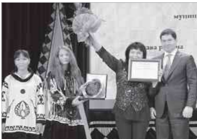
Глава района вручает грант учреждениям культуры Самбурга

В 2013 году мероприятие проводилось среди национальных поселков района: Халысавай, Харампур, Самбург. Каждое поселение представило свои достижения в области сохранения и развития самобытности национальной культуры и народного творчества: уникальные изделия мастеров декоративно-прикладного искусства, лучшие концертные номера творческих коллективов и исполнителей, хореографию, вокал, инструментальное творчество. Все многообразие красок национального колорита радовало и восхищало благодарных зрителей.