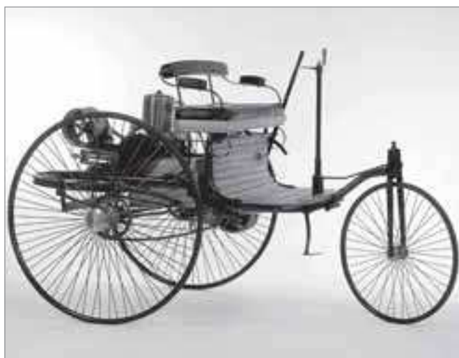
«Прародитель» современного авто - Motorwagen...

29 ЯНВАРЯ 1886 ГОДА ВПЕРВЫЕ В ИСТОРИИ ЧЕЛОВЕЧЕСТВА НЕМЕЦКИЙ ИНЖЕНЕР - ИЗОБРЕТАТЕЛЬ КАРЛ БЕНЦ ПОЛУЧИЛ ПАТЕНТНОЕ СВИДЕТЕЛЬСТВО НА АВТОМОБИЛЬ С БЕНЗИНОВЫМ ДВИГАТЕЛЕМ. ЭТА ДАТА СТАЛА ОФИЦИАЛЬНЫМ ДНЕМ РОЖДЕНИЯ ТРАНСПОРТНОГО СРЕДСТВА - АВТОМОБИЛЯ, БЕЗ КОТОРОГО НЕМЫСЛИМА СОВРЕМЕННАЯ ЖИЗНЬ.