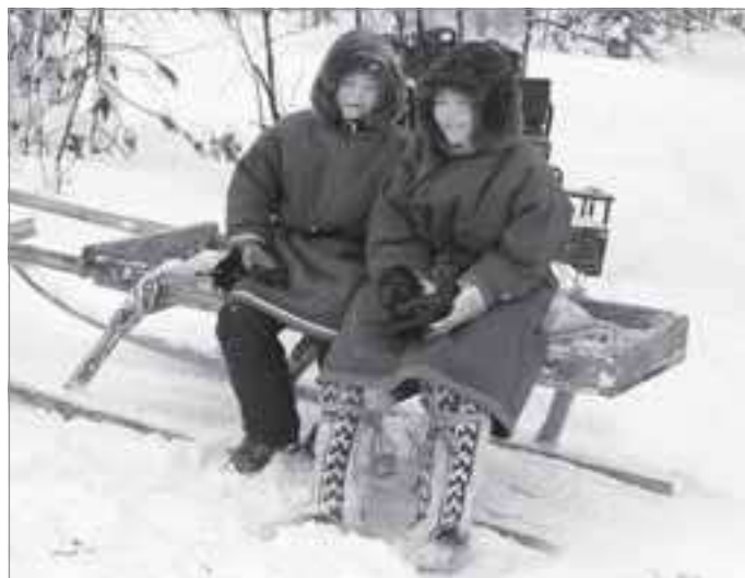
В Самбурге образовательный процесс основан на этнокультурных ценностях и трудовом воспитании

Пятнадцать женщин являются чумработницами. Всего среди опрошенных было 72 человека, рабочая деятельность которых напрямую связана с нахождением в стойбище или на месте вылова рыбы. Восемнадцать анкетированных не определились, к какой категории себя отнести. Две дамы идентифицировали себя как домохозяйки. Еще четыре голоса принадлежат пенсионерам, уборщице и безработному. Стоит полагать, что часть людей из этих двадцати четырех также трудятся в традиционных отраслях хозяйствования. По данным того же опросника, семьдесят кочевников заявляют, что их работа в тундре носит постоянный характер. Временно трудоустроены шесть человек.