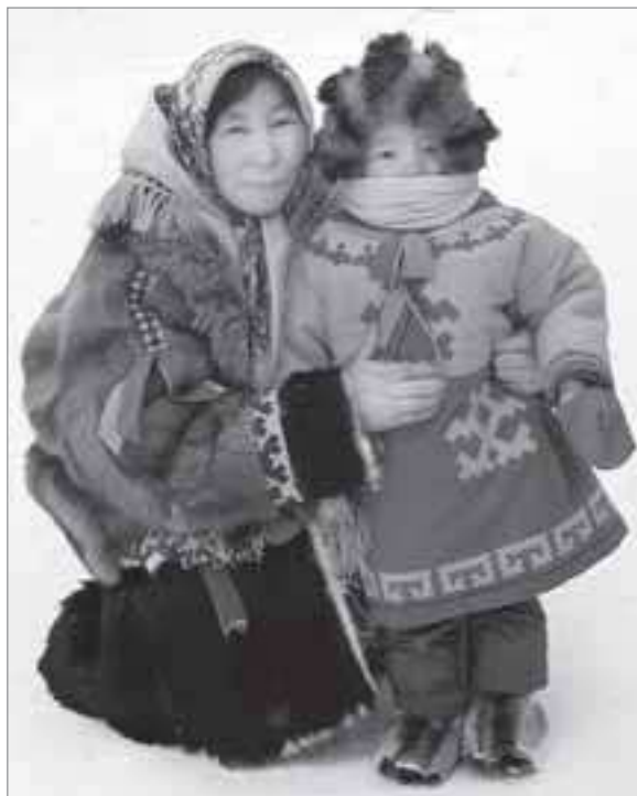
Только родители вправе решать, где и как будет учиться их ребенок

Среди респондентов в возрасте от 20 до 30 лет было одиннадцать человек, от 31 до 40 - тридцать девять, от 41 до 50 - тридцать три, от 51 до 60 - одиннадцать, от 61 до 70 - два. Самбургская школа образована летом 1937 года, поэтому смело заявляю, что в прошлом подавляющее большинство всех опрошенных - это ученики разных лет сего учебного заведения. А значит, условия обучения и проживания в данном образовательном учреждении и местные порядки для них являются известными, другими словами, привычными. Более того, здесь трудятся педагоги, у которых когда-то учились родители сегодняшних школьников. Или за учительскими столами стоят их бывшие одноклассники, соседи по комнате в интернате или даже близкие-дальние родственники. Значит, сложностей в налаживании диалога ни с одной стороны быть не может абсолютно никакого: все знают друг друга.