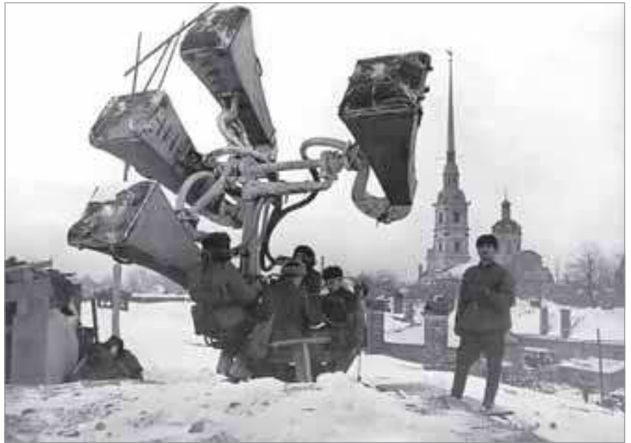
Защитники Ленинграда слушают небо

УТРОМ 13 МАЯ 1942 ГОДА В ДВЕРЬ ОДНОЙ ИЗ ЛЕНИНГРАДСКИХ КВАРТИР ПОСТУЧАЛИ. НА ПОРОГЕ СТОЯЛА СОСЕДСКАЯ ДЕВОЧКА ТАНЯ 12 ЛЕТ ОТ РОДУ. «МОЯ МАМА УМЕРЛА. Я ОСТАЛАСЬ ОДНА. ПОМОГИТЕ ОТВЕЗТИ ТЕЛО». ЧЕРЕЗ ДВА С НЕБОЛЬШИМ ГОДА ЭВАКУАЦИИ ЮНАЯ БЛОКАДНИЦА УМЕРЛА ОТ ИСТОЩЕНИЯ. ОБЫЧНАЯ ПО ТЕМ ВРЕМЕНАМ ИСТОРИЯ. ОБЫЧНАЯ И ОТТОГО СТРАШНАЯ. НЕСКОЛЬКО ЛИСТИКОВ БЛОКНОТА, ИСПИСАННЫХ НЕРОВНЫМ ДЕТСКИМ ПОЧЕРКОМ С ДАТАМИ СМЕРТИ БЛИЗКИХ, ПОЗВОЛИЛИ ТАНЕ САВИЧЕВОЙ НЕ КАНУТЬ В БЕЗВЕСТНОСТЬ. ОСТАЛЬНЫЕ БЫЛИ ЛИШЕНЫ И ЭТОГО. НЕИЗВЕСТНА СУДЬБА СОТЕН ТЫСЯЧ УМЕРШИХ В ЗАМКНУТОМ ПРОСТРАНСТВЕ БЛОКАДНОГО ЛЕНИНГРАДА. МЫ ЗНАЕМ О 872 ДНЯХ ОСАДЫ НЕПОКОРЕННОГО ГОРОДА. И МЫ НЕ ЗНАЕМ О НИХ НИЧЕГО.