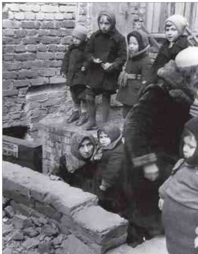
Бомбежка окончена. Можно возвращаться домой

Отдельная тема - дети осажденного города. Они трудились на «оборонку» наравне со взрослыми, защищали Ленинград. Известная страница в истории блокады - борьба горожан с «зажи-