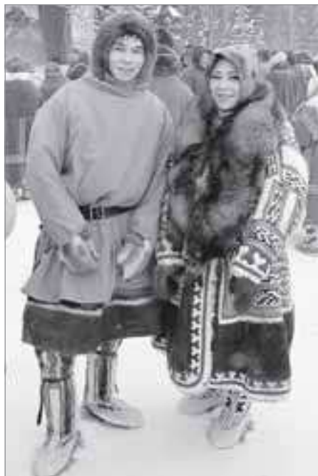
Было много красивой молодежи в яркой национальной одежде

Молодежь тоже не отстает, что называется, наступает на пятки профессионалам. Чего стоит управление оленьей упряжкой без хорея - а было на соревнованиях и такое. У двадцатичетырехлетнего