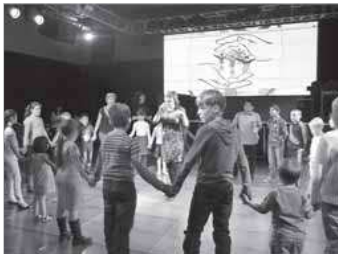
«Веселый выходной» в «Апельсине»

Выражаю огромную благодарность всем, кто уже отклик-