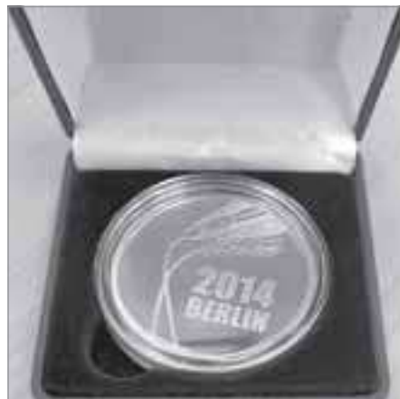
Заслуженная награда европейского агропрома

В этом году ООО «Пур-рыба» исполняется 10 лет. Много это или мало, зависит от личного отношения к происходящим событиям. Только одни жалуются на тяже-