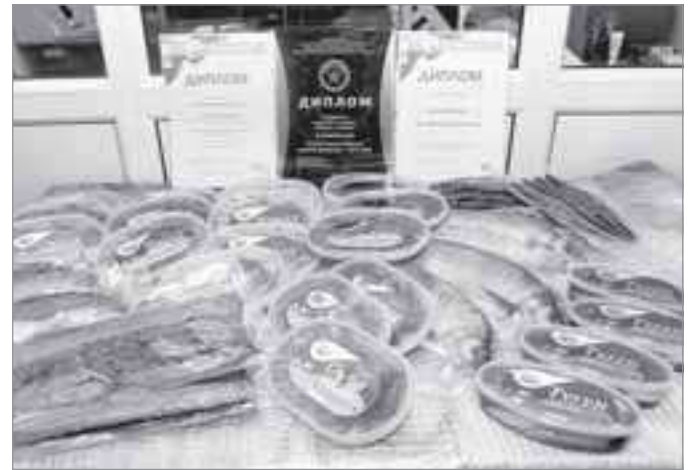
Ассортимент поражает воображение

К сожалению, предприятие пока не в состоянии поставлять товар на междуна-