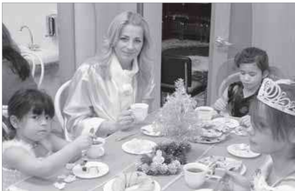
Новогодний сладкий стол в детском приюте «Луч надежды»