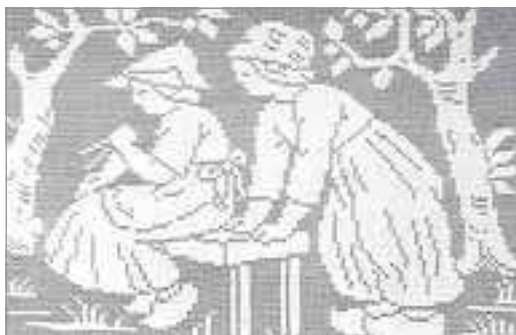
Одна из картин, вывязанных крючком

им и стараюсь принять справедливое решение.