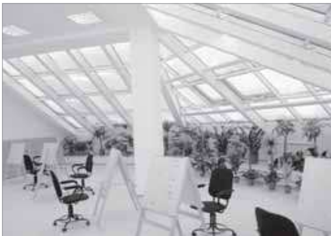
Изостудия в новом здании детской школы искусств

колаевич ознакомился с графиком работ и соблюдением требований к качеству строительства, проверил сметную документацию объекта. Корпус, сдача которого также запланирована в этом году, рассчитан на 425 детей, общая его площадь свыше 16,5 тысячи квадратных метров.