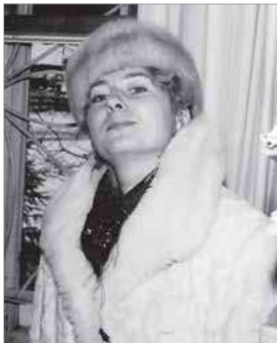
В старом здании суда, 1995 год

И вне зависимости от погодных условий и моего местонахо-