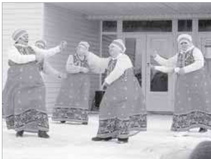
В этот день звучали народные песни

НАРОДНЫМИ ГУЛЯНИЯМИ ОТМЕТИЛИ В МИНУВШИЙ ВЫХОДНОЙ ВЕСЕЛУЮ МАСЛЕНИЦУ В ПОСЕЛКЕ УРЕНГОЕ.