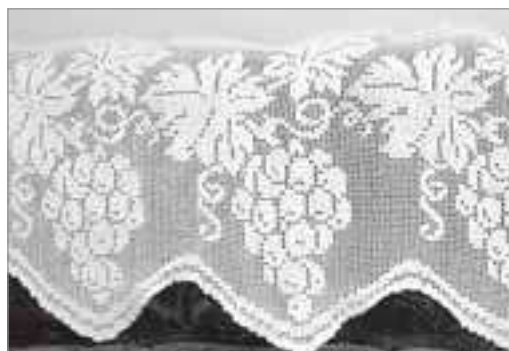
Занавеска в технике филейного вязания

Я счастливый человек. Говорю это абсолютно искренне, потому что всю жизнь занимаюсь тем, что люблю: у меня любимая работа и любимые увлечения. ■