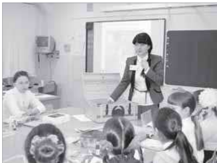
На одном из открытых уроков

Воспитанники детсада совершили чудесное путешествие в Олимпию, где получили первое представление об Олимпийских играх как части общечеловеческой культуры, мирного соревнования, в котором участвуют народы разных стран. Дети побывали в мастерской народных кукол, научились делать куклу добрых вестей «Колокольчик», узнали о многообразии камней, познакомились с государственными символами России, торжественно, с уважением и любовью учились произносить главные слова: «моя Родина», «моя Россия», весело играли с матрешками - народными символами нашей страны. Воспитанники старшей группы детского сада «Радуга» учились радоваться полученным результатам, доводить начатое дело до конца, помогать близким в трудной ситуации. Дети из средней группы получили элементарные математические представления через игровую, коммуникативную, познавательную-исследовательскую деятельность.