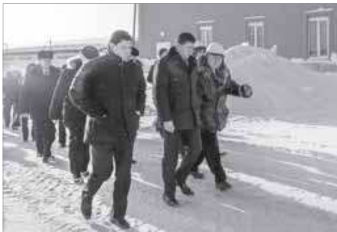
Экскурсия по цехам для губернатора округа и главы района

Все зависит от проекта. Если он составлен с умом, то строители возведут отличный дом, тогда как по безграмотному проекту даже высококлассные профессионалы соорудят некачественное строение. Виной тому могут служить и отвратительные сопутствующие материалы, будь то сырье для крыши, фундамента или утепления. В итоге мы получаем те дома, что составляют большую часть жилого фонда во многих населенных пунктах района и соответствующее отношение людей к деревянному жилью. Во всем мире деревянные дома являются самыми дорогими и престижными. У моего друга, профессора из Гамбурга, великолепный каменный особняк. А я подарил ему деревянную баню. Так вот ей он гордится больше, чем своим замком. Все коллеги ему завидуют - ведь замки то и у них есть, а настоящей бревенчатой бани - нет. В последнее время он в ней и работает, и принимает гостей.