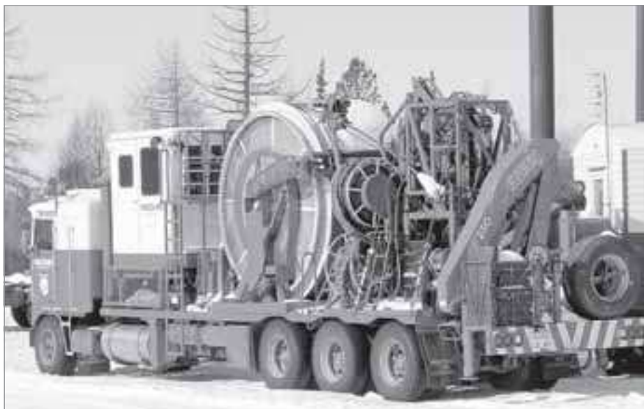
Технический парк предприятия постоянно совершенствуется

Одна из приоритетных задач для компании - модернизация производства и внедрение передовых технологий. Пошел уже четвертый год, как в ЯПС при промыслово-технических исследованиях приступили к использованию установки ГНКТ, имеющей целый ряд очевидных преимуществ перед промыслово-геологическими исследованиями, проводимыми с забойным трактором. «Одно из них - равномерная скорость и качественная запись на спуске в горизонтальной части скважины», - поясняют специалисты. Другим, по