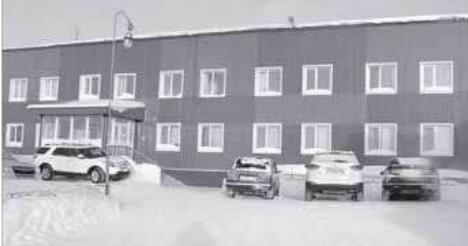
Старое административное здание, в котором расположено ООО «Ямал Петросервис»

И вообще, на предприятии убеждены, что трудности на то и существуют, чтобы их героически преодолевать. Что они с успехом и делают. И сегодня, в преддверии Дня геолога, который, как ни смотри, является их профессиональным праздником, поздравляем коллектив ООО «Ямал Петросервис» и по традиции желаем всем сотрудникам новых успехов в труде, здоровья и счастья в личной жизни! ■