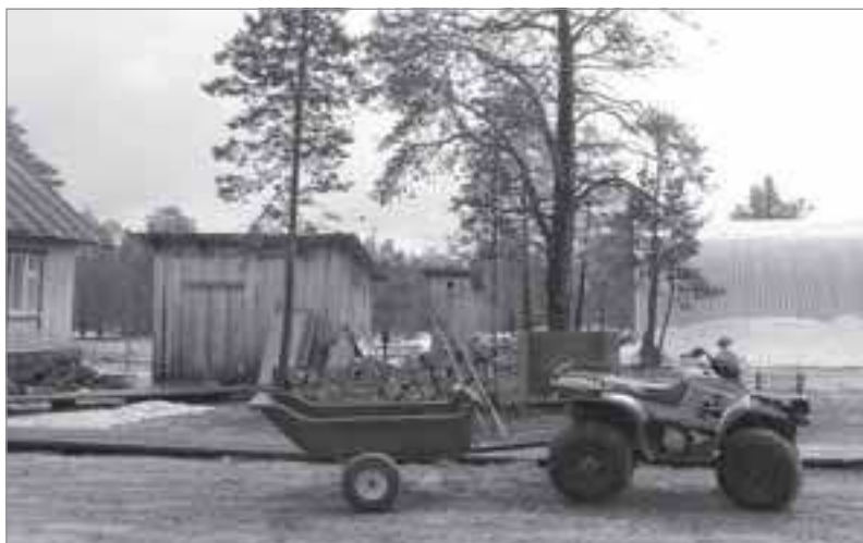
Обычный пейзаж на факториях Пуровского района

Воочию оценив масштабы деятельности факторий, которые по факту являются производственными предприятиями с современным оборудованием и обеспечивают дополнительные рабочие места для коренного населения, директор окружного департамента Вячеслав Кучеренко отметил, что сегодня нужно искать новые механизмы для их финансирования. ■