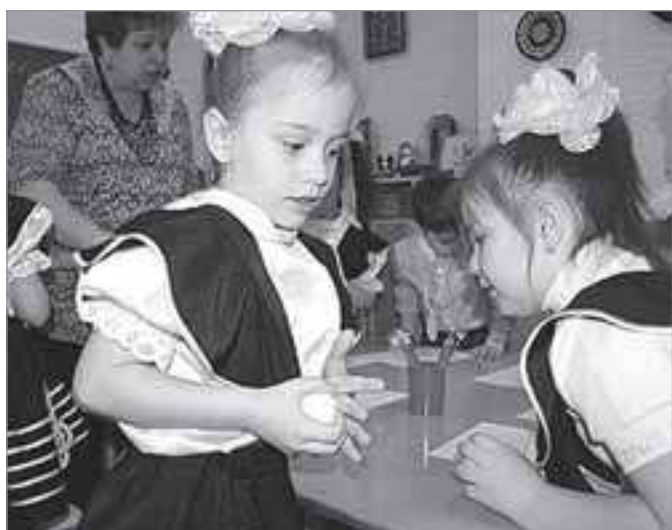
Эксперименты с бумагой: весело и познавательно

Автор: Наталья КИРИЛЛОВА, методист МКУ ИМЦРО